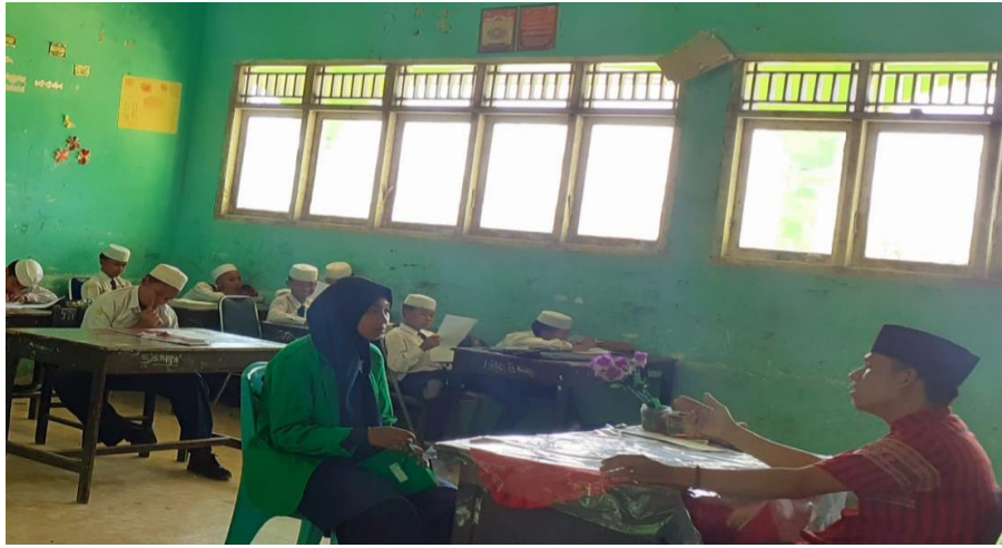
مقابلة بمدرس اللغة العربية