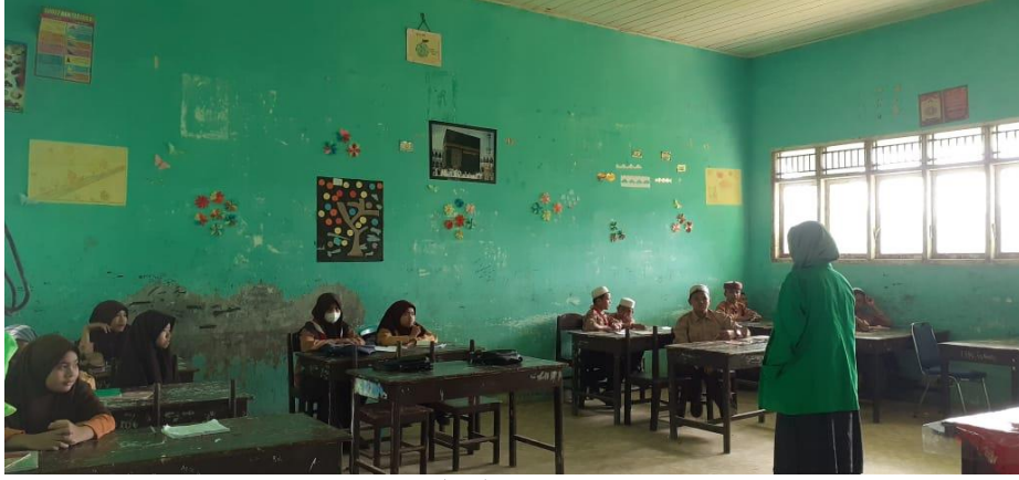
برنامج حفظ الفردات ١