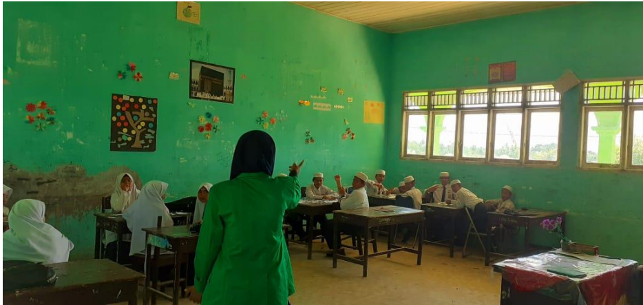
برنامج حفظ الفردات ٢