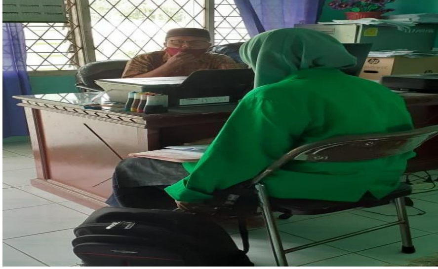
مقابلة برئيس المدرسة