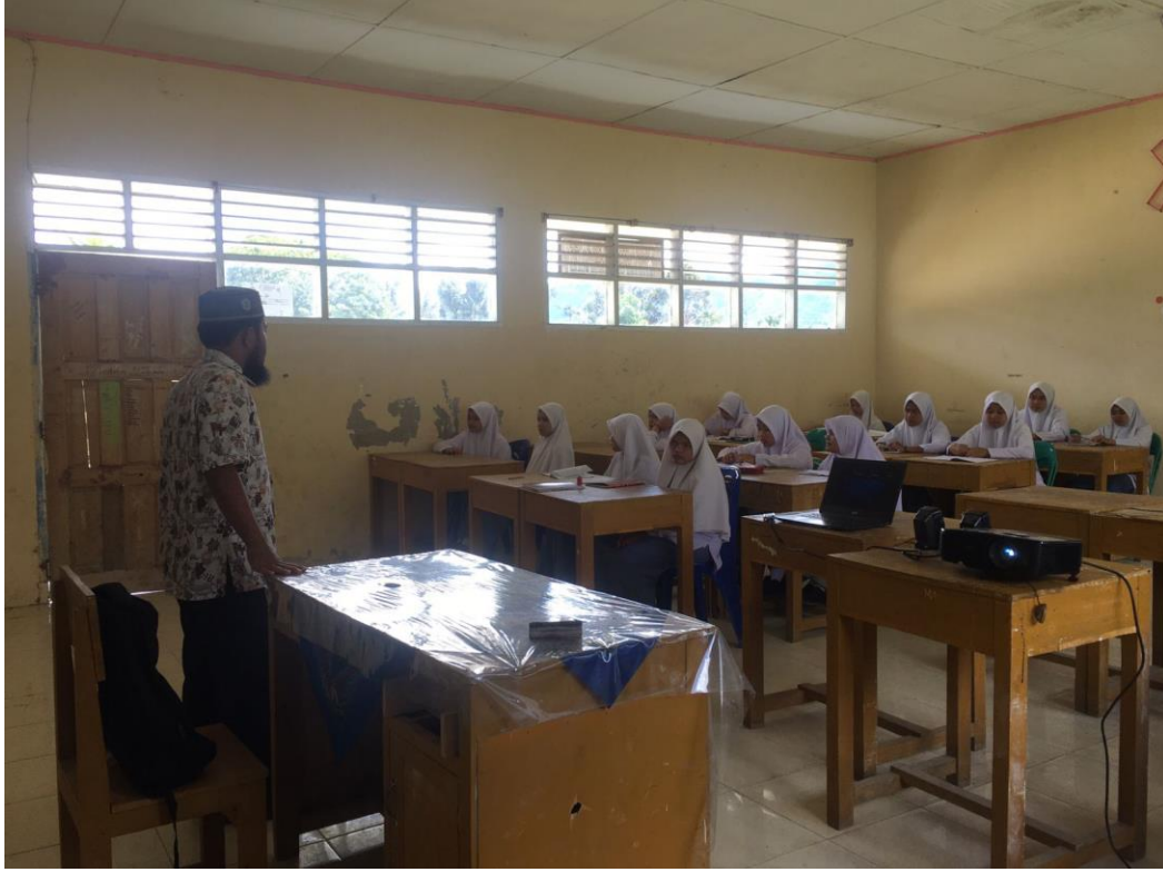
صورة : مقابلة مع أستاذ قواعد اللغة العربية