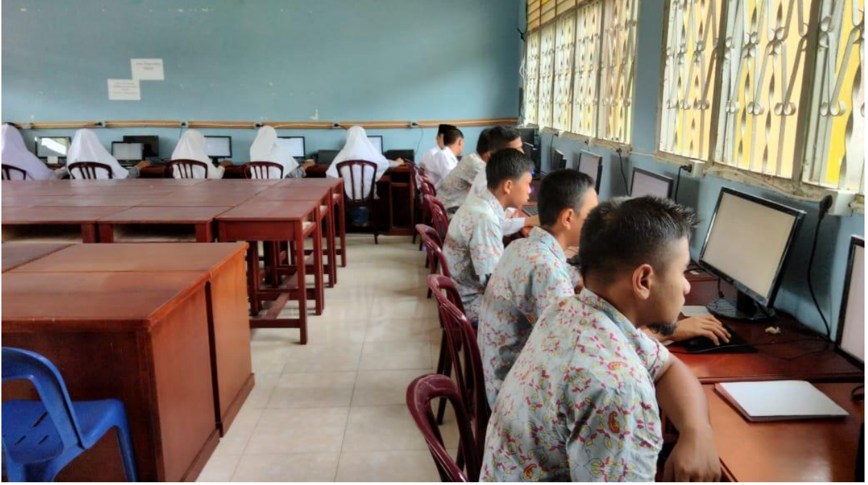
صورة : الميدان