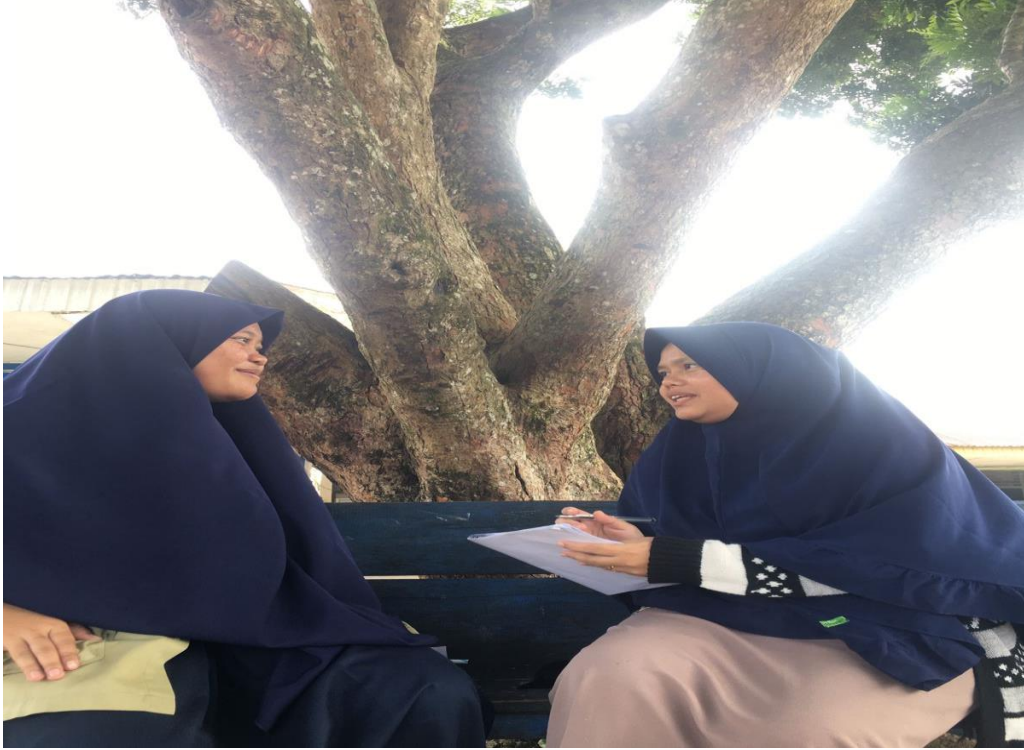
صورة: مقابلة مع الطالبة