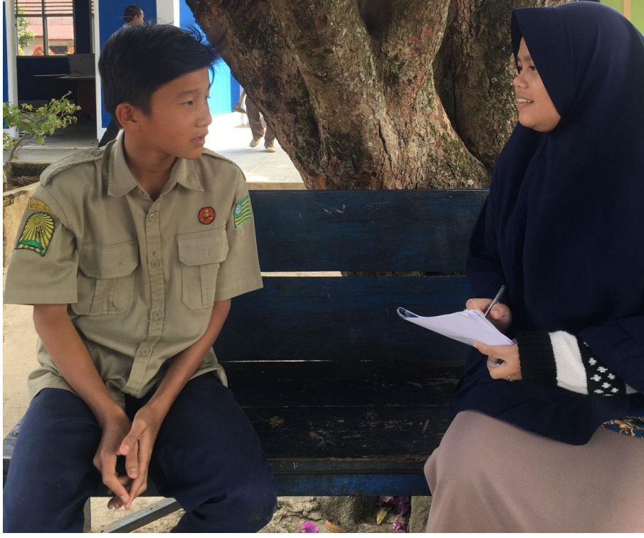
صورة: مقابلة مع الطالبة