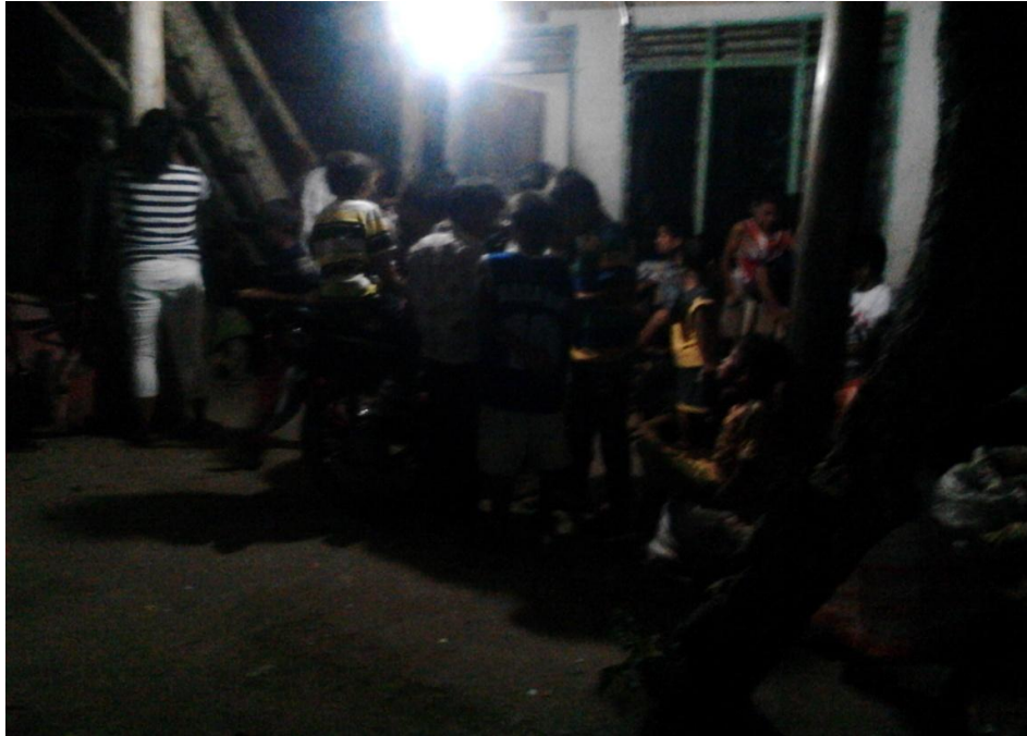
Gambar 1.4: Kaum Ibu lebih memilih bercerita-cerita membuang waktu mereka dan sedikitnya kaum Bapak/Ibu yang menghadiri acara pengajian Rutin di Mesjid Baitul-Rahman setiap minggunya.