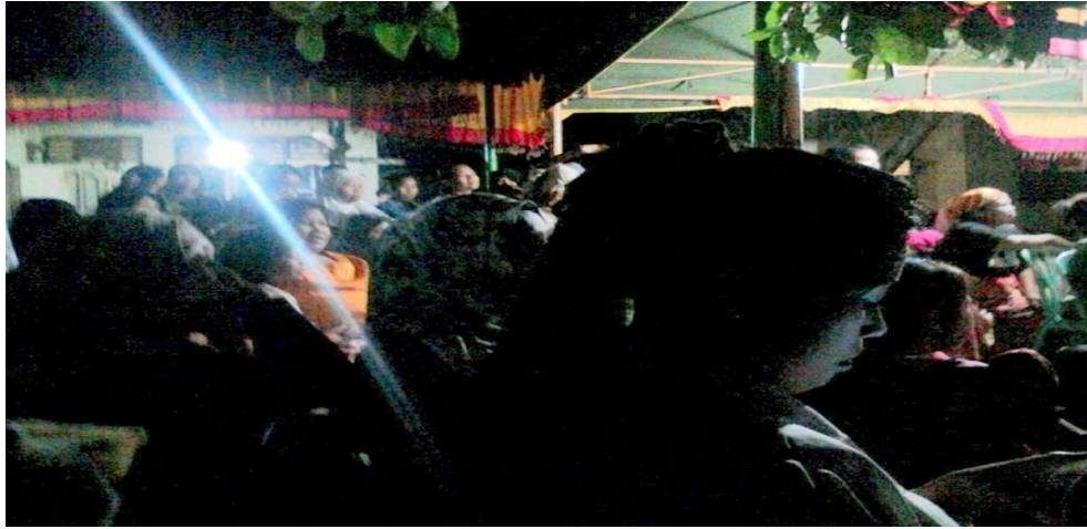
Gambar 1.3: Kegiatan anak-anak di warung Internet antri untuk main game dan kebiasaan bermain keluyurn malam dari pada belajar baik hari-hari sekolah maupun hari libur