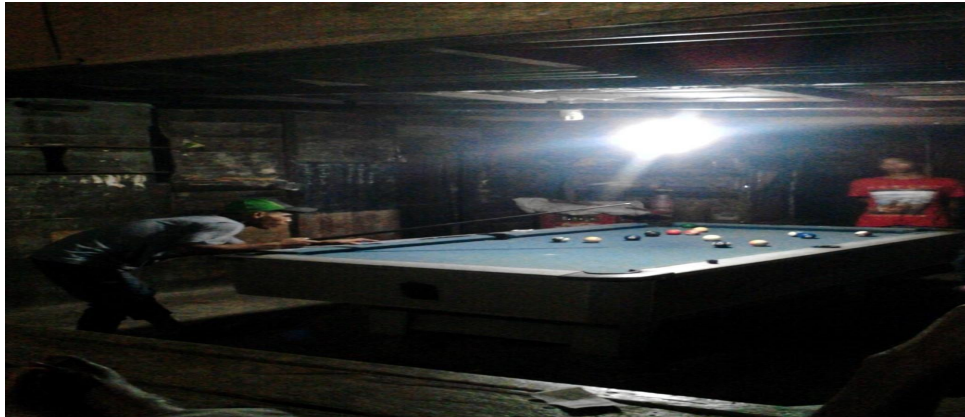
Gambar 1.1: Kebiasaan yang sering dilakukan Bapak-bapak di warung kopi dan tempat bermain biliard