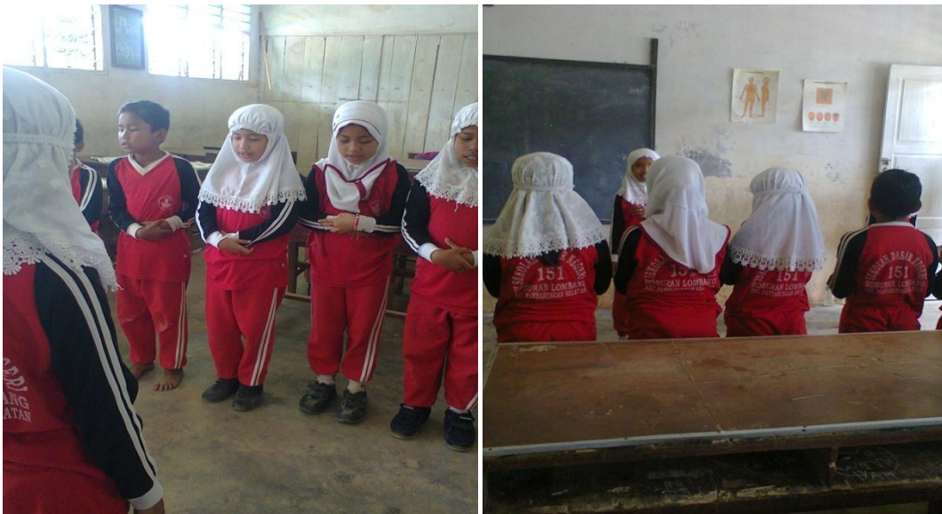
Gambar : praktek shalat berkelompok