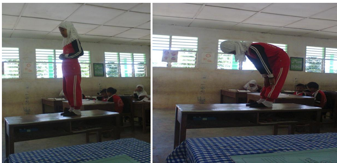
Gambar : praktek shalat perindividu