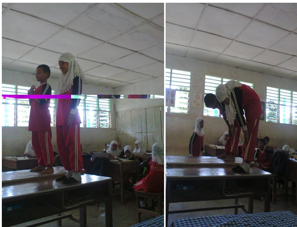
Gambar : praktek shalat berpasangan