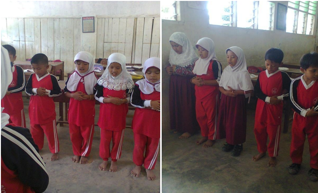
Gambar : praktek shalat fardhu perbarisan