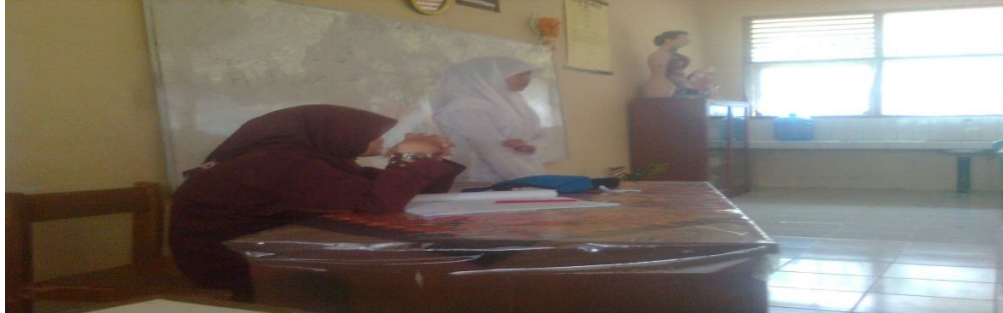
Pelaksanaan latihan muhadarah dengan menyuruh salah satu siswi untuk tampil kedepan