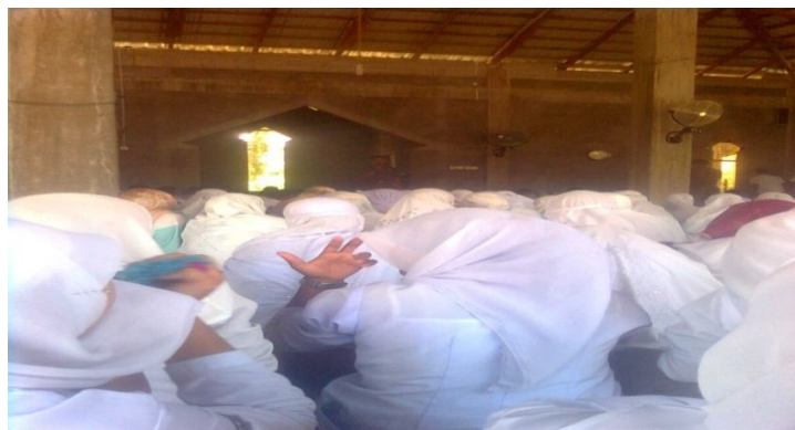
Pemberian ceramah setelah siap sholat zuhur