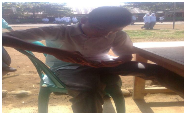
Salah satu siswa yang sedang mengaji ketika jam istirahat