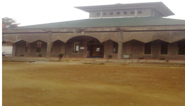
Mesjid MAN Lembah Melintang