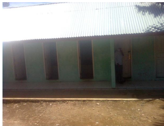
Kamar whudu' MAN Lembah Melintang