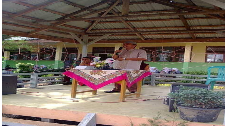
Ceramah salah satu guru PAI MAN Lembah Melintang ketika acara isra' mi'raj