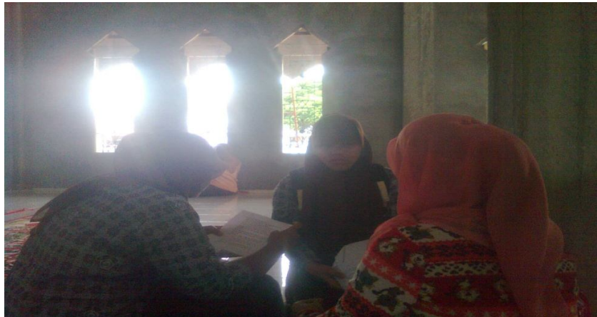
Wawancara dengan siswi MAN Lembah Melintang