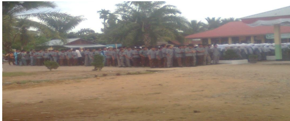
Siswa-siswi MAN Lembah Melintang ketika mengadakan muhadarh