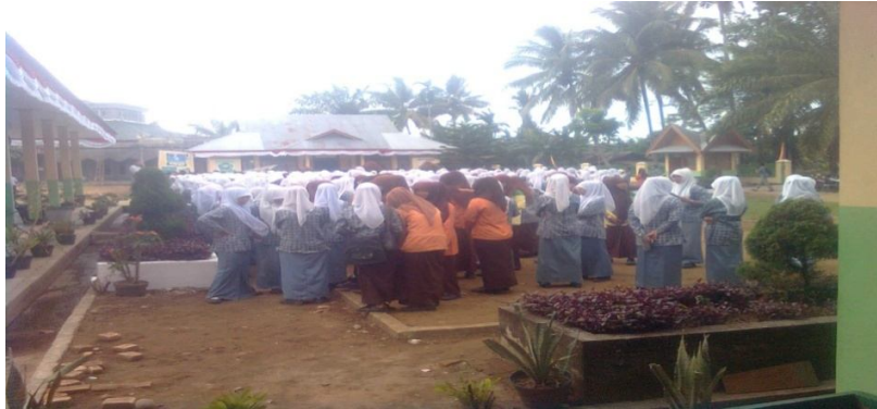
Siswa-siswi ketika akan mengadakan muhadarah