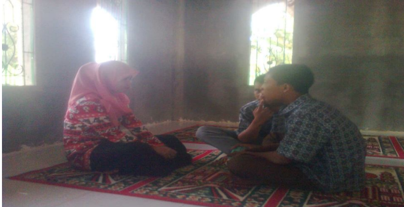
Wawancara dengan siswa MAN Lembah Melintang