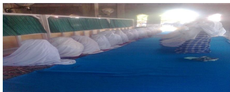
siswi MAN Lembah Melintang ketika mengadakan shalat zuhur berjama'ah