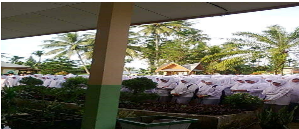
Siswa-siswi ketika di berikan pengarahan