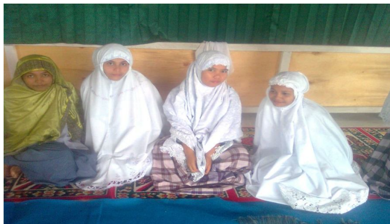
Bersama siswi setelah pelaksanaan shalat zuhur berjama'ah