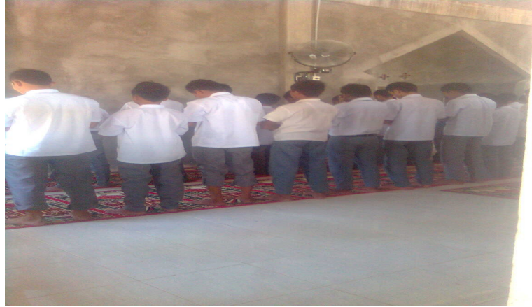
Siswa MAN Lembah Melintang ketika mengadakan shalat zuhur berjama'ah