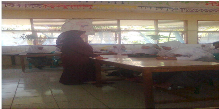
Pemberian bimbingan oleh guru PAI setelah selesai penampilan siswa-siswi dalam latihan muhadarah