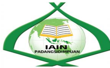
Gambar 4.1 Lambang IAIN Padangsidempuan

Lambang institut terdiri dari unsur-unsur dan geometris visual yang memiliki pengertian sebagai berikut: