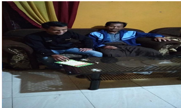
Wawancara dengan Alim Ulama Desa P. Kahombu