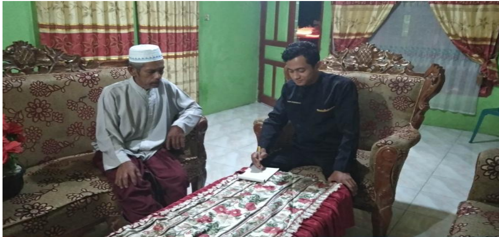
Wawancara dengan Alim Ulama Desa P.Kahombu