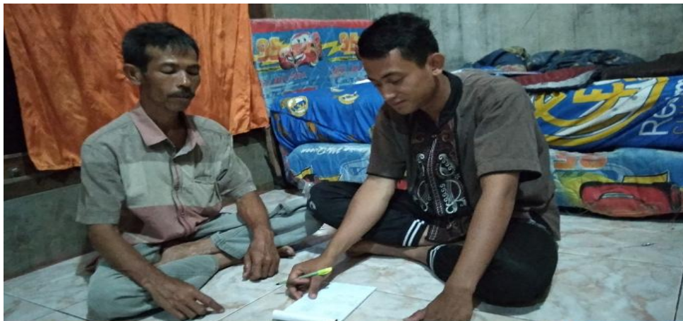
Wawancara dengan Masyarakat Desa P. Kahombu