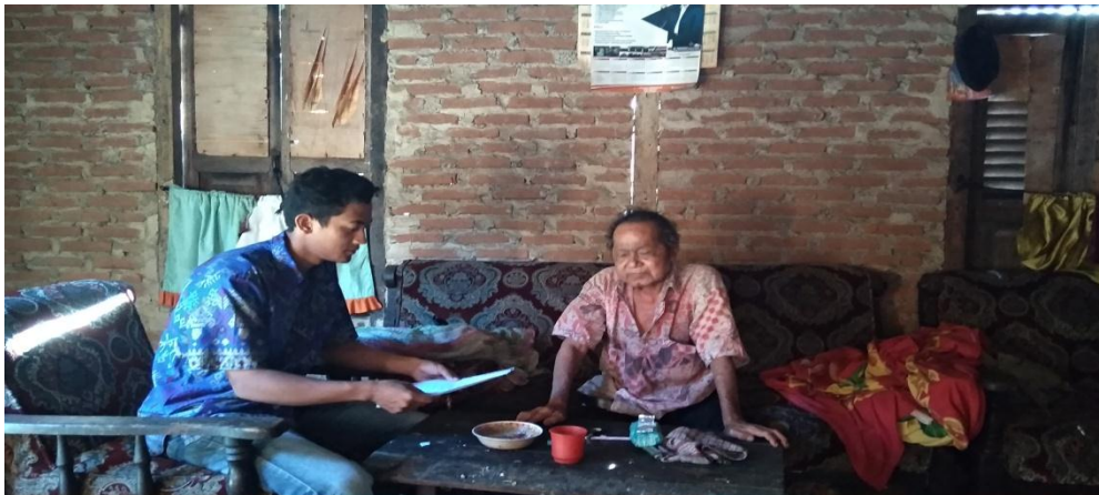
Wawancara dengan Tokoh Adat Desa P. Kahombu