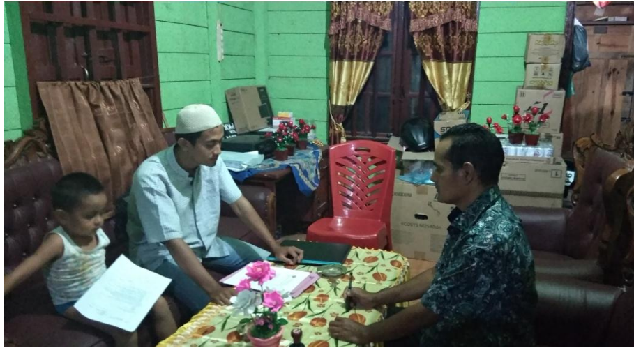
Wawancara dengan Kepala Desa P. Kahombu