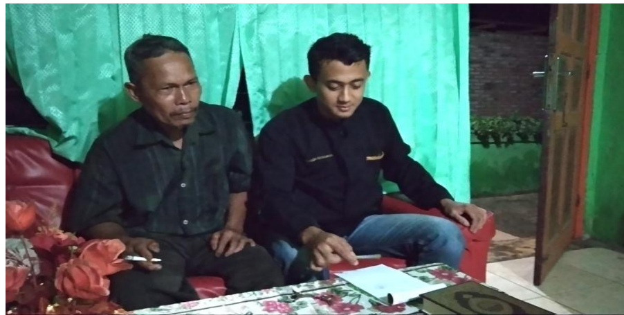
Wawancara dengan Masyarakat Desa P. Kahombu