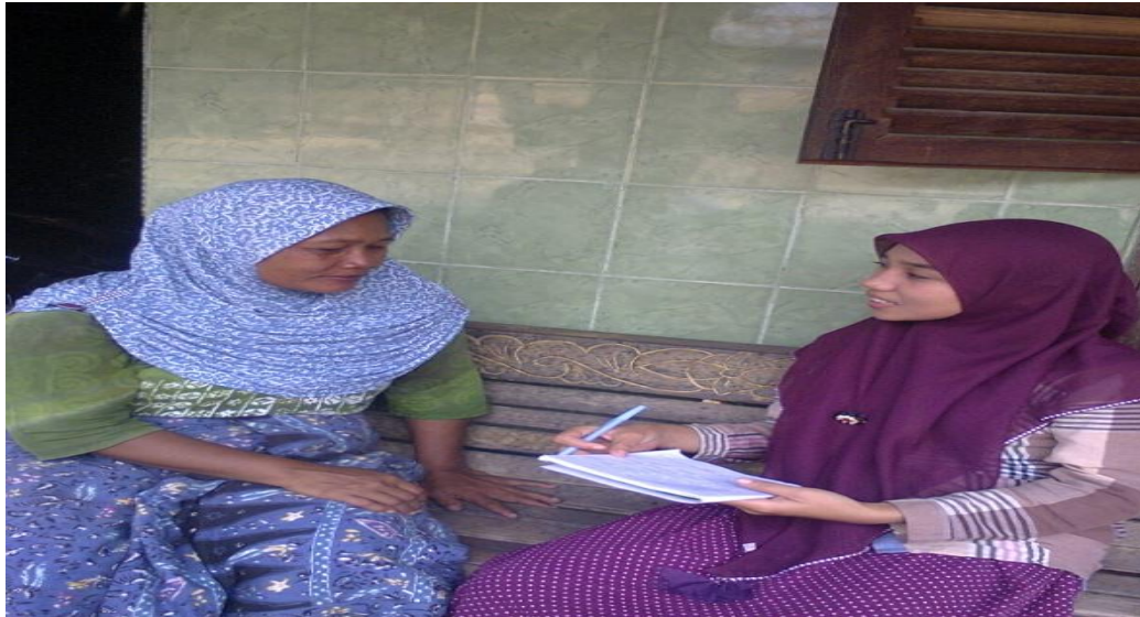
Photo ketika wawancara dengan orangtua yang memiliki anak usia remaja