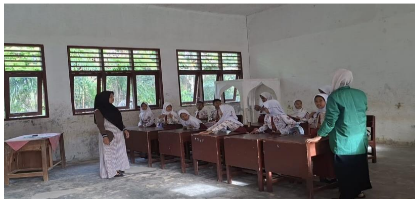
Proses Pembentukan Karakter Disiplin Peserta Didik melalui Pembiasaan Pemeriksaan Kelengkapan Atribut Sekolah dan Pemberian Arahkan oleh Wali Kelas