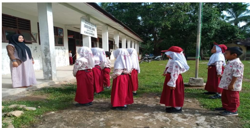
Hasil Pembiasaan yang Dilakukan untuk Membentuk Karakter Disiplin di Kelas III SDN 1602 Desa Gading Kecamatan Barumun Barat