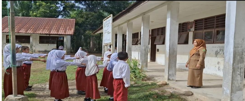
Gambaran Kedisiplinan Siswa Kelas III SDN 1602 Desa Gading Kecamatan Barumun Barat