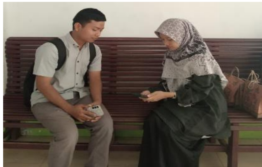
Dokumentasi penyebaran dan pengisian angket melalui google form oleh mahasiswa PAI