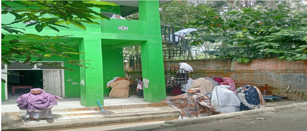
Kegiatan Santriwati Waktu Melaksanakan Wudhu