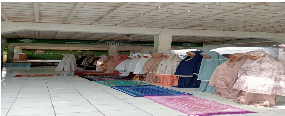
Kegiatan Santriwati Waktu Melaksanakan Shalat Ashar Berjama'ah di Aula Asrama Putri Pondok Pesantren Darul Istiqomah