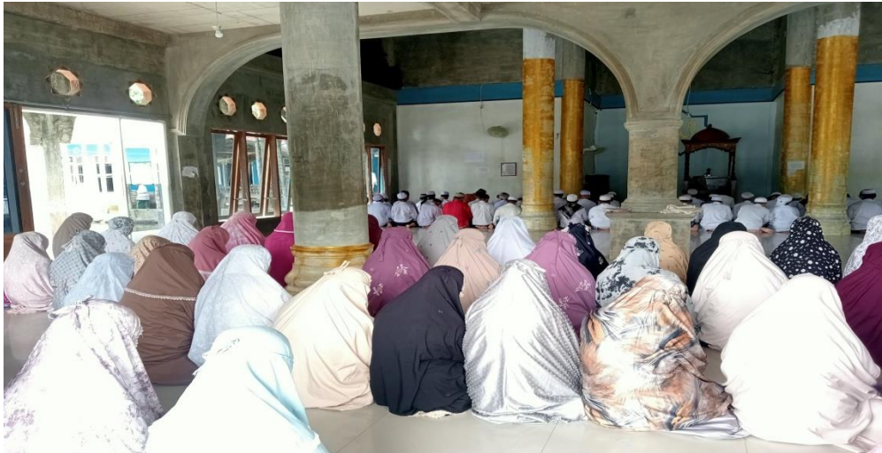
Kegiatan Santri-Santriwati waktu Melaksanakan Shalat Zhuhur Berjama'ah di Masjid Ponpes Darul Istiqomah