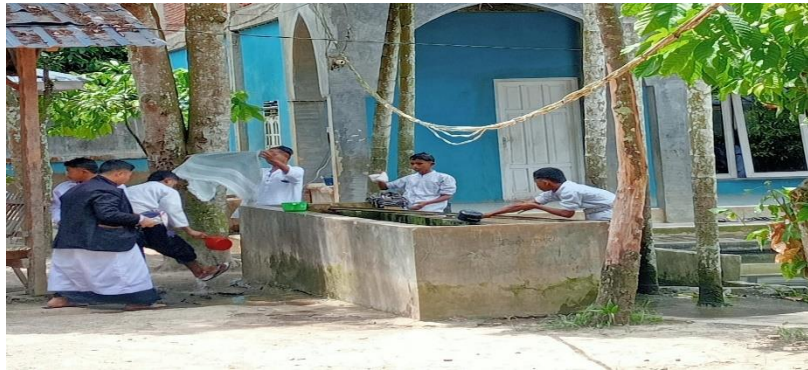
Gambar 4.1 Santri bersiap-siap untuk mengambil air wudhu dan bergegas melaksanakan salat qobliyah

keluar dari kelas, bersiap-siap untuk mengambil air wudhu dan bergegas melaksanakan salat qobliyah. 57