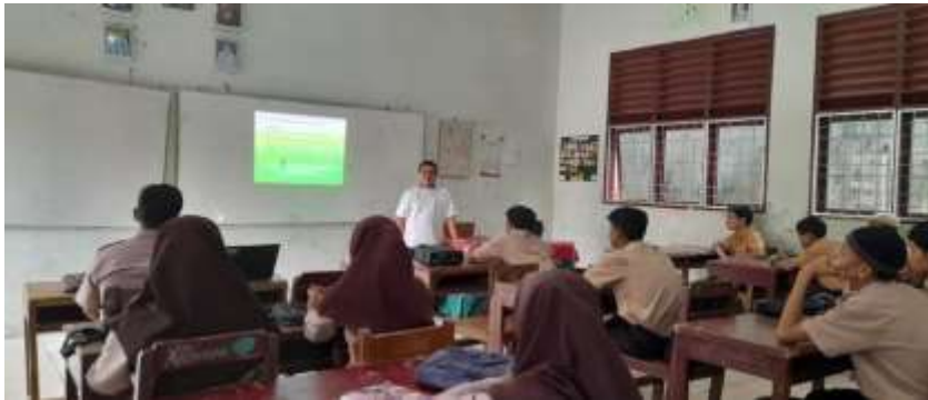
Gambar 1.3 Keadaan peserta didik di kelas dengan guru PAI saat menggunakan PowerPoint