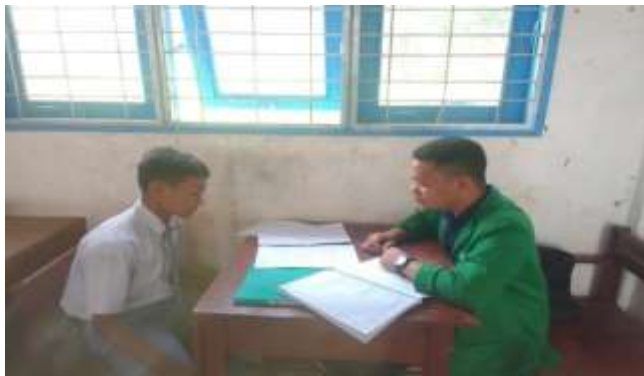
Sumber Data: Wawancara Peserta Didik SMA N I Agkola Selatanl 2025