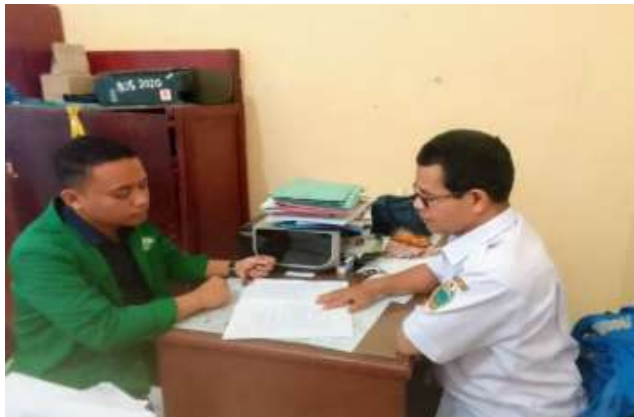
Sumber Data: Wawancara Guru PAI SMA N 1 Agkola Selatanl 2025

“Minat siswa dalam pembelajaran pendidikan agama islam saat menggunakan media PowerPoint alhamdulillah masih baik”. 9