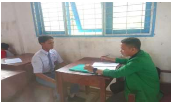
Sumber Data: Wawancara Peserta Didik SMA N 1 Agkola Selatanl 2025

Pada waktu berbeda peneliti memanggil salah seorang peserta didik kelas XI A untuk di wawancarai peserta didik tersebut mengatakan: