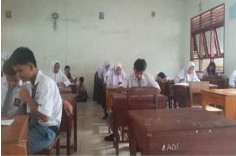
Gambar 1.2 Keadaan peserta didik saat di kelas