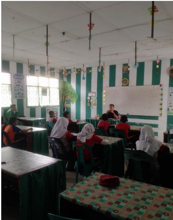
Lampiran: Guru PJOK sedang melaksanakan proses keterampilan membuka pembelajaran dikelas IV