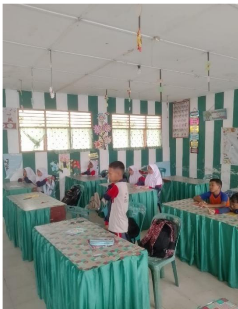
Lampiran: Proses kegiatan mengajar di kelas IV