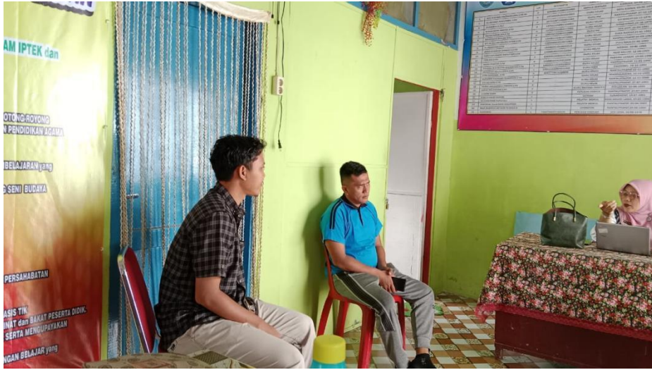
Lampiran: Berdiskusi dengan ibuk kepala sekolah dan guru PJOK di SDN 112147 Bakaran Batu