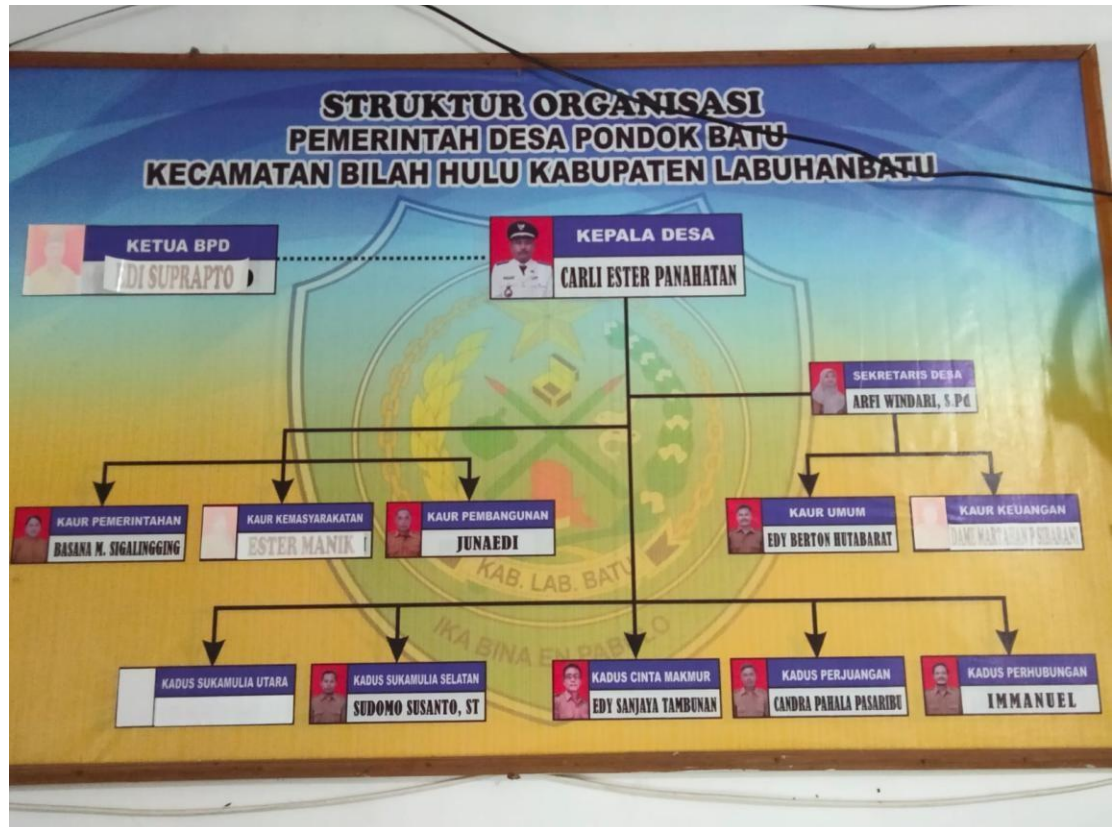
Gambar 4.1 Struktur Organisasi Desa Sukamulia Pondok Batu