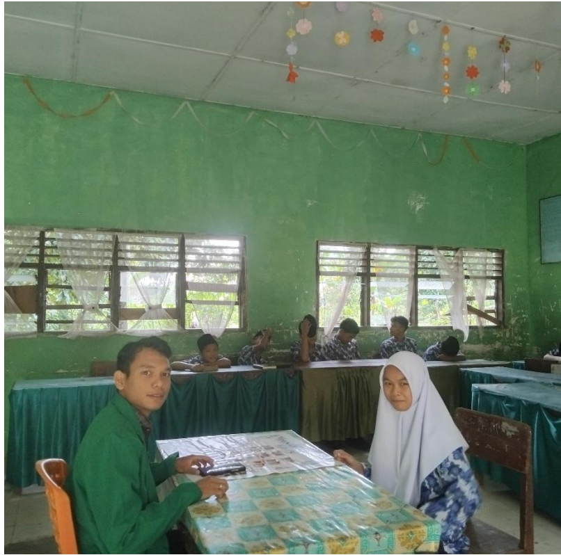
Penggunaan Media Audio Visual Pada Pembelajaran Fikih di Kelas