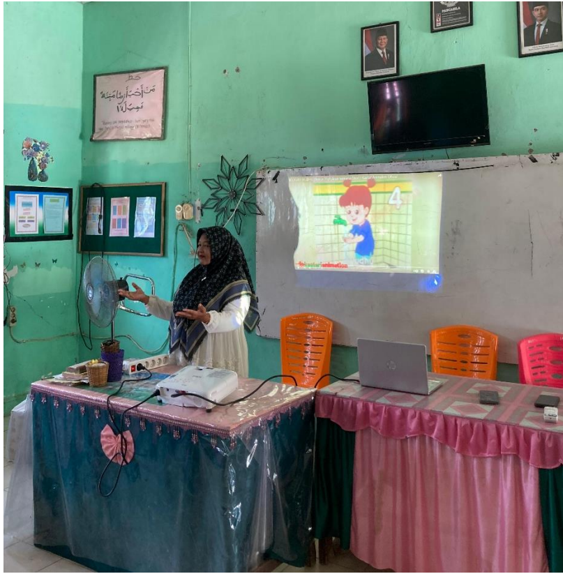
Pelaksanaan Wudhu di Madrasah Tsanawiyah Negeri 3 Tapanuli Selatan