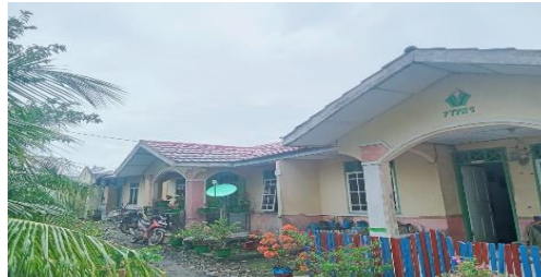
Gambar 1. Suasana Desa Perkebunan Ajamu Dusun XIV Kebun Meranti Paham Kabupaten Labuhanbatu.

merujuk pada penomoran afdeling (divisi) atau blok tertentu dalam struktur administrasi perkebunan yang berlokasi di area tersebut. 49