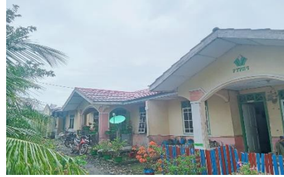
Gambar suasana perumahan desa perkebunan ajamu dusun XIV, Selasa, 25 november 2025.