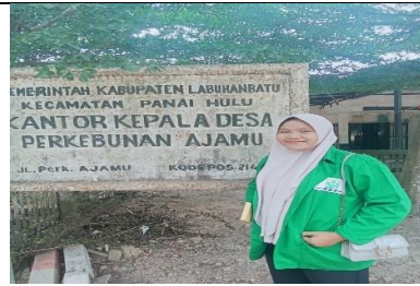
Kantor kepala desa perkebunan ajamu kabupaten labuhanbatu, Senin, 24 November 2025.