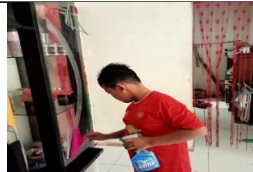
Foto salah satu anak desa perkebunan ajamu yang menunjukkan sedang menolong orang tua nya dirumah yang termasuk kedalam akhlak terpuji. Rabu, 10 Desember 2025.