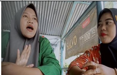
Dokumentasi saat wawancara bersama salah satu orang tua didesa perkebunan ajamu dusun XIV kebun meranti paham kabupaten labuhan batu, Minggu, 23 November 2025.