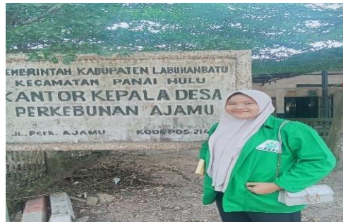
Gambar 2. Kantor Kepala Desa Perkebunan Ajamu Dusun XIV Kebun Meranti Paham Kabupaten Labuhanbatu.

perkebunan berperan penting dalam pengairan sekaligus pencegahan genangan saat musim hujan. Kombinasi antara kondisi geografis yang stabil, dukungan infrastruktur dasar, serta keberadaan industri kelapa sawit menjadikan desa ini berkembang sebagai kawasan agraris yang produktif dan memiliki aktivitas ekonomi yang dinamis.