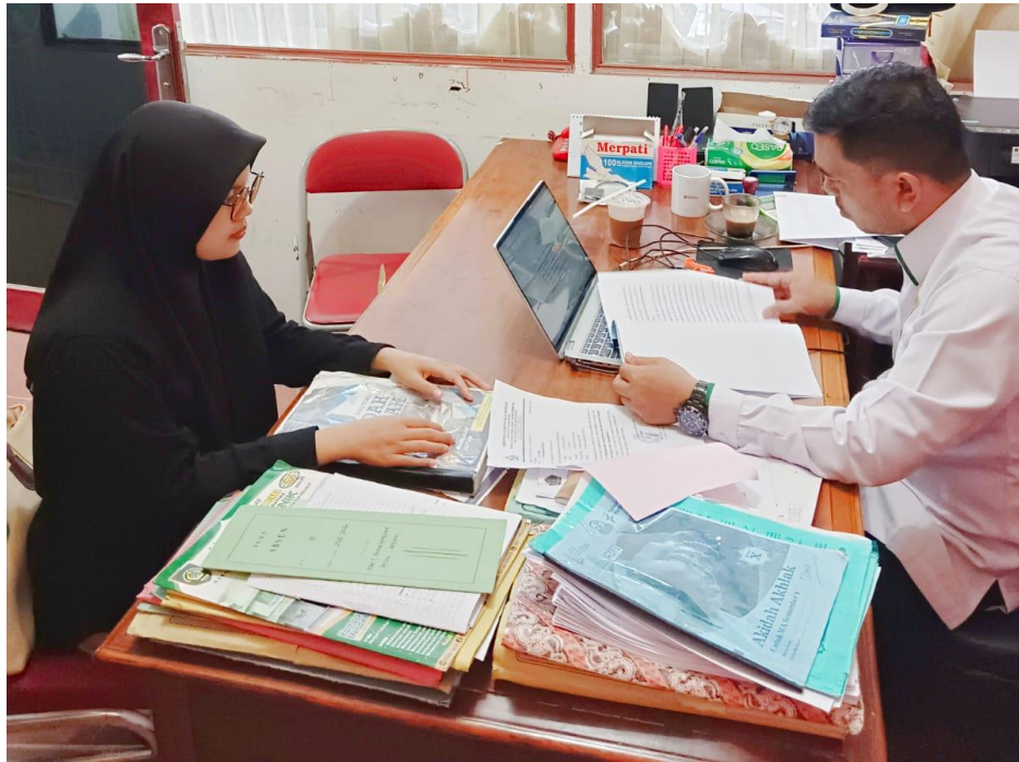
Wawancara bersama Guru PAI kelas X MAN 1 Padangsidimpuan