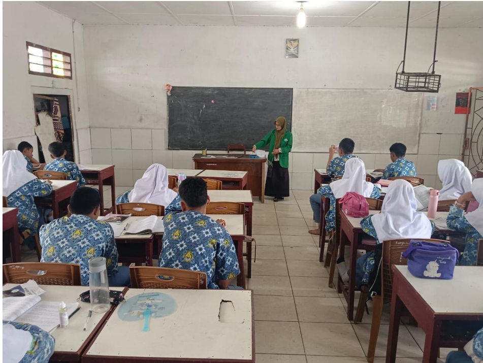
Menyampaikan materi pelajaran Akidah Akhlak