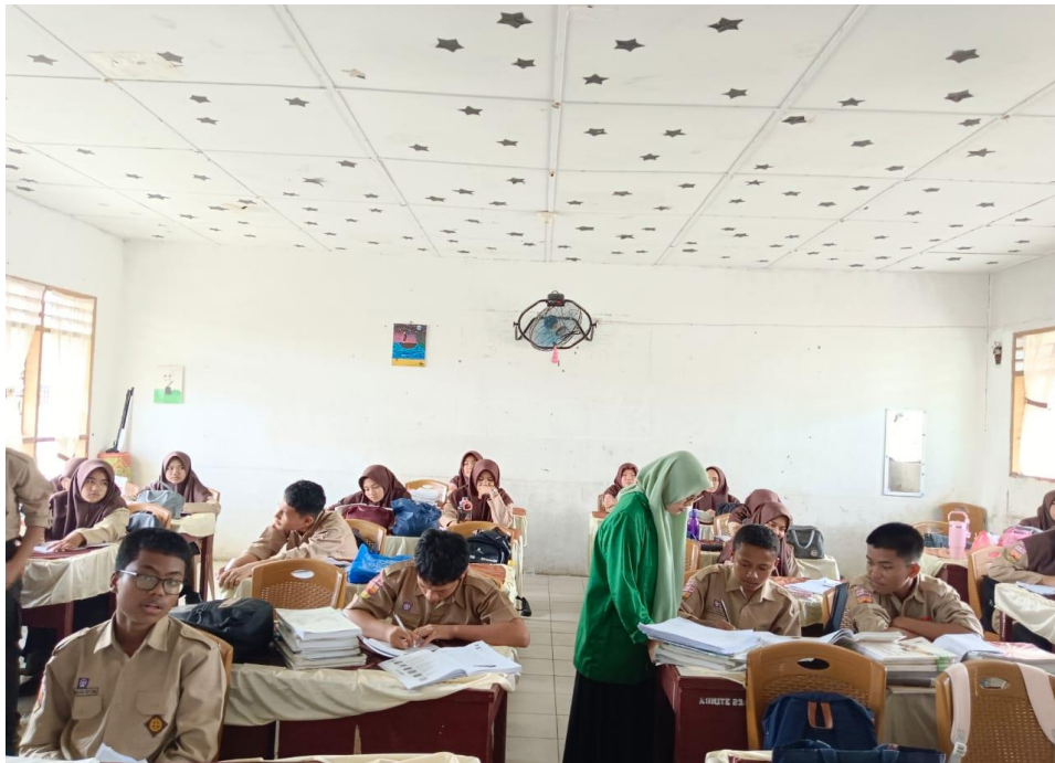
Kegiatan bimbingan belajar kepada siswa