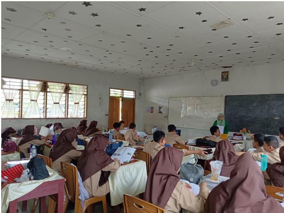
Menyampaikan materi pembelajaran Akidah Akhlak di kelas X MAN 1 Padangsidimpuan