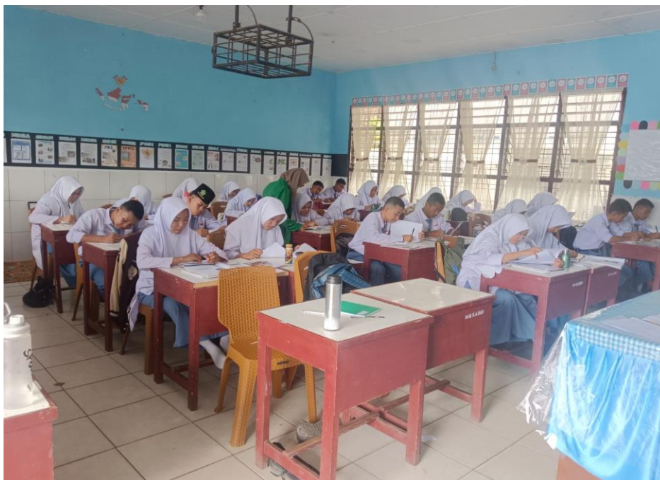
Memberikan bimbingan pengisian angket kepada siswa