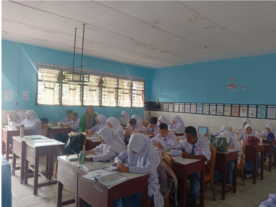
Kegiatan memberikan bimbingan belajar kepada siswa