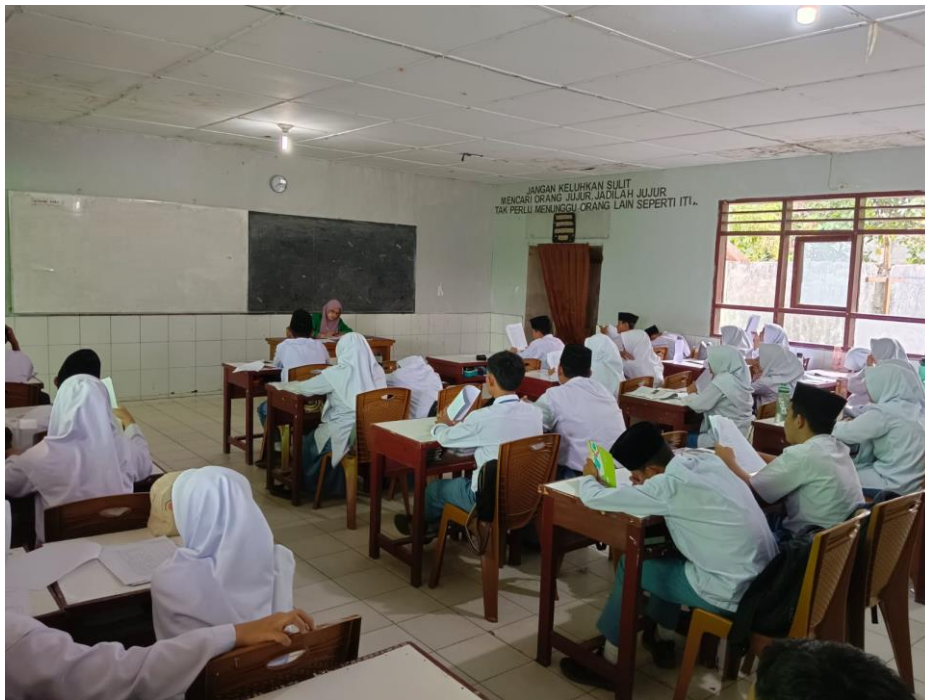
Siswa mengerjakan angket