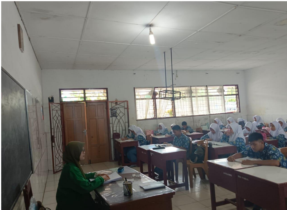
Kondisi kelas selama penelitian