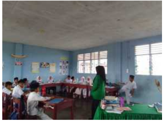
Dokumentasi Perkenalan Sekaligus Memberi Motivasi dengan siswa di MI Terpadu Mutiara Sadabuan Kota Padangsidimpuan