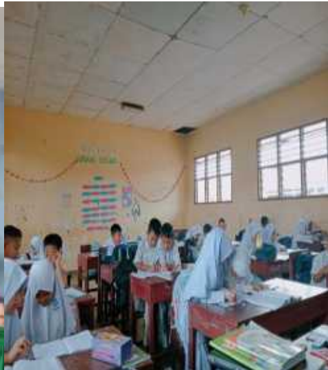
Observasi pada saat pembelajaran Akidah Akhlak