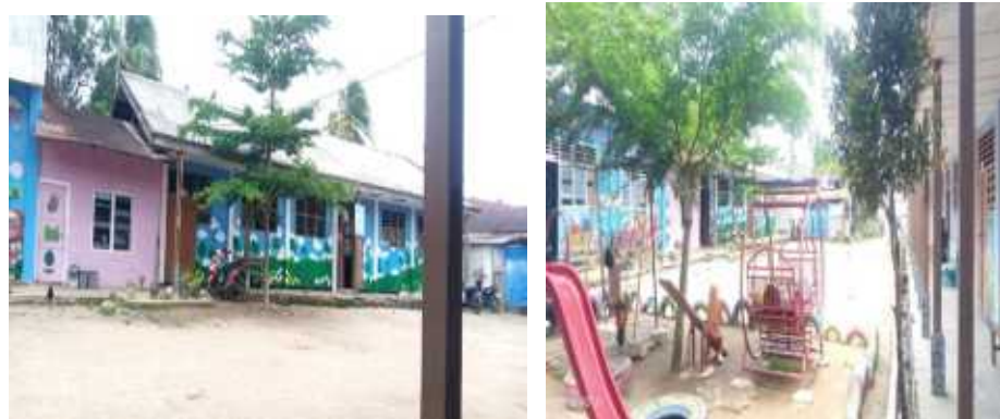
Gambar 4.1. Kondisi Sekolah dan Ruangan Kantor MI Terpadu Mutiara Sadabuan Padangsidempuan

Demikian profil umum yang dapat di gambarkan peneliti berkaitan tentang MI Terpadu Mutiara Sadabuan Padangsidempuan. Kondisi Sekolah dan Lapangan Sekolah bisa dilihat pada gambar berikut: