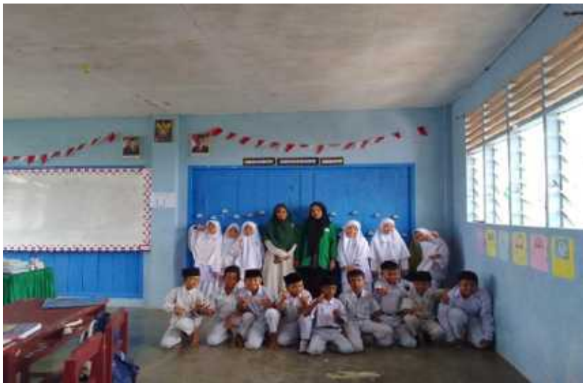
Dokumentasi Foto Bersama Guru dan Siswa di MI Terpadu Mutiara Sadabuan Padangsidimpuan.