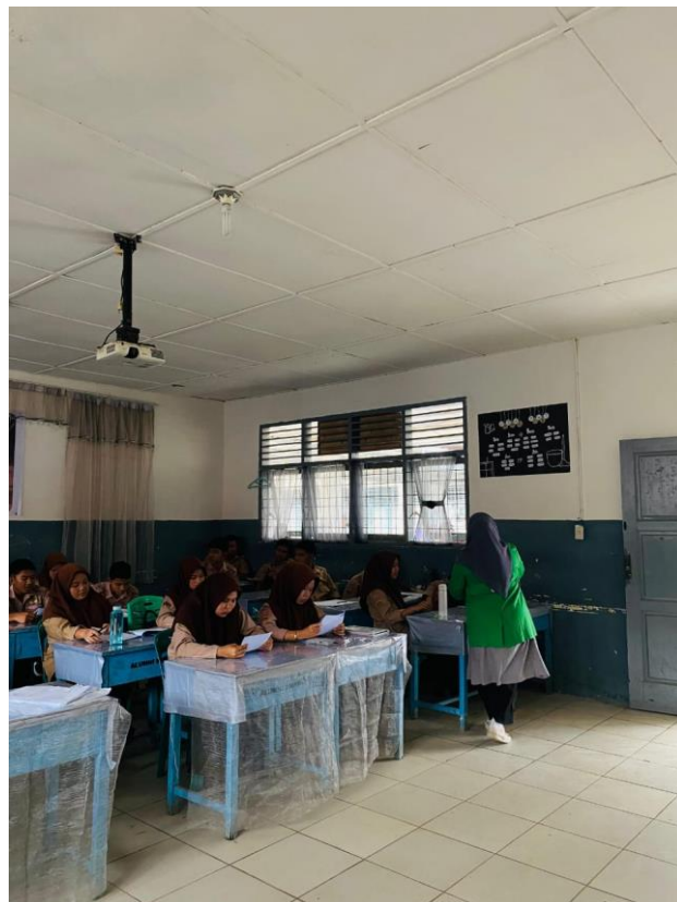
Pembagian kuesioner yang dilakukan oleh penulis kepada siswa dan siswi kelas X SMA N 4 Kota Padangsidimpuan