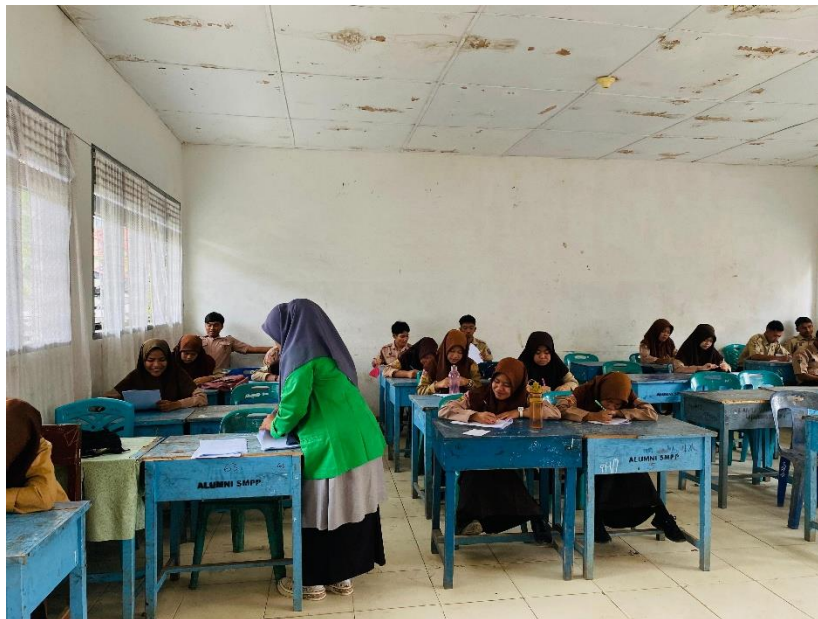
Pembagian kuesioner yang dilakukan oleh penulis kepada siswa dan siswi kelas XII SMA N 4 Kota Padangsidimpuan