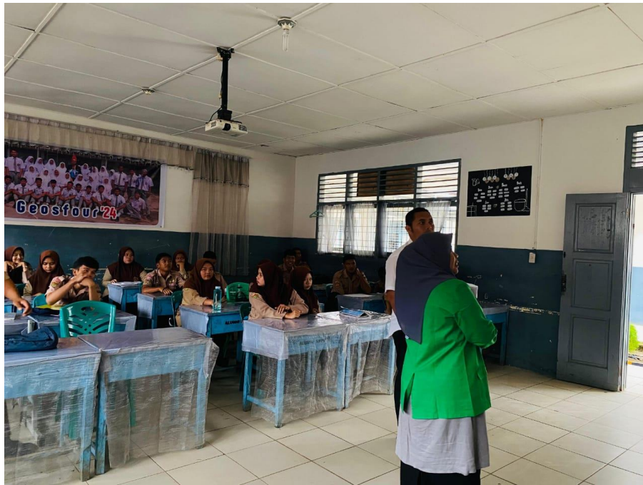
Penulis memberikan penjelasan mengenai keusioner yang akan dibagikan kepada siswa dan siswi SMA N 4 Kota Padangsidimpuan