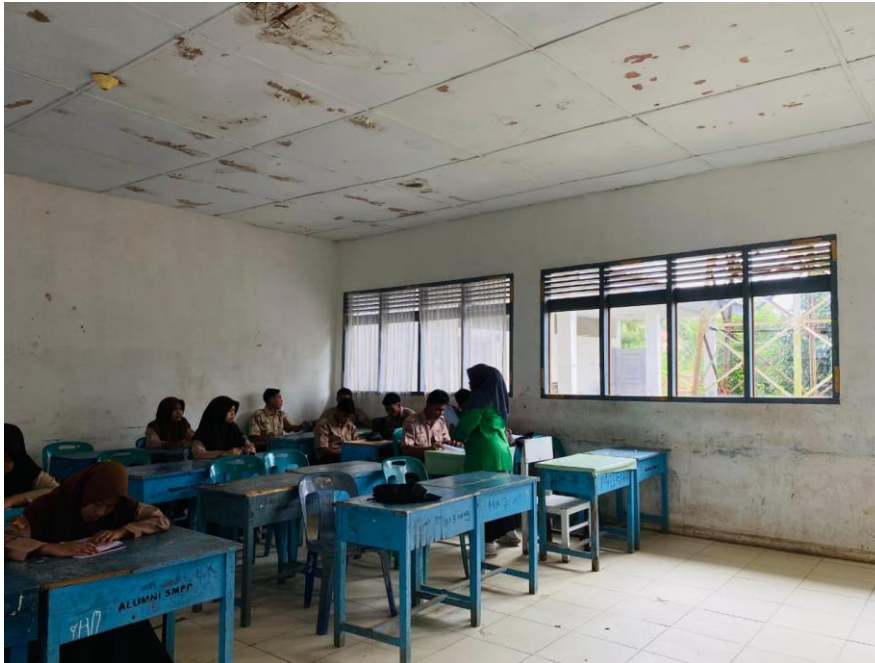
Pembagian kuesioner yang dilakukan oleh penulis kepada siswa dan siswi kelas XI SMA N 4 Kota Padangsidimpuan