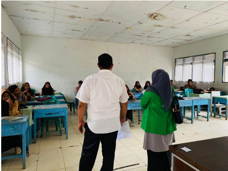
Foto bersama dengan guru Agama Islam diruangan sekaligus memberikan ucapan terima kasih kepada siswa dan siswi SMA N 4 Kota Padangsidimpuan