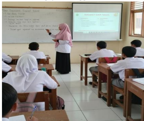
Gambar 4.2 Guru mengajar menggunakan infokus

Berdasarkan dokumentasi hasil observasi di SMA Negeri 1 Saipar Dolok Hole tanggal 20 Juli 2024, tercatat bahwa guru Pendidikan Agama Islam telah menyiapkan pembelajaran yang mengintegrasikan media audio visual untuk materi taharah serta salat dan khutbah Jumat. Dokumentasi lapangan menunjukkan bahwa guru telah memilih dan menguji video sebelum digunakan, mengatur durasi tayangan, serta mengkondisikan kelas sebelum penyajian media. Penerapannya juga dipadukan dengan metode pembelajaran aktif seperti Card Sort dan Word Square, sehingga