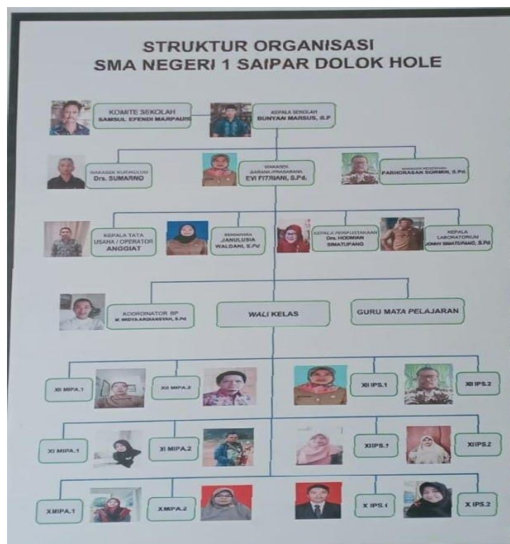
Gambar 4.1 Sruktur Organesai Sekolah SMA Negeri 1 Saipar Dolok Hole Kabupaten Tapanuli Selatan