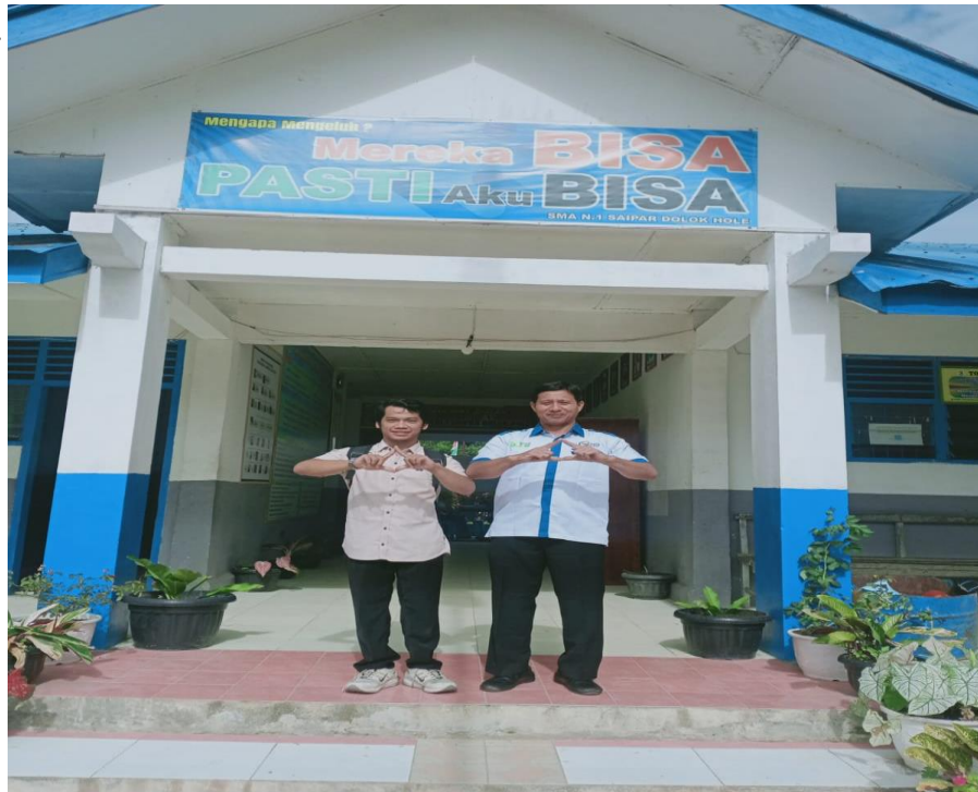
Gambar 1.3 Bersama Kepala Sekolah SMA Negeri 1 Saipar Dolok Hole