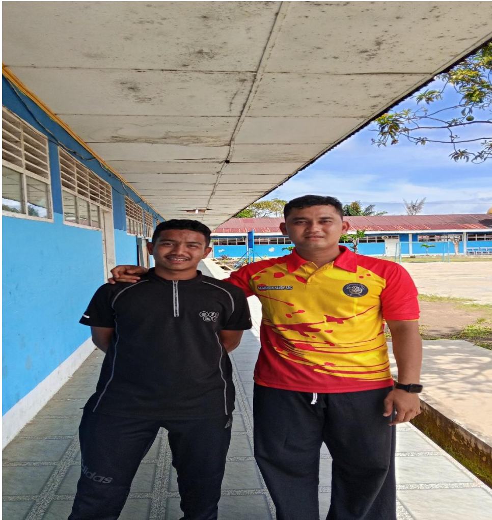
Dokumentasi dengan salah satu santri senior di halaman depan kelas pesantren pada tanggal 19 Agustus 2025