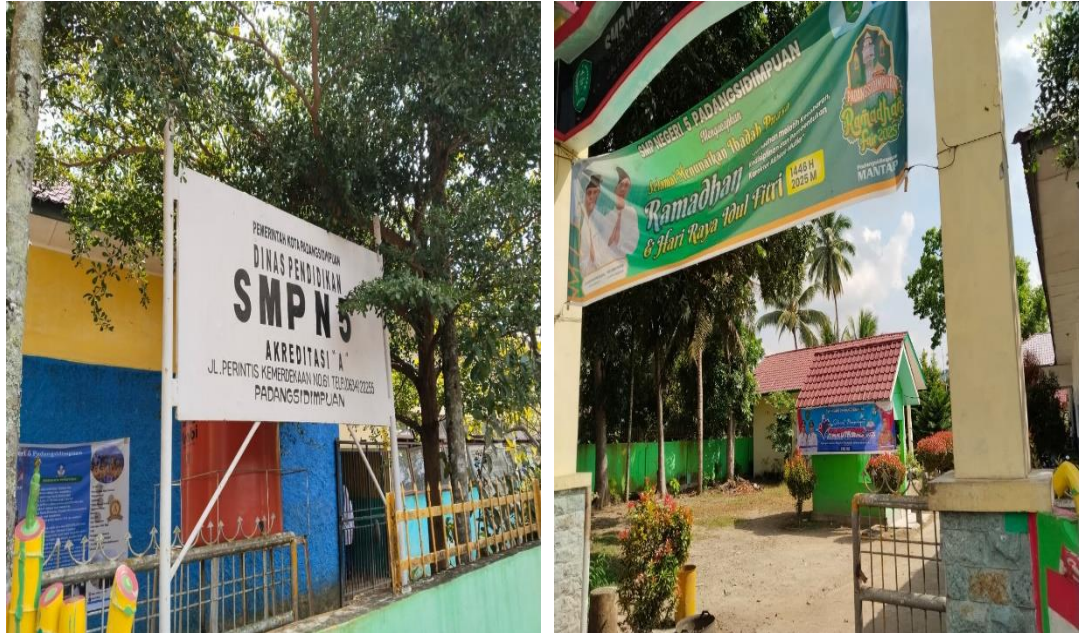
Profil SMP Negeri 5 Padangsidempuan