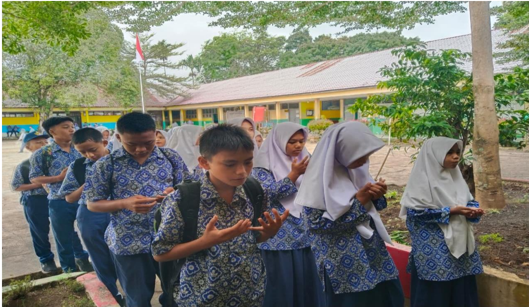
Gambar menunjukkan bahwa Siswa-siswa datang tepat waktu yaitu berbaris di depan kelas masing-masing sebelum masuk ke ruangan kelas