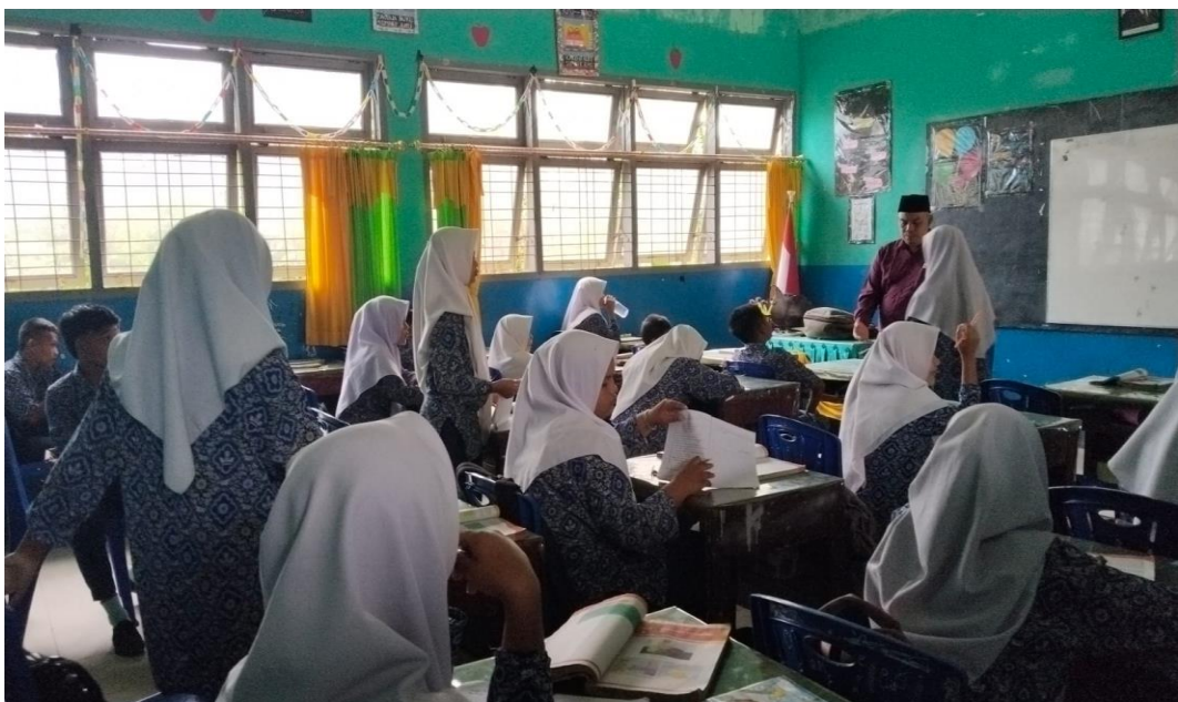
Gambar menunjukkan bahwa Siswa-siswa mengumpulkan tugas ketika guru menyuruh mengumpulkan tugas ke depan