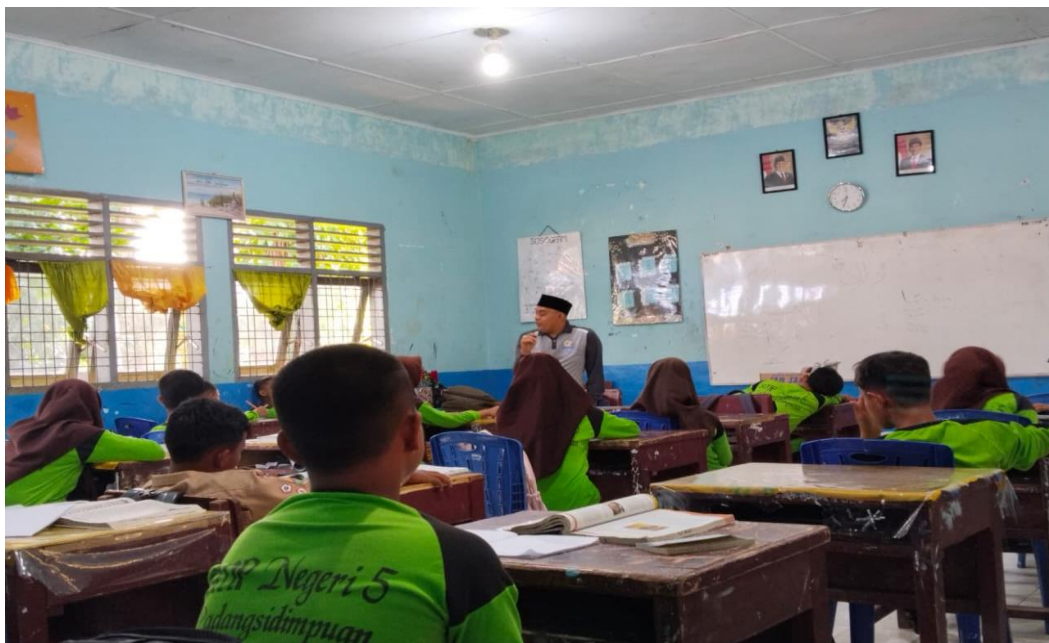
Gambar menunjukkan bahwa Guru mengawali pembelajaran dengan doa dan memberi motivasi tentang pentingnya kejujuran.