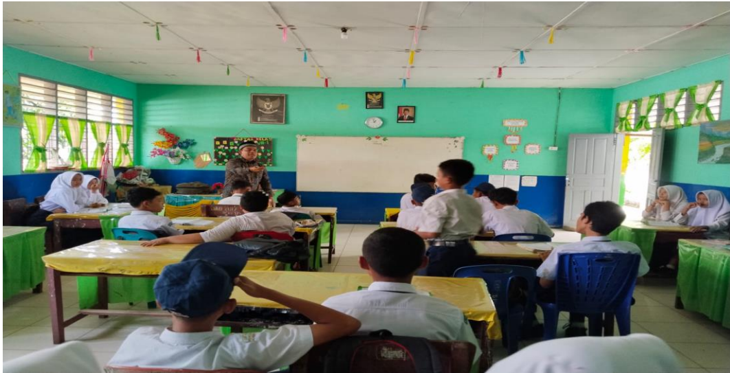
Gambar Guru menekankan pentingnya kerja sama dan tidak menyontek.