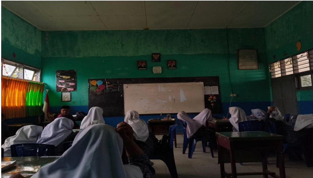
Gambar Guru menunjukkan teladan tanggung jawab dan disiplin dengan datang lebih awal dan menyiapkan media pembelajaran.