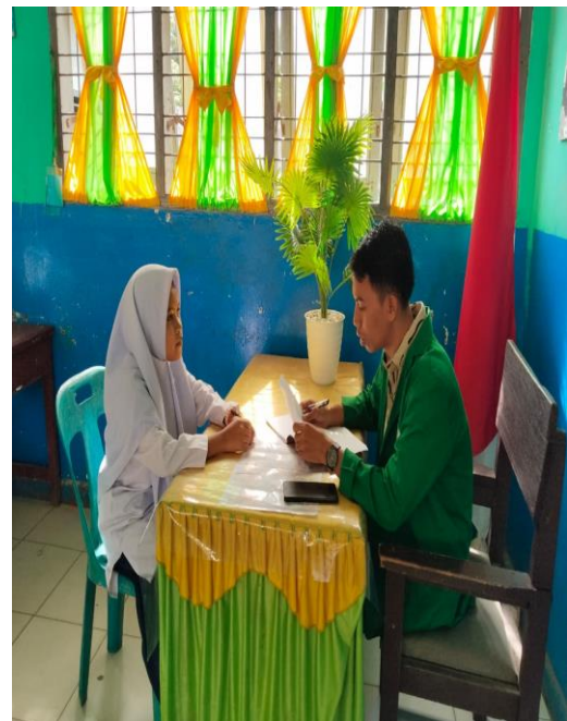
Wawancara dengan siswa-siswi kelas VIII SMP Negeri 5 Padangsidimpuan