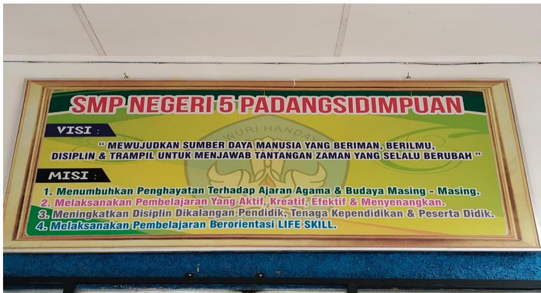
Visi dan Misi SMP Negeri 5 Padangsidempuan