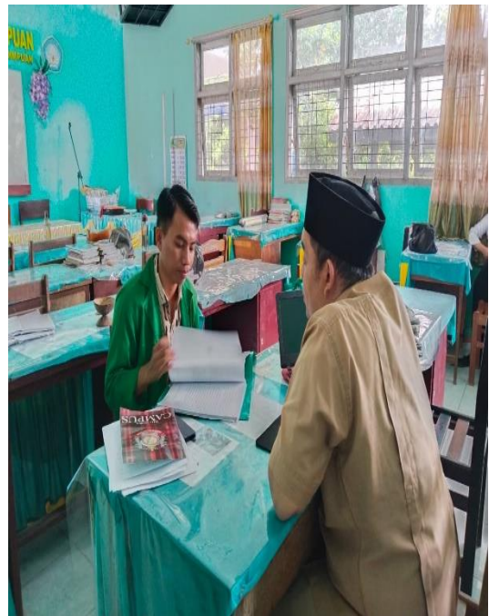
Wawancara dengan Guru Pendidikan Agama Kelas VIII SMP Negeri 5 Padangsidimpuan