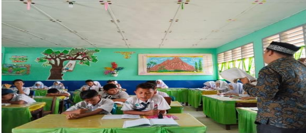
Gambar 1.1 Observasi di kelas VIII SMP Negeri 5 Padangsidimpuan

agama Islam menjadi hal yang sangat penting dan relevan untuk dikaji lebih lanjut. 8