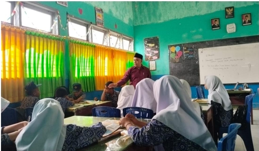
Gambar menunjukkan bahwa Guru berinteraksi dengan siswa selama pembelajaran PAI dan Guru menggunakan metode diskusi untuk menanamkan nilai kerja sama dan saling menghormati.