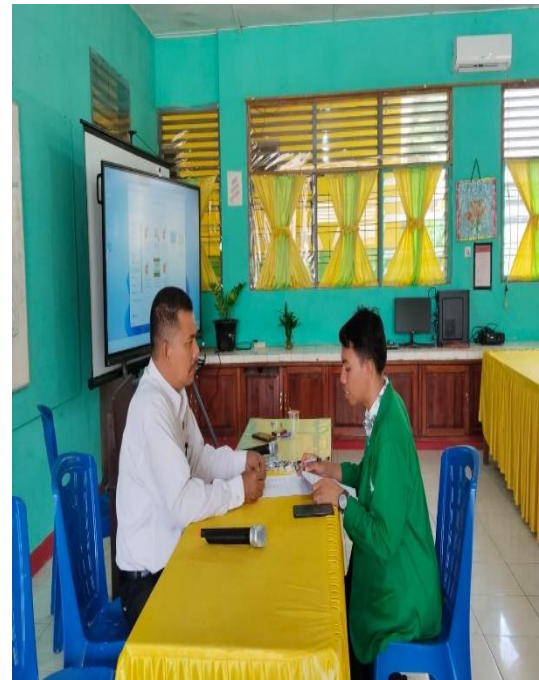
Wawancara dengan kepala sekolah SMP Negeri 5 Padangsidimpuan