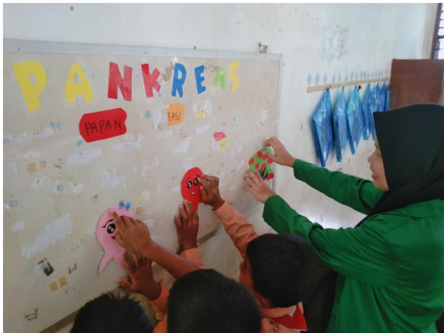
Gambar 10 Aktivitas siswa dalam mengisi mading