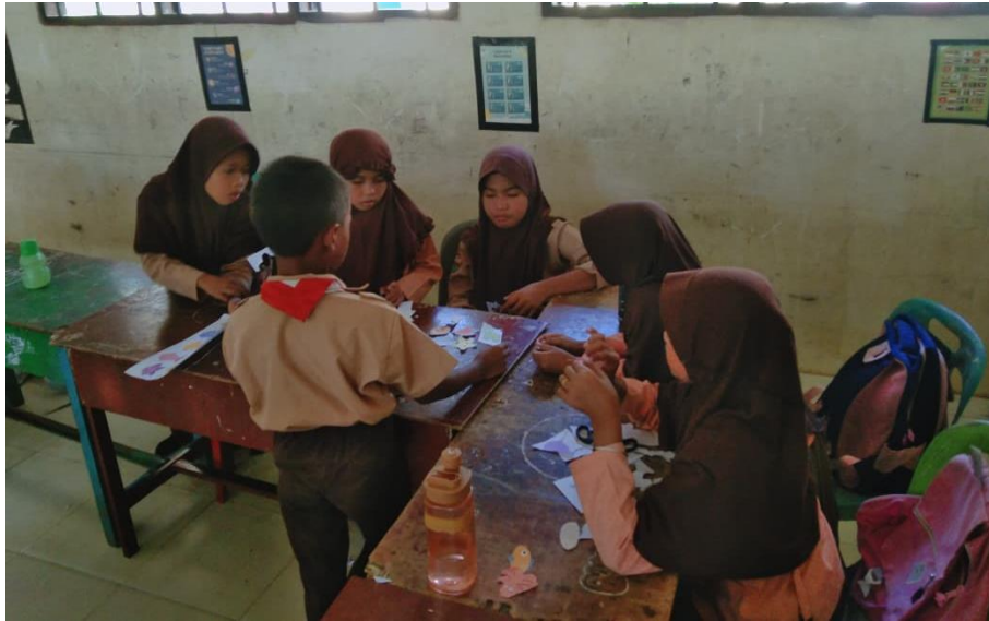
Gambar 9 Aktivitas siswa membuat mading