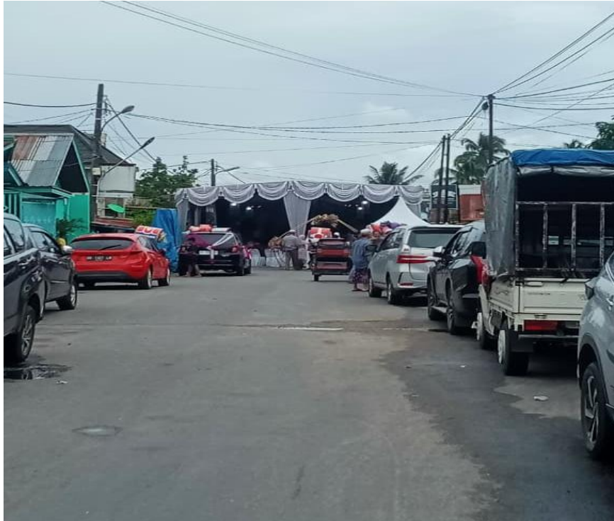
Penutupan Jalan Dalam Rangka Pesta Pernikahan Di Jalan Kapten Pierre Tandean