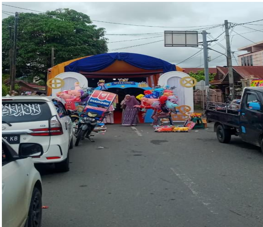
Penutupan Jalan Dalam Rangka Pesta Pernikahan Di Jalan Mt. Hariyono