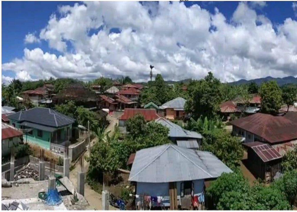
Gambar 4.1 Profil Desa Hutatinggi

Sumber Data: Desa Hutatinggi Kecamatan Puncak Sorik Marapi Kabupaten Mandailing Natal Tahun 2025 2