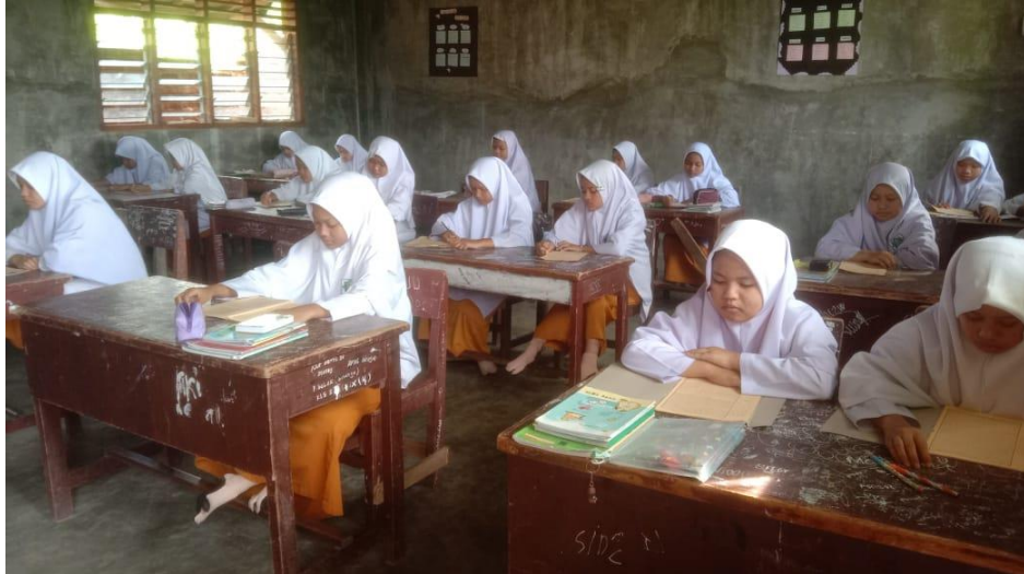
Gambar 2 Keadaan santriyah belajar yaitu mendengarkan dan menyimak dengan seksama dalam membaca kitab kuning

Dokumentasi observasi keadaan yang sedang mudzakah (yaitu satu yang membaca dan lainnya menyimak) di kelas V/II Aliyah Pondok Pesantren Al-yusufiyah Wal-ridwaniyah. Pada tanggal 23 April 2025. 15