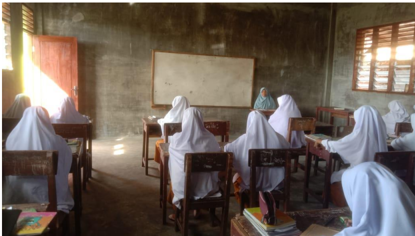
Suasana belajar dan mengajar di dalam kelas di Pondok Pesantren Al-yusufiyah Wal-Ridwaniyah.

Dokumentasi Observasi keadaan suasana belajar mengajar di dalam kelas v aliyah di Pondok Pesantren Al-yusufiyah Wal-ridwaniyah pada tanggal 23 April 2025.