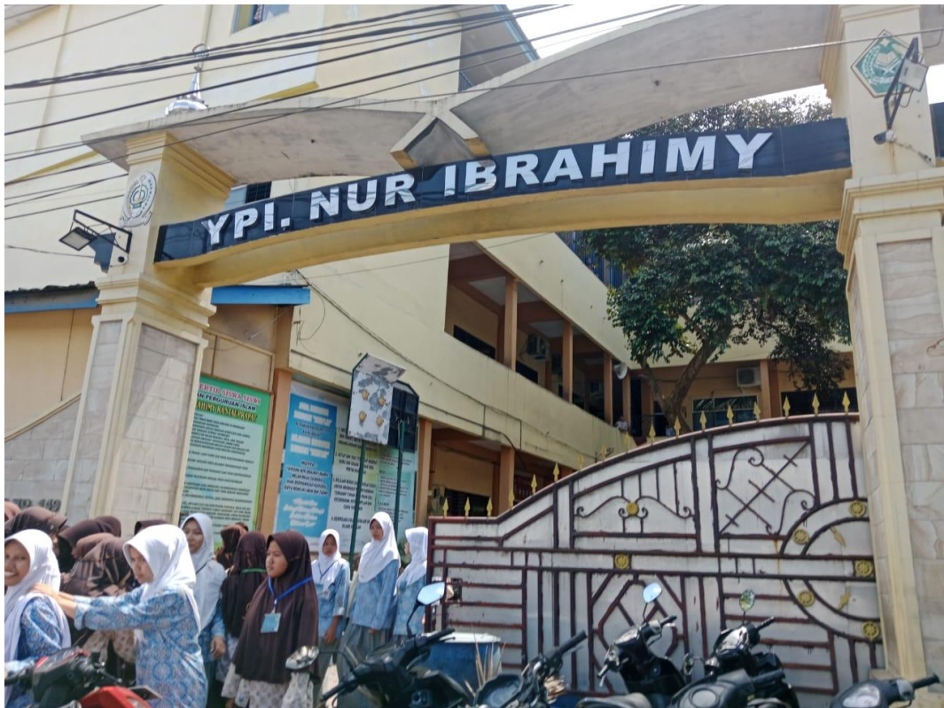
Gambaran Halaman Yayasan Perguruan Islam Nur Ibrahimy Rantau Prapat