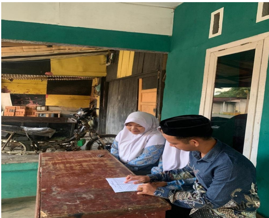
Wawancara bersama Siswi Madrasah Aliyah Nur Ibrahimy Rantau Prapat