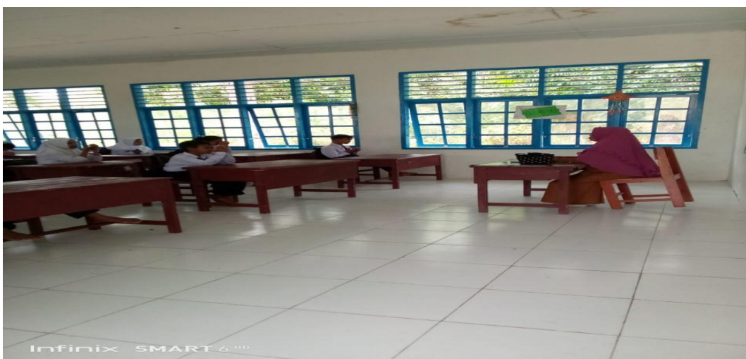
Guru Membuka Pelajaran Dengan Salam