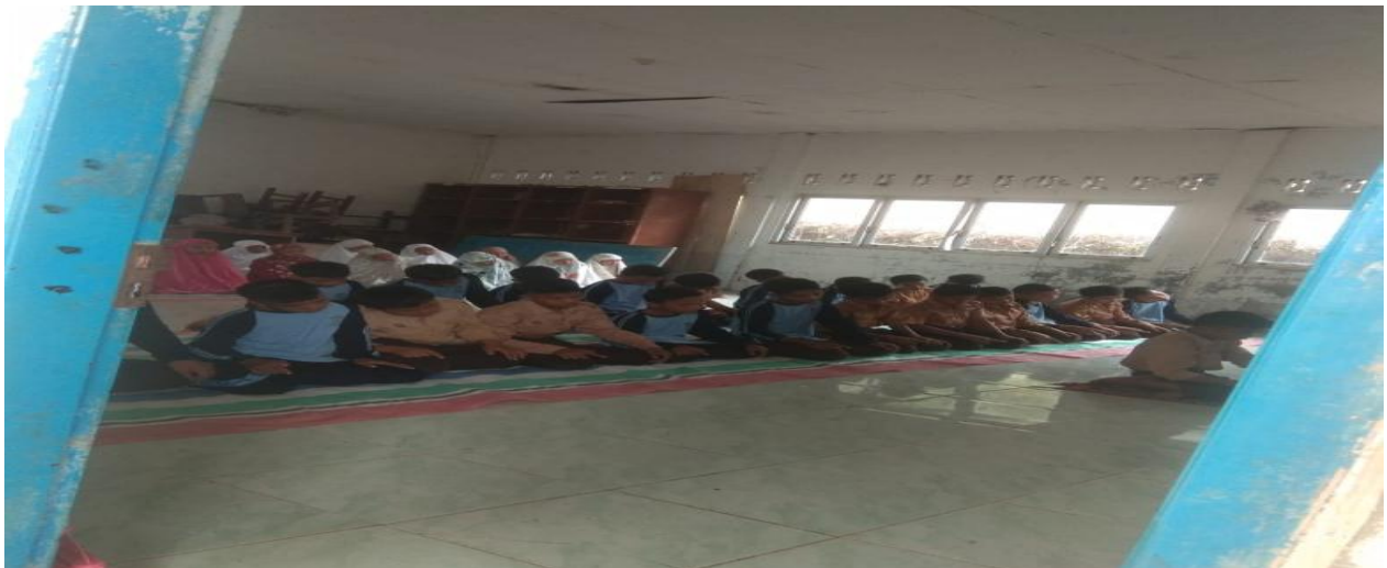
Siswa dan siswi yang sedang melakukan sholat duha di SMP Negeri 2 Aek Bilah