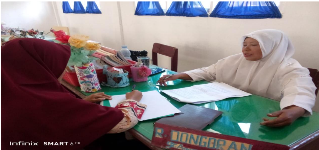
Wawancara Dengan Guru Pendidikan Agama Islam di SMP Negeri 2 Aek Bilah