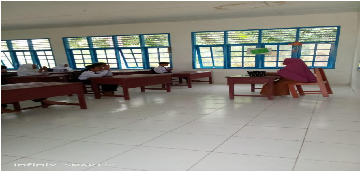
Guru Memulai Pelajaran Dengan Berdo'a