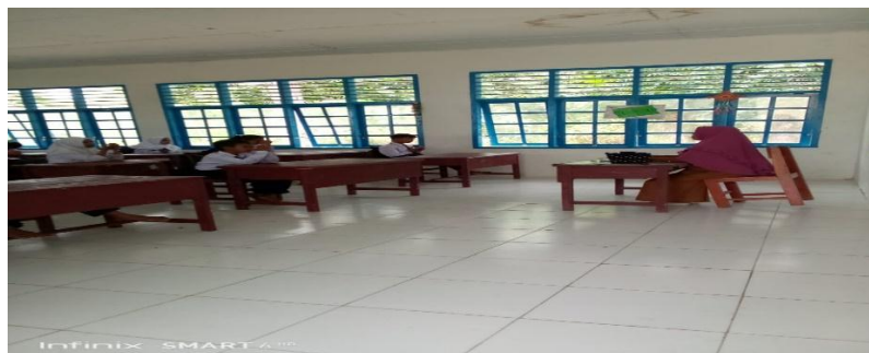
Gambar 3.2 Guru PAI Mengajak siswa-siswi berdzikir di tengah pembelajaran

Cenderung pada kebaikan terlihat jelas dari kebiasaan siswa membantu temannya, baik dalam kegiatan belajar maupun saat kerja bakti. Beberapa siswa tampak rela meminjamkan buku kepada temannya yang lupa membawa, serta bergotong royong membersihkan kelas dan lingkungan sekolah. Perilaku tersebut menegaskan bahwa kecenderungan pada kebaikan sudah menjadi bagian dari kehidupan sekolah mereka. empati yang kuat, yang tampak dalam kegiatan infaq Jumat di mana siswa dengan sukarela memberikan sebagian uang jajannya. Empati juga terlihat ketika ada siswa yang tidak hadir karena sakit, teman-temannya menunjukkan kepedulian dengan menjenguk bersama guru. Hal ini menggambarkan bahwa siswa memiliki rasa peduli dan kebersamaan yang tinggi terhadap kondisi teman sekelas. berjiwa besar dan memiliki visi terlihat ketika guru memberikan kesempatan kepada siswa untuk menyampaikan cita-cita mereka. Siswa dengan percaya diri menyebutkan mimpi menjadi dokter, guru, atau profesi lainnya. Guru selalu memberikan motivasi agar mereka tidak mudah putus