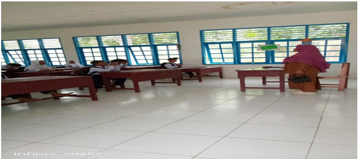
Guru Mengajak Siswa Untuk Berdzikir Di Tengah Tengah Pembelajaran