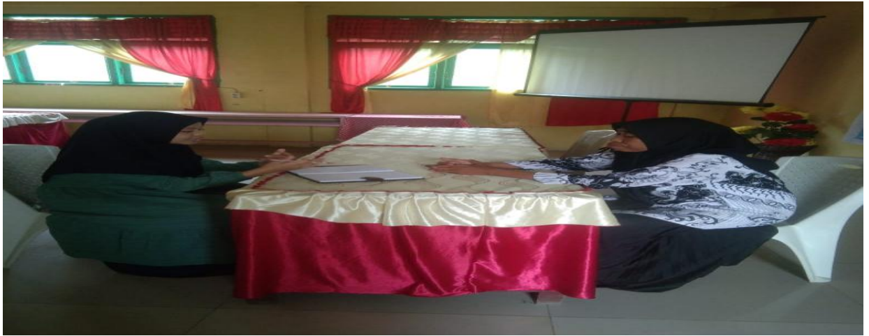
Wawancara dengan guru mata pelajaran matematika di SMP Negeri 2 Aek Bilah