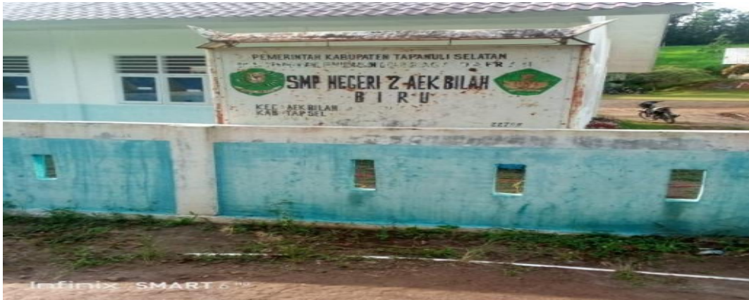
SMP Negeri 2 Aek Bilah