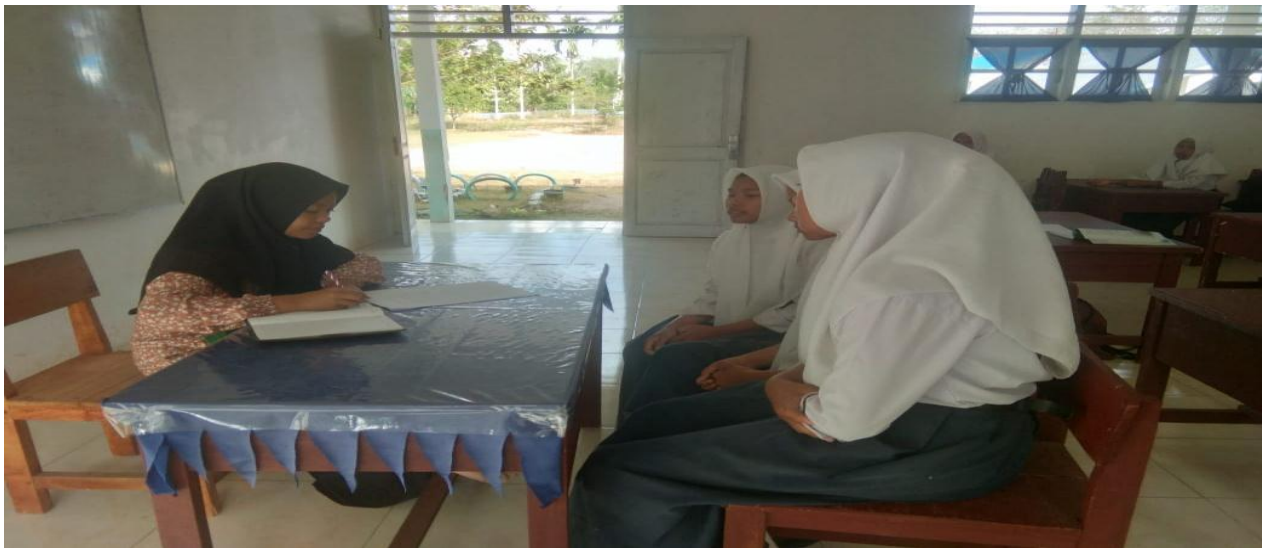
Wawancara Dengan Siswa Dan Siswi di SMP Negeri 2 Aek Bilah