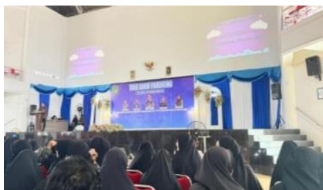
Gambar 4.5 Seminar Parenting

keagamaan disekolah. kegiatan di sekolah sudah begitu baik melaksanakan pembentukan akhlak tinggal bagaimana orang tua di rumah mengajarkan hal yang positif dan selalu mencontohkan perilaku terpuji sebagaimana yang telah di ajarkan disekolah, guru dan orang tua lebih tegas lagi untuk mengarahkan siswa baik disekolah maupun dirumah agar siswa tidak terjerumuh ke hal negatif saat luar lingkungann sekolah”. 81