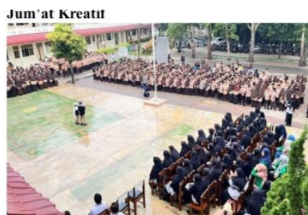
Gambar 4.4 Jum'at Kreatif

“Akhlaq siswa di SDIT Nurul ‘ilmi Padangsidempuan bisa dibilang sudah cukup baik, tergantung bagaimana guru dan orang tua mengajari atau berperilaku yang baik kepada siswa. Kerjasama guru dan orang tua harus dijalankan dengan baik dan dibuatlah pertemuan antara guru dan orang tua, grup Whatsapp, dan adanya buku penghubung yang diberi kepada setiap siswa untuk di isi dirumah agar anak murid rajin melakukan sholat, puasa, menghafal dan lainnya, selain itu untuk membangun akhlak siswa dengan disekolah melakukan kegiatan tunjuk bakat, seperti jumat kreatif, disin siswa di persilahkan untuk membuat sesuatu, dan ditampilkan. meningkatkan rasa kepedulian sosial dan menolong, membudayakan suasana keislaman,dan di sekolah ini juga banyak sekali diajarkan tata cara berperilaku yang baik kepada sesama siswa, dan menghormati orang yang lebih tua. Selain itu ada juga malam bina iman dan taqwa(mabit) untuk membentuk akhlak siswa”. 79