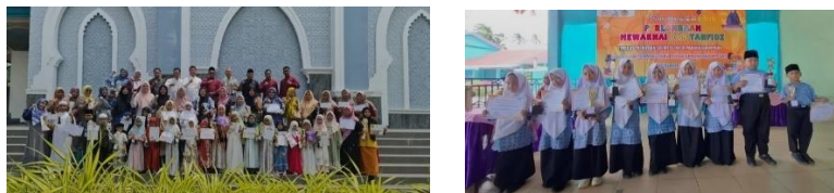
Gambar 4.1 Potret Siswa dan Siswa Berpestasi SDIT Nurul ‘ilmi Padangsidimpuan

Bentuk kerjasama tersebut dilaksanakan tuntut mencapai visi, dan misi serta menghasilkan lulusan sekolah yang berkualitas. Beberapa kerjasama guru dan orang tua dibentuk serta dilaksanakan.