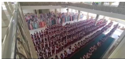
Gambar 4.6 Sholat Zuhur Berjamaah

Pentingnya kerjasama yang dijalin guru dan juga orang tua mengenai Pelaksanaan ibadah ketika disekolah sudah dibiasakan untuk melaksanakan sholat berjamaah, maka ketika anak dirumah sudah seharusnya anak diajak untuk sholat berjamaah, pendidikan itu diajarkan disekolah dan juga diterapkan dirumah, karena jika satu pihak saja yang melaksanakan maka tidak ada kebiasaan rajin ibadah bagi siswa.