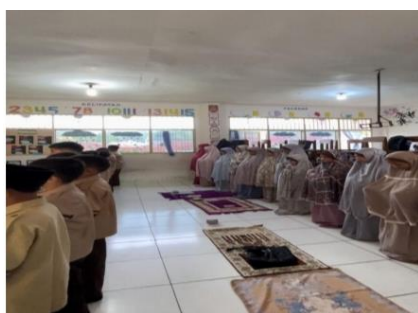
Gambar 4.3 Sholat Dhuha Berjama’ah di Kelas

Dan beliau mengatakan bahwa ada banyak sarana dan prasarana untuk mendukung proses pembelajaran atau perilaku seperti buku-buku Islami, dan juga adanya perpustakaan, tersedianya ruang BK, untuk konsultasi tentang akhlak siswa dan juga bapak menjelaskan partisipasi orang tua siswa di nurul ‘ilmi itu sangatlah tinggi, 98% sudah sangat bagus, dan juga komunikasi guru dan orang tua sangat baik.