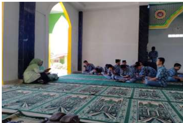
Dokumentasi membina karakter siswa