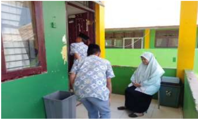
Dokumentasi sopan santun terhadap guru