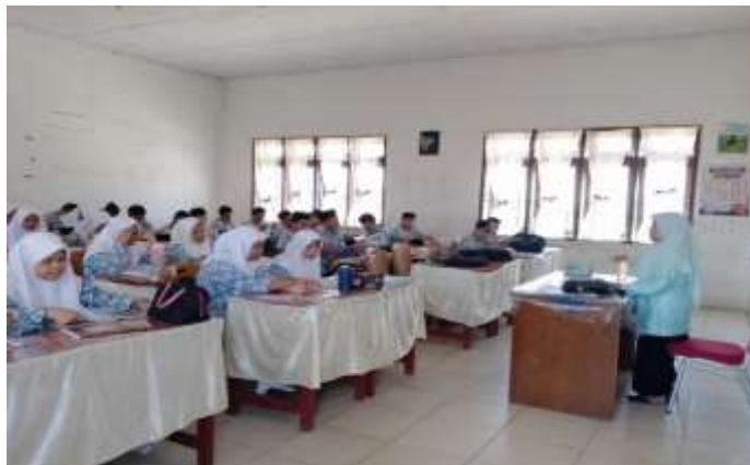
Dokumentasi metode ceramah