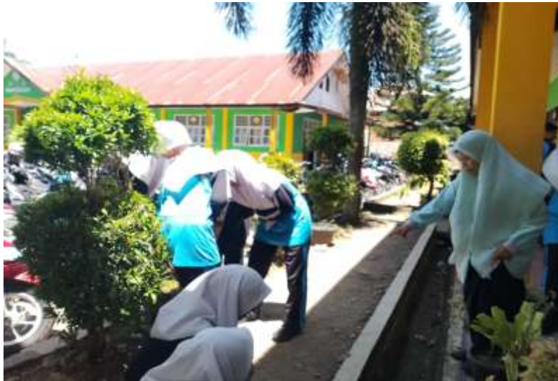
Dokumentasi gotong royong