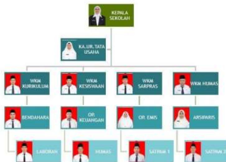
Gambar 4.1 Struktur Organisasi MAN 1 Padangsidempuan