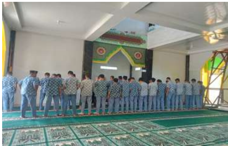
Dokumentasi shalat berjamaah