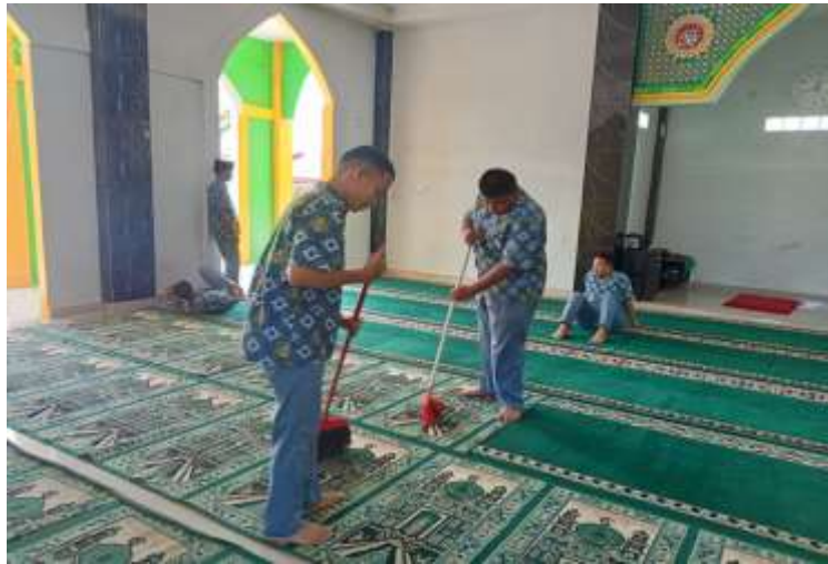
Dokumentasi membersihkan masjid Ketika sholat berjamaah mau dilaksanakan