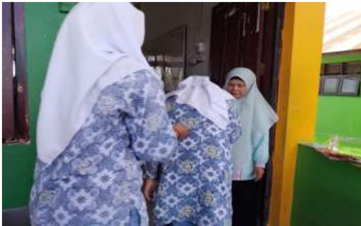
Dokumentasi murid menyalam guru Ketika mau masuk kelas