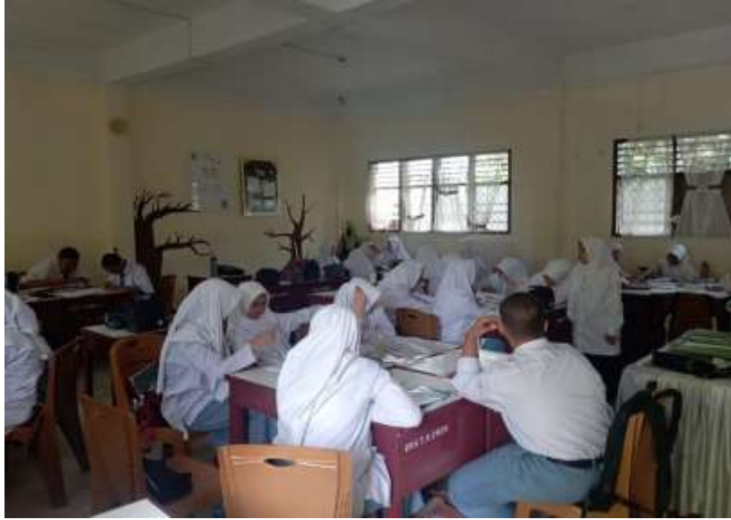
Dokumentasi metode diskusi