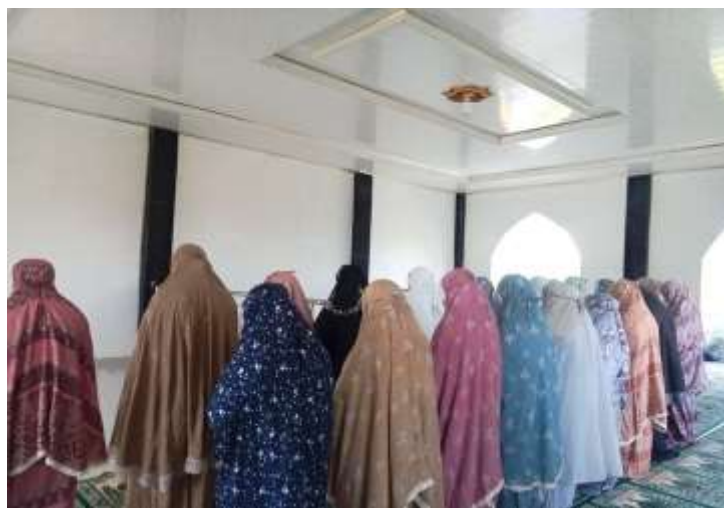
Dokumentasi shalat berjamaah