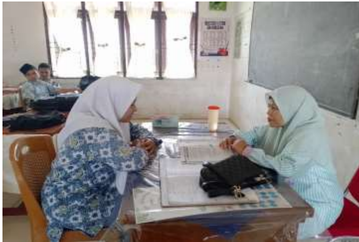
Dokumentasi bimbingan personal