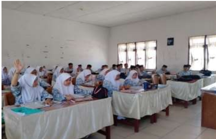
Dokumentasi metode tanya jawab