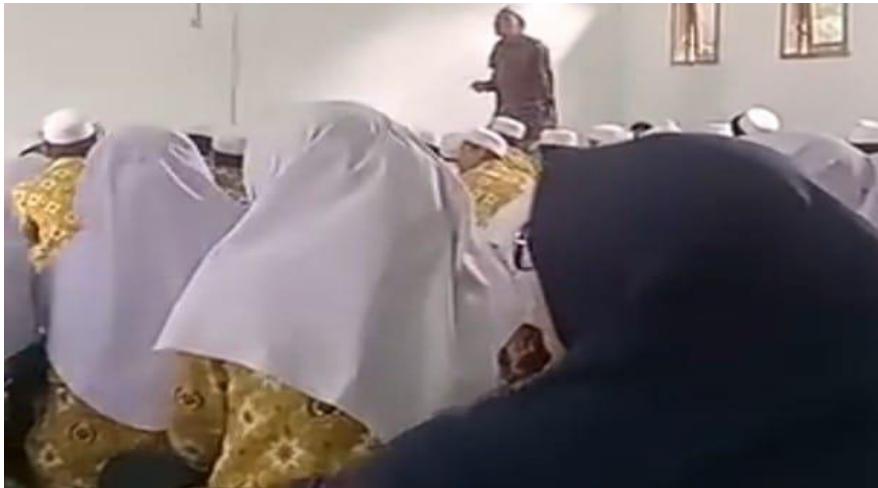
Mengadakan Kegiatan zikir rutin