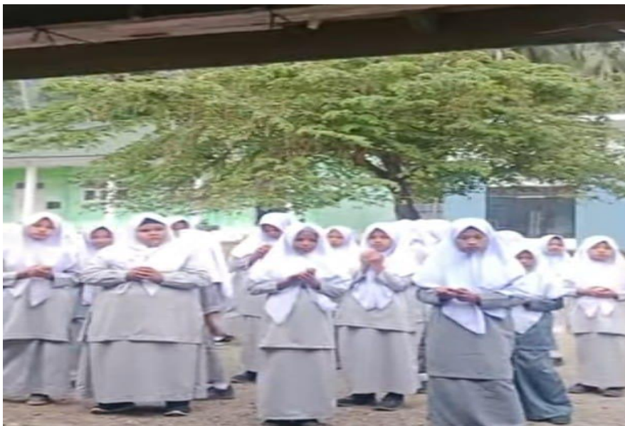
Melaksanakan Apel Pagi