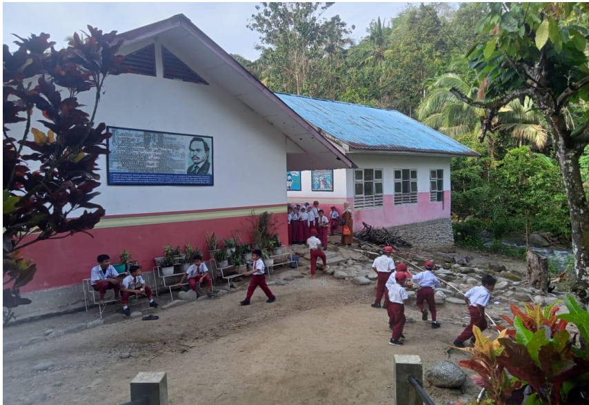
Gambar 1.1 Sekolah SDN 108 Aek Mata Kecamatan Panyabungan Kabupaten Mandailing Natal