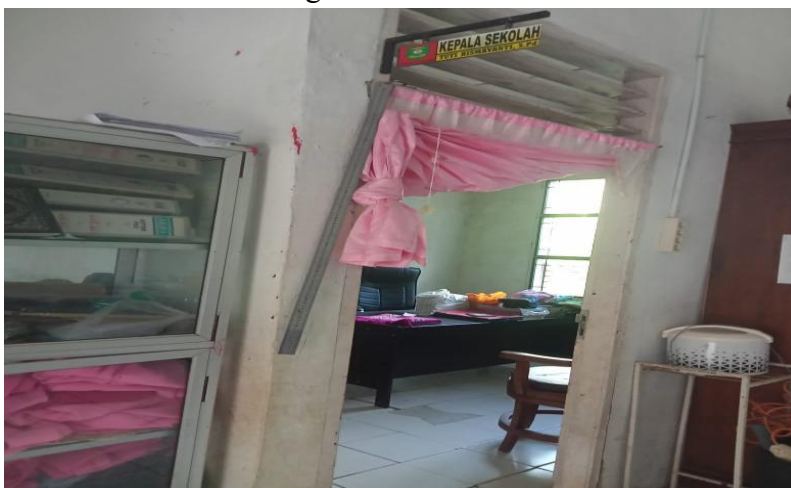
Gambar 1.8 Ruang Kepala Sekolah SDN 108 Aek Mata Kecamatan Panyabungan Kabupaten Mandailing Natal