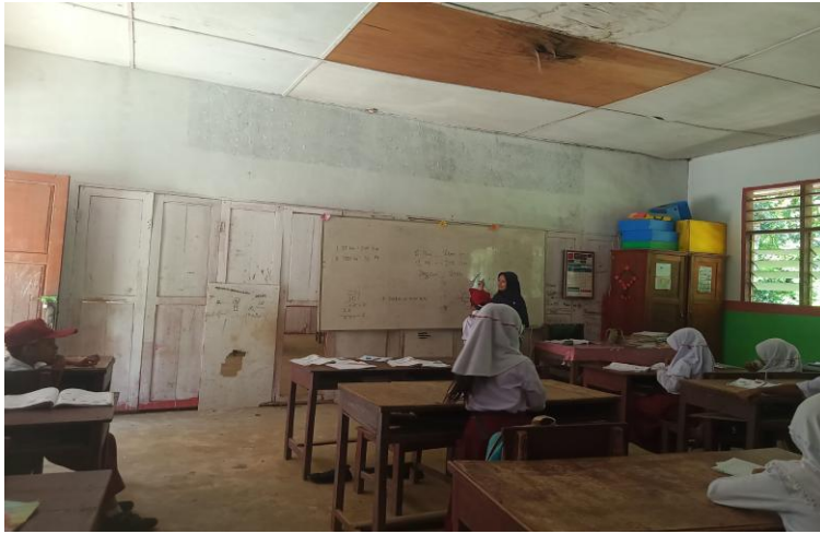
Gambar 1.6 Ruang Kelas SDN 108 Aek Mata Kecamatan Panyabungan Kabupaten Mandailing Natal