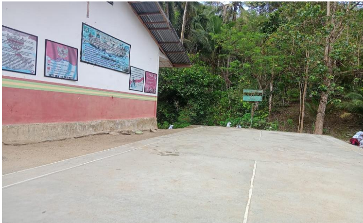
Gambar 1.4 Lapangan Olahraga SDN 108 Aek Mata Kecamatan Panyabungan Kabupaten Mandailing Natal