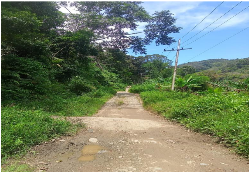
Gambar 1.2 Jalan Menuju ke SDN 108 Aek Mata Kecamatan Panyabungan Kabupaten Mandailing Natal