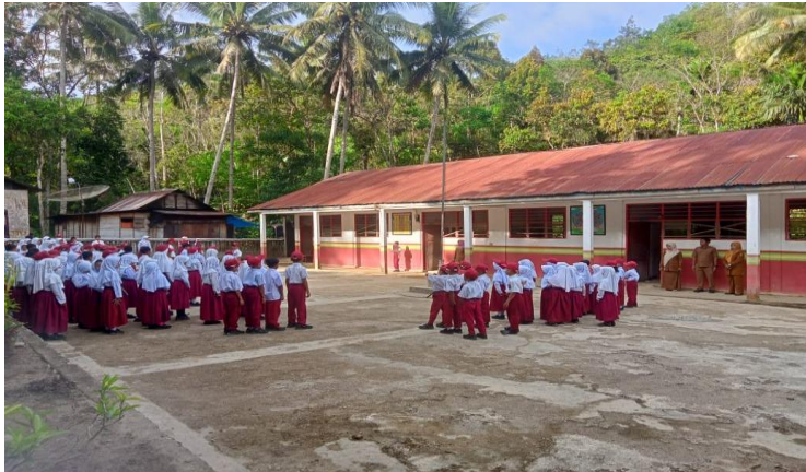
Gambar 1.3 Lapangan Upacara Bendera SDN 108 Aek Mata Kecamatan Panyabungan Kabupaten Mandailing Natal