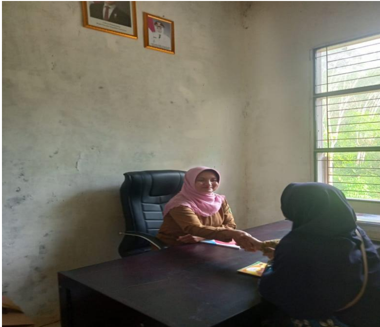
Gambar 1.9 Wawancara dengan Kepala Sekolah SDN 108 Aek Mata Kecamatan Panyabungan Kabupaten Mandailing Natal