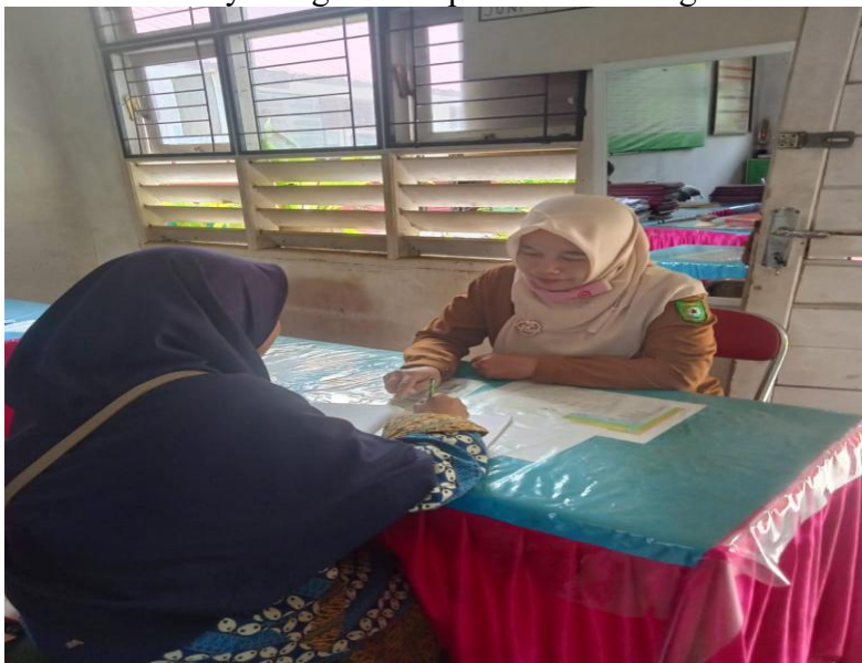
Gambar 1.10 Wawancara dengan Bendahara SDN 108 Aek Mata Kecamatan Panyabungan Kabupaten Mandailing Natal