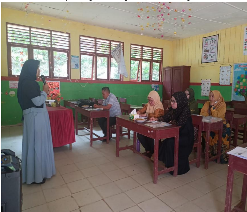
Gambar 1.12 Pelatihan dan Pengembangan Profesi Guru SDN 108 Aek Mata Kecamatan Panyabungan Kabupaten Mandailing Natal