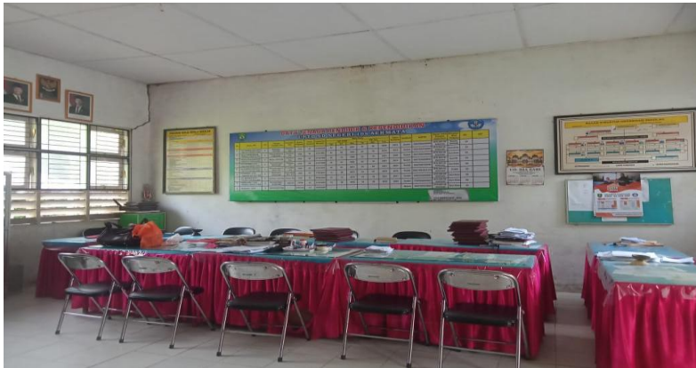
Gambar 1.7 Ruang Guru SDN 108 Aek Mata Kecamatan Panyabungan Kabupaten Mandailing Natal