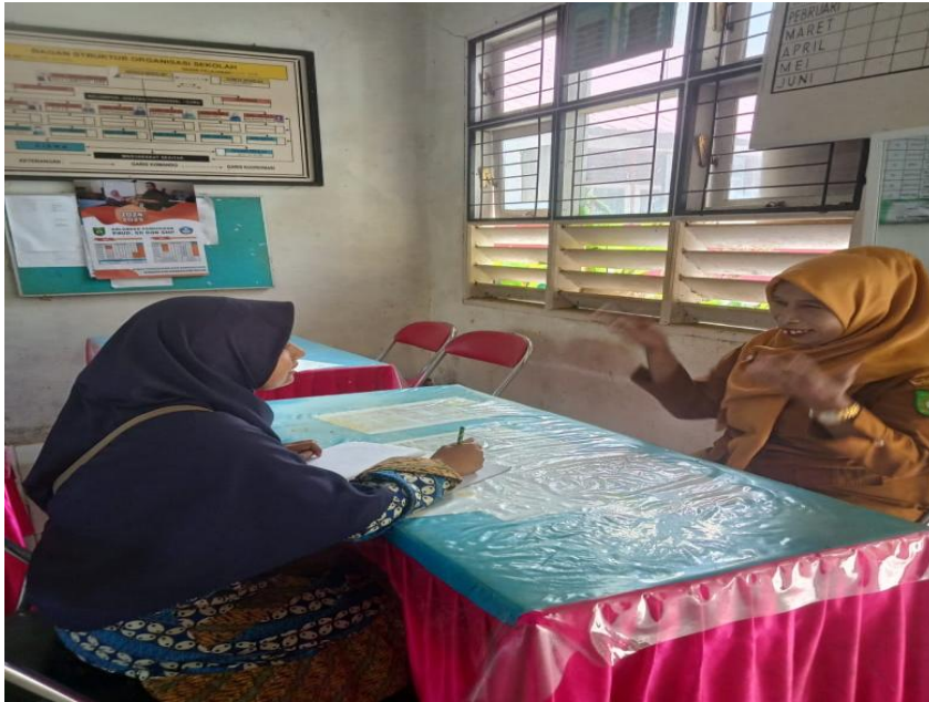
Gambar 1.11 Wawancara dengan Tenaga Pendidik SDN 108 Aek Mata Kecamatan Panyabungan Kabupaten Mandailing Natal