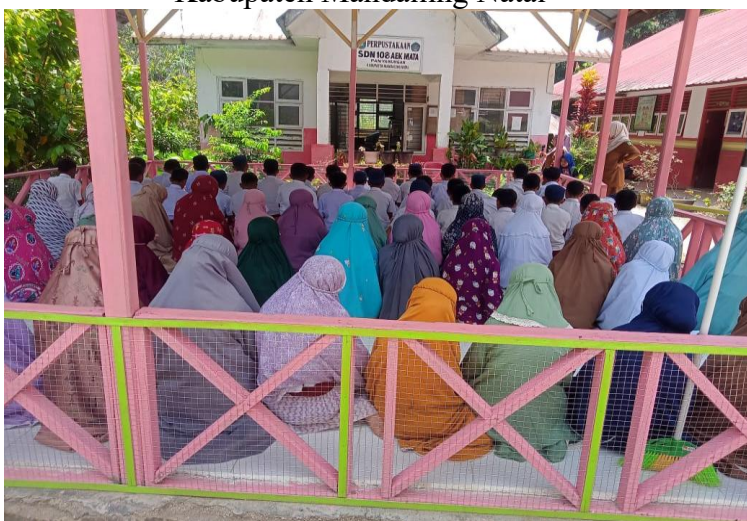
Gambar 1.5 Ruang Sholat SDN 108 Aek Mata Kecamatan Panyabungan Kabupaten Mandailing Natal