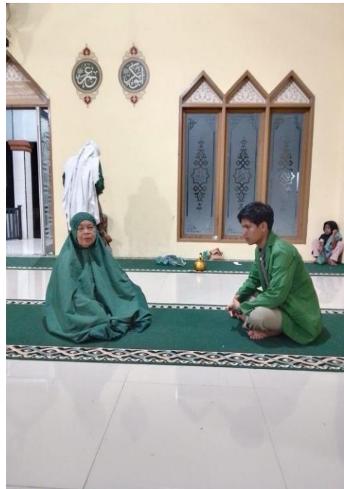
Gambar Wawancara dengan Ustadz dan Ketua Majelis Ta'lim Masjid Nurul Jihad Desa Kubangan Tompek Kecamatan Batahan Kabupaten Mandailing Natal.