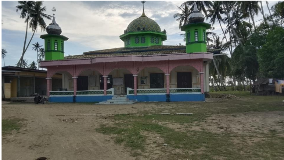
Gambar Masjid Nurul Jihad Desa Kubangan Tompek Kecamatan Batahan Kabupaten Mandailing Natal