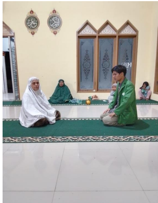
Gambar Wawancara dengan Ustadz dan Ketua Majelis Ta'lim Masjid Nurul Jihad Desa Kubangan Tompek Kecamatan Batahan Kabupaten Mandailing Natal