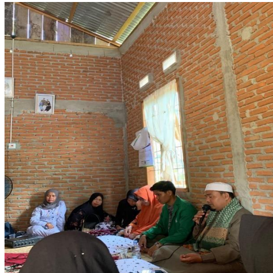
Gambar Kegiatan Majelis Ta'lim Masjid Nurul Jihad Desa Kubangan Tompek Kecamatan Batahan Kabupaten Mandailing Natal