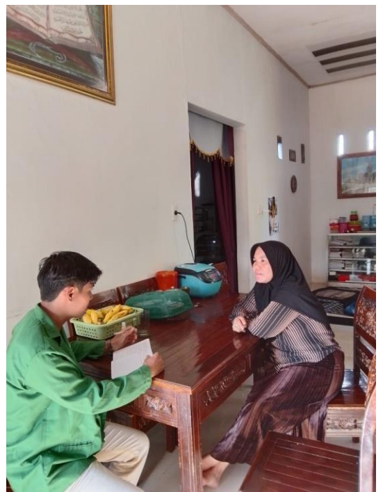
Gambar Wawancara dengan Sekretaris dan Bendahara Majelis Ta'lim Masjid Nurul Jihad Desa Kubangan Tompek Kecamatan Batahan Kabupaten Mandailing Natal