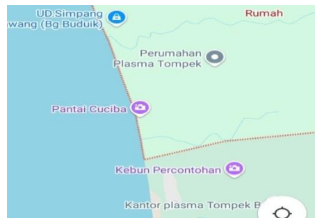
Gambar 4.1 Peta Desa Kubangan Tompek