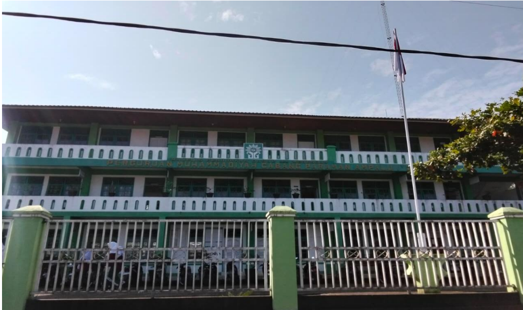
Gambar 1.1: MTs Muhammadiyah Paraman Ampalu