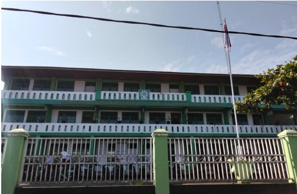
Gambar III.1: MTs Muhammadiyah Paraman Ampalu

Penelitian dilaksanakan di MTs Muhammadiyah Paraman Ampalu. Peneliti memilih lokasi ini karena anak-anak di sekolah ini memiliki kemampuan membaca Al-Qur'an yang baik, yang dapat membentuk keterampilan belajar yang optimal. Dengan keterampilan tersebut, tercipta pembelajaran yang efektif dan didukung oleh fasilitas yang memadai serta dukungan dari guru. Selain itu, sekolah ini memiliki latar belakang keagamaan yang kuat, sehingga peneliti tertarik untuk menganalisis proses pembelajaran tulis baca Al-Qur'an di MTs Muhammadiyah Paraman Ampalu.