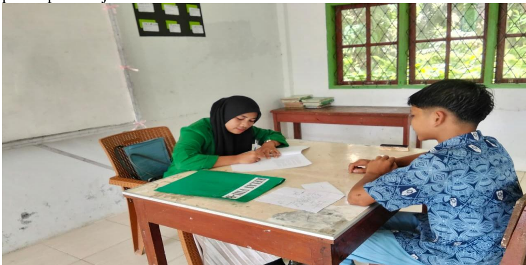
Gambar 1.6: Siswa kelas VIII di MTs Muhammadiyah Paraman Ampalu pada saat proses pembelajaran