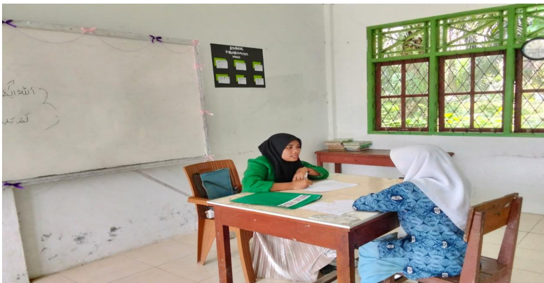
Gambar 1.4: Wawancara dengan Siswa MTs Mumammadiyah Paraman Ampalu.