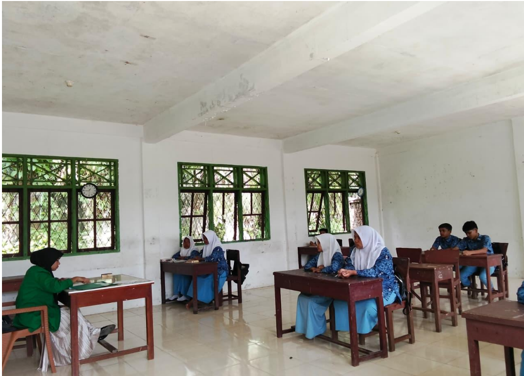
Gambar 1.5: Siswa kelas VIII di MTs Muhammadiyah Paraman Ampalu pada saat proses pembelajaran