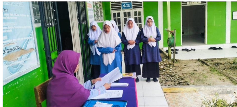
Gambar 4.3 guru sebagai penilai dalam beribadah siswa 12

Adapun dokumentasi guru sebagai penilai dalam beribadah siswa kelas VII.