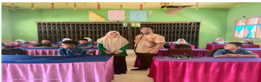
Gambar 4.2 guru sebagai pengawas dan pengingat kepada siswa 8

Adapun dokumentasi guru sebagai pengawas dan pengingat kepada siswa sebagai berikut: