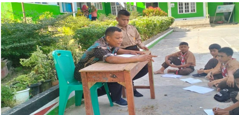
Gambar 4.1 guru PAI sebagai penyemangat kepada siswa kelas VII 3

Adapun dokumentasi guru PAI memberikan motivasi kepada siswa kelas VII sebagai berikut: