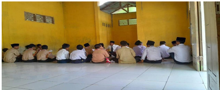
Gambar 4.4 guru membimbing siswa sebelum melaksanakan shalat berjamaah 16

Adapun dokumentasi guru sebagai pembimbing kepada siswa dalam beribadah dapat dilihat sebagai berikut: