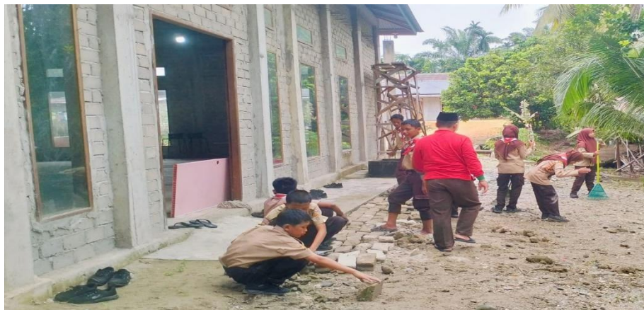
Gambar 4.5 kebersihan Mushallah 24

Adapun dokumentasi Ketika kebersihan mushallah sebagai berikut: