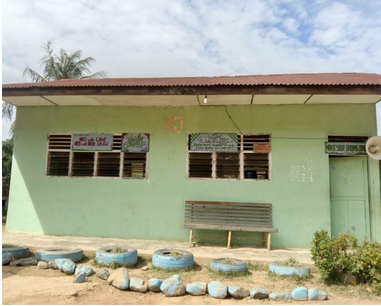
دوان المهد روضة الجن