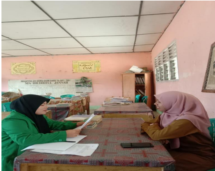
مقابلة مع معلمة المحادثة في معهد روضة الجنة