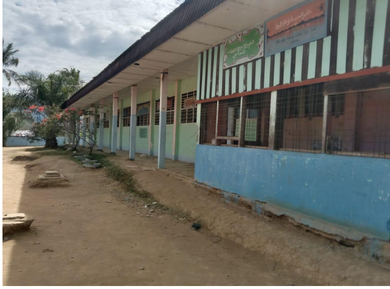
فصول الدراسية في المدرسة العالية