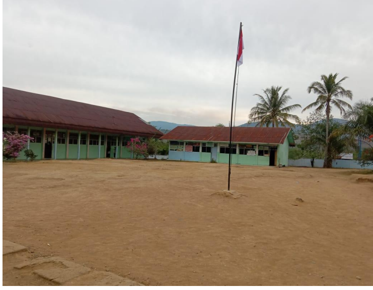
ميدان الدراسية مساكن المعهد