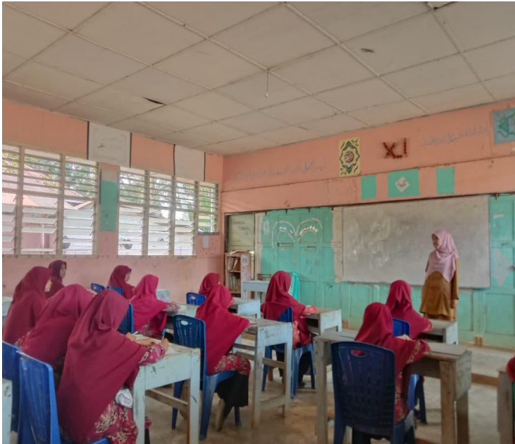
معلمة تعلم المحادث