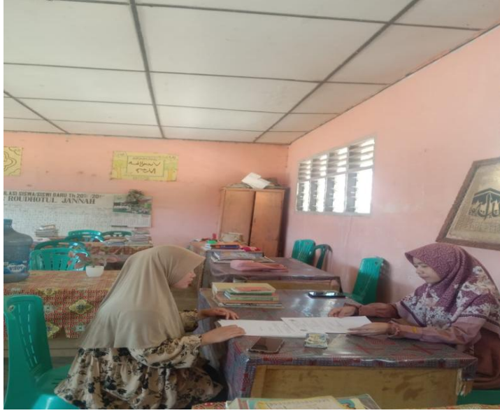
مقابلة مع ريس المدرسة