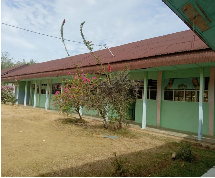
فصول الدراسية في المدرسة الثانوي