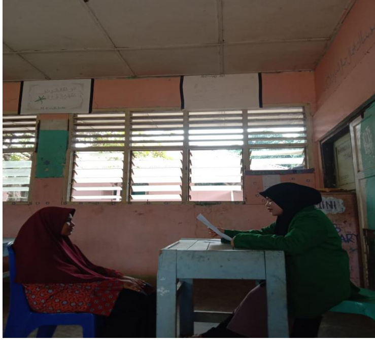
مقابلة مع الطالبات في معهد روضة الجنة