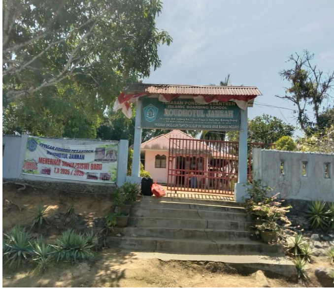
بوابة المعهد روضة الجنة باجاران باتو