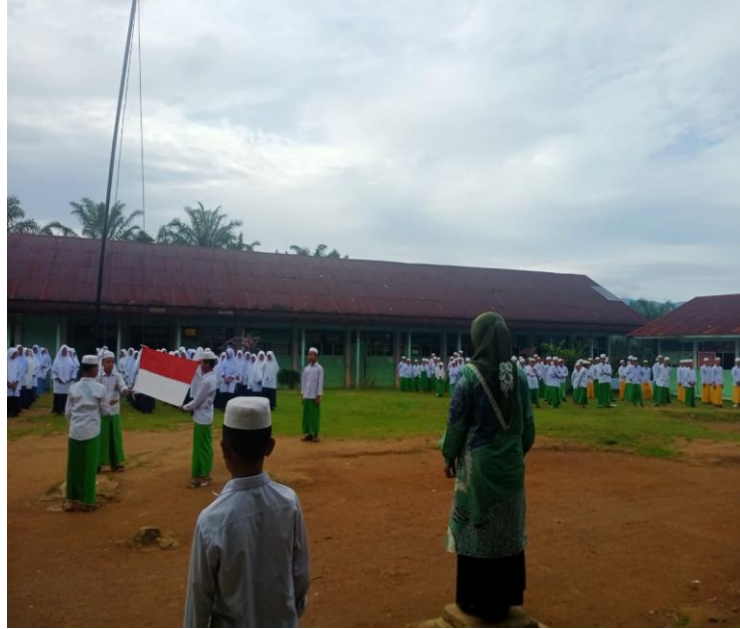
نشاط مراسم رفع العلم باستخدام اللغة العربي