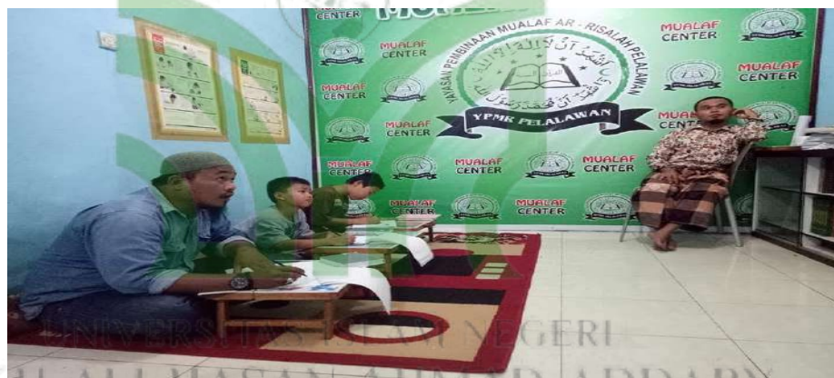
Gambar IV.2 Pembinaan Berbasis Pengajian Kelompok Kecil (halaqah)

"Kami sengaja buat kelompok kecil supaya pembinaan lebih fokus dan mereka tidak sungkan bertanya. Biasanya satu kelompok terdiri dari 5–10 orang, kami sesuaikan dengan lokasi dan jadwal mereka," 53