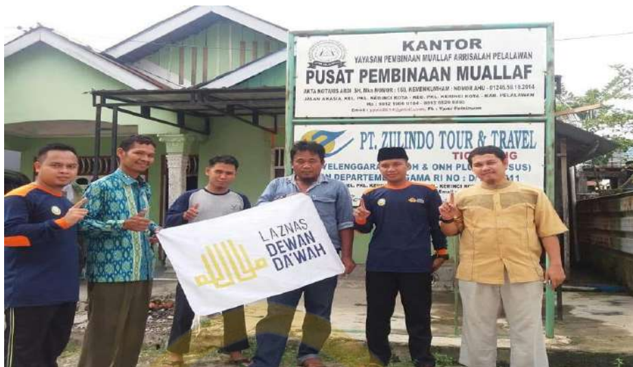
Gambar IV. 4 Penguatan Sosial Melalui kegiatan bersama

Keberagaman strategi ini menunjukkan bahwa Muallaf Center Ar-Risalah tidak hanya memfokuskan pembinaan pada sisi keilmuan semata, tetapi juga menyentuh dimensi emosional, sosial, dan praktik keagamaan. Kombinasi antara teori, praktik, dan pendekatan personal menjadikan pembinaan akidah berjalan secara menyeluruh dan berkesinambungan. Dengan metode tersebut, muallaf diharapkan tidak hanya memahami akidah secara rasional, tetapi juga menanamkannya secara mendalam dalam hati dan tindakan sehari-hari.