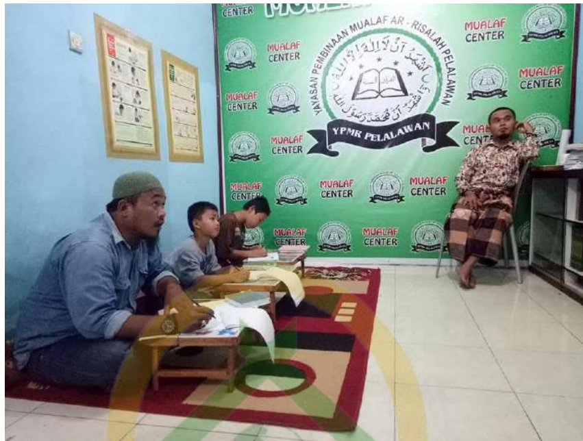
Peneliti melakukan observasi secara langsung kegiatan Pembinaan berbasis pengajian kelompok kecil (halaqah).