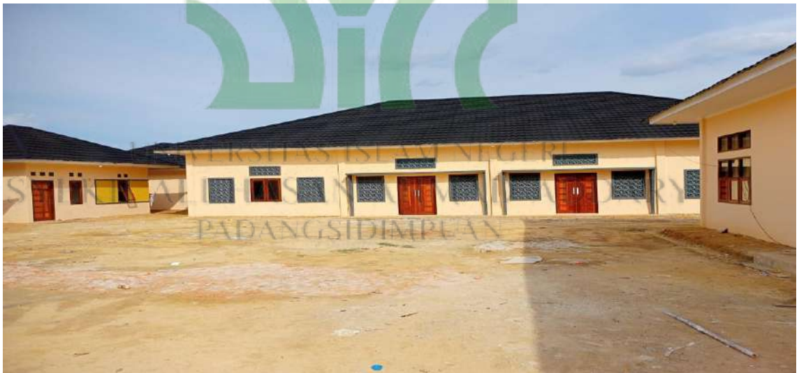
Masjid Muallaf Center Ar-Risalah Kecamatan Kerinci, Kabupaten Pelalawan, Provinsi Riau