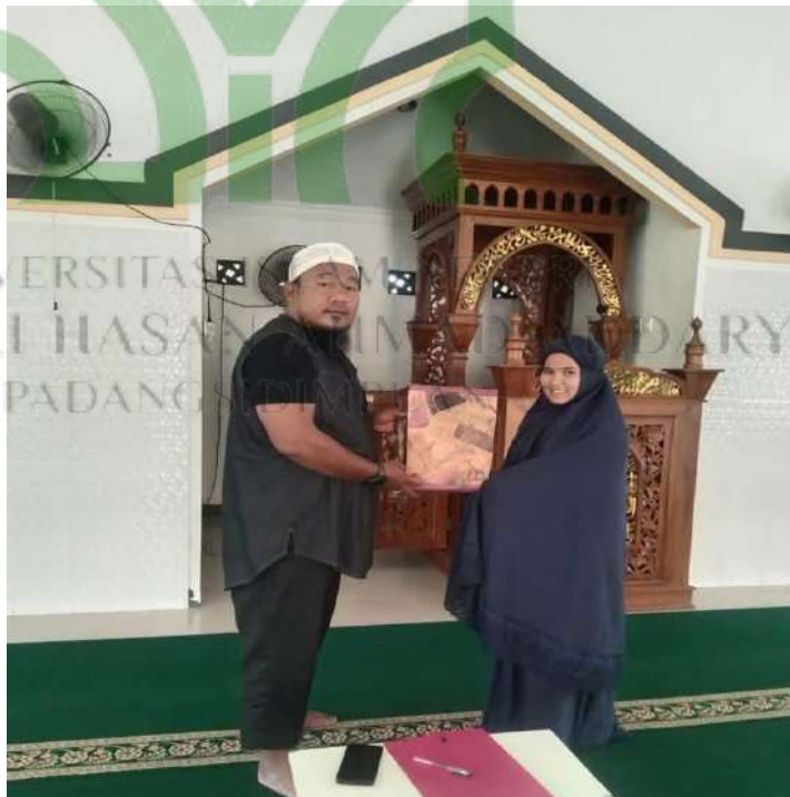
Pemberian hadiah sebagai wujud penguatan kepada muallaf