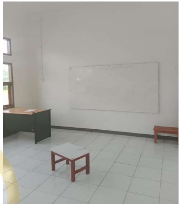
Ruang Belajar dan Bimbingan Muallaf Center Ar-Risalah Kecamatan Kerinci, Kabupaten Pelalawan, Provinsi Riau