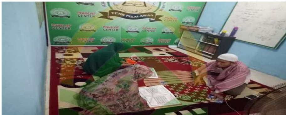
Gambar IV. 3 Demonstrasi praktik ibadah.

"Banyak dari mereka yang baru pertama kali salat atau mengaji, jadi kami tunjukkan langsung, lalu mereka ikut. Ini lebih mudah daripada hanya menjelaskan secara teori,". 54