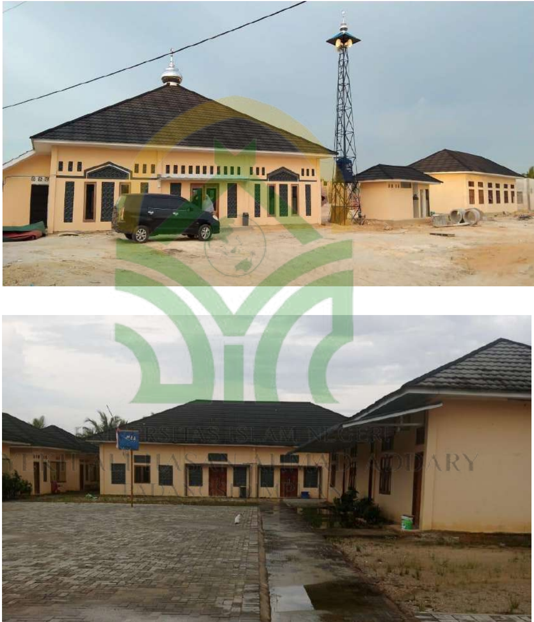
Gambar IV.1 Muallaf Center Ar-Risalah Kerinci

tantangan tersendiri dalam hal adaptasi sosial budaya. Namun, hal ini juga menjadi peluang untuk memperkenalkan Islam secara lebih mendalam kepada berbagai kalangan.