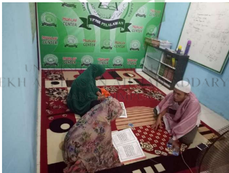
Peneliti melakukan ikut mendampingi kegiatan demonstrasi praktik ibadah (Membaca Al-Qur'an)