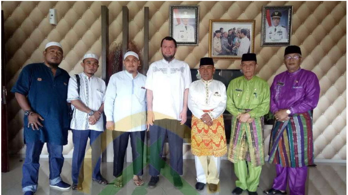
Foto Bersama dengan Para Pembina Muallaf Center Ar-Risalah Kecamatan Kerinci, Kabupaten Pelalawan, Provinsi Riau