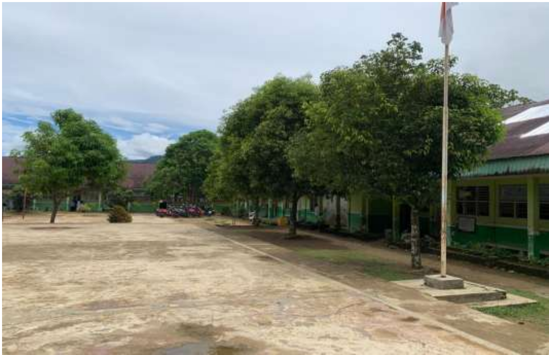
Lapangan Sekolah MAS Nahdlatul Ulama Batangtoru