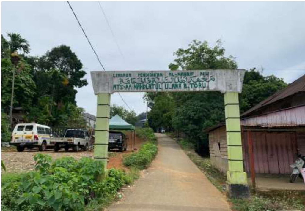
Gerbang MAS Nahdlatul Ulama Batangtoru