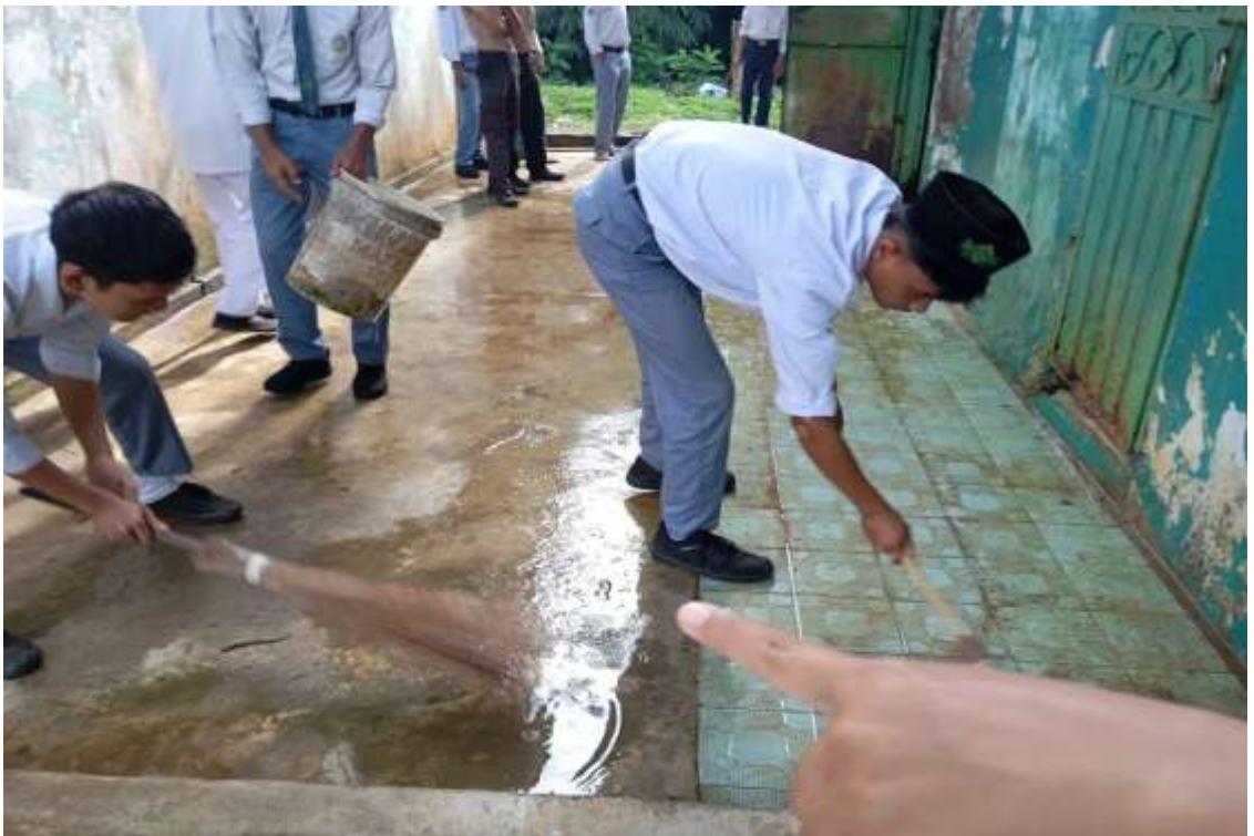
Kegiatan Pembinaan Disiplin Siswa di MAS Nahdlatul Ulama Batangtoru