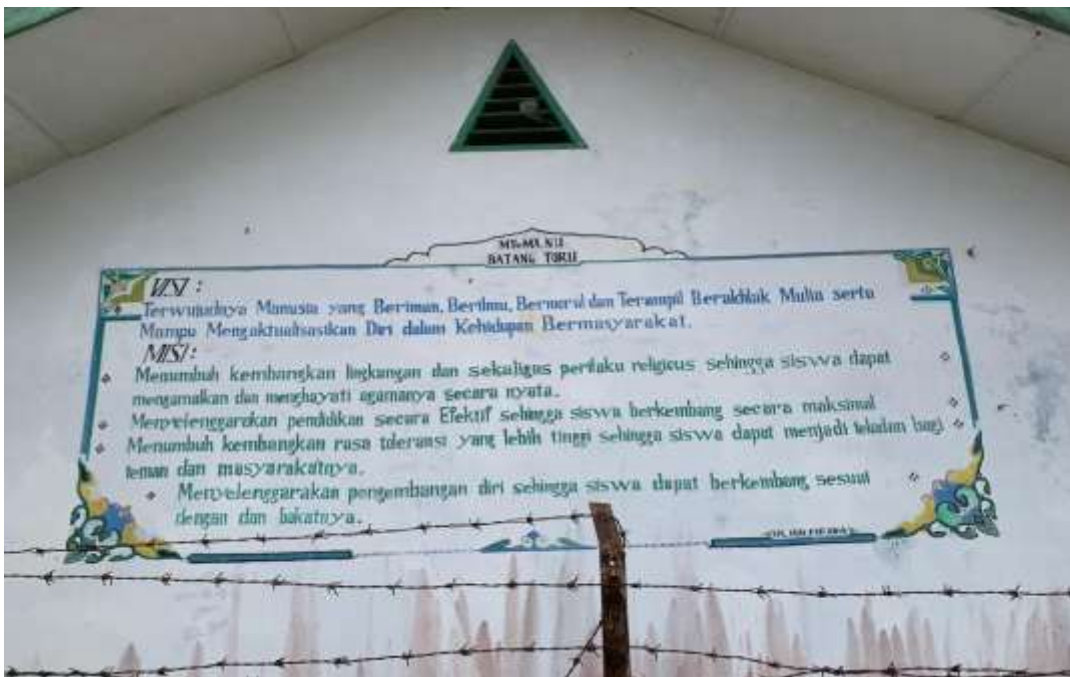
Visi dan Misi MAS Nahdlatul Ulama Batangtoru