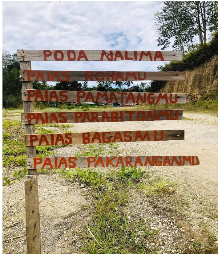
Gambar 4.1 Papan Poda Na Lima 4