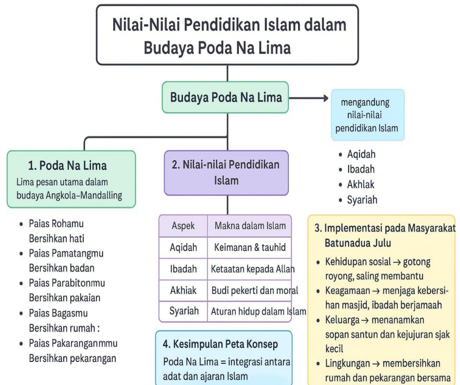
Gambar IV.2 Peta Konsep Penelitian

Adapun peta konsep pada penelitian ini dapat dilihat pada gambar di bawah ini.