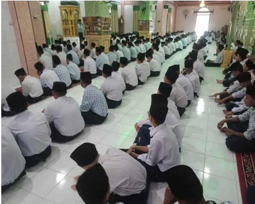
Gambar 1.8 Pembinaan Sholat Dhuha