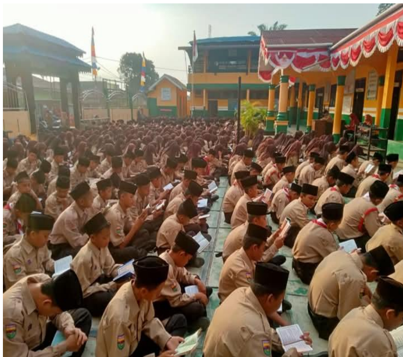
Keadaan Siswa MTs S Islamiyah Kotapinang

Sumber Data: MTs S Islamiyah Kotapinang Tahun 2025