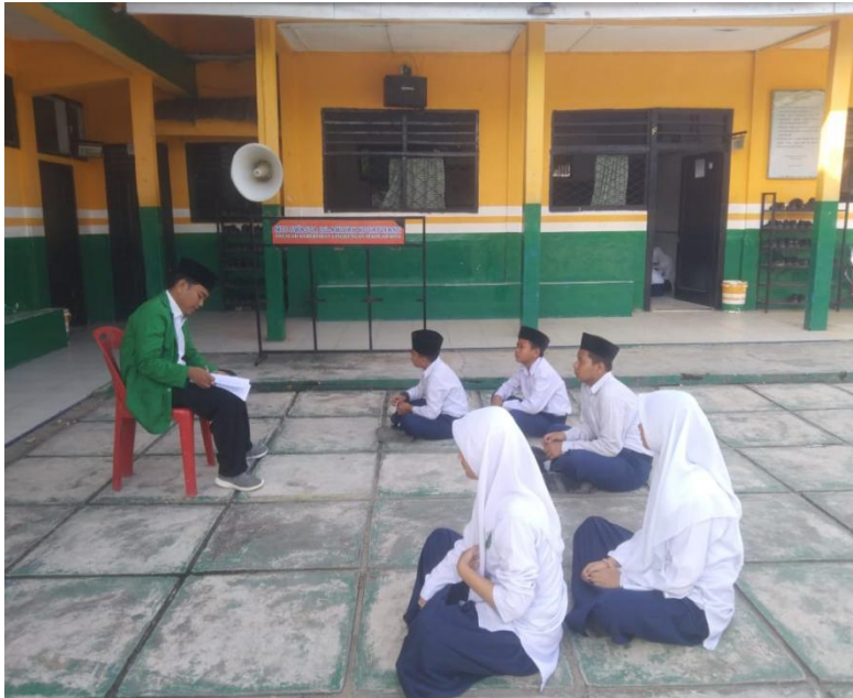
Gambar 1.5 Wawancara Dengan Siswa Kelas Viii MTs S Islamiyah Kotapinang