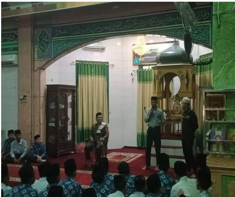
Gambar 1.9 Pembinaan Pidato