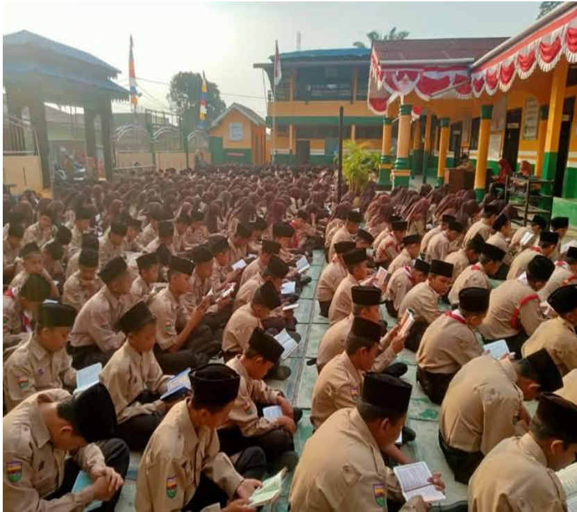
Gambar 1.10 Pembinaan Baca Yasin