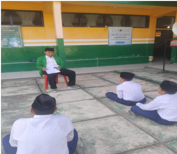
Gambar 1.4 Wawancara Dengan Siswa Kelas Vii MTs S Islamiyah Kotapinang