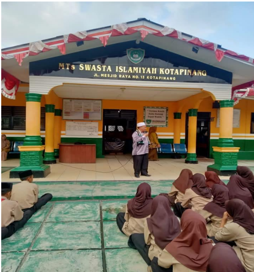
Gambar 1.11 Pembinaan Khutbah Minggu Untuk Kedua, Ketiga, dan Keempat