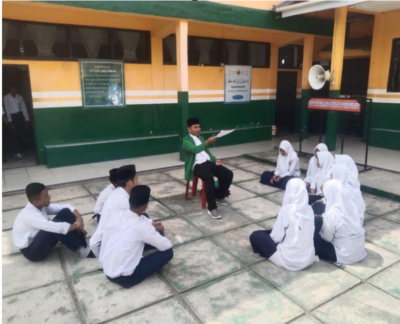
Gambar 1.6 Wawancara Dengan Siswa Kelas Ix MTs S Islamiyah Kotapinang