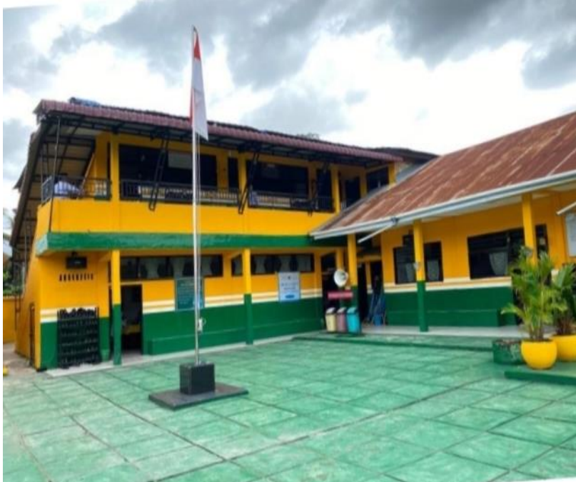
Gambar 1.7 Keadaan MTs S Islamiyah Kotapinang