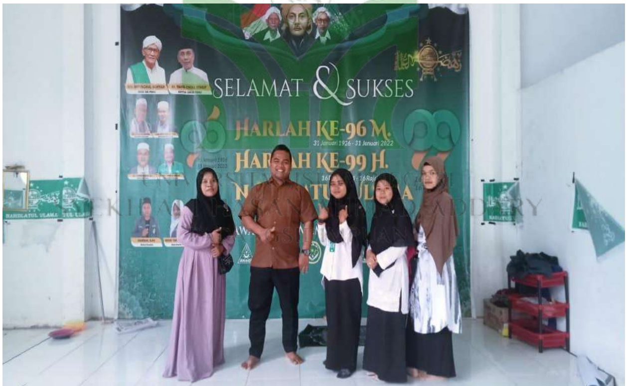
Photo kegiatan PKPNU Tahun 2021