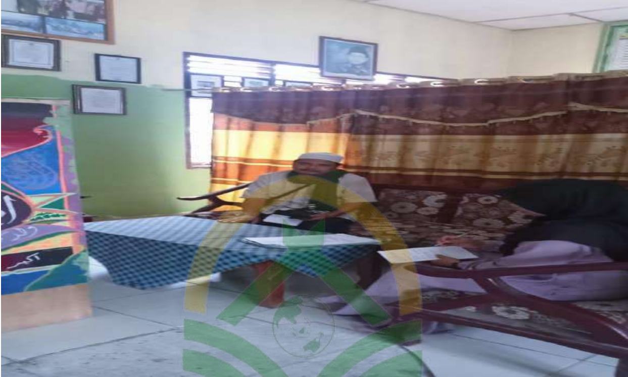
Dokumentasi pas wawancara dengan sekretaris NU Kabupaten Padang Lawas