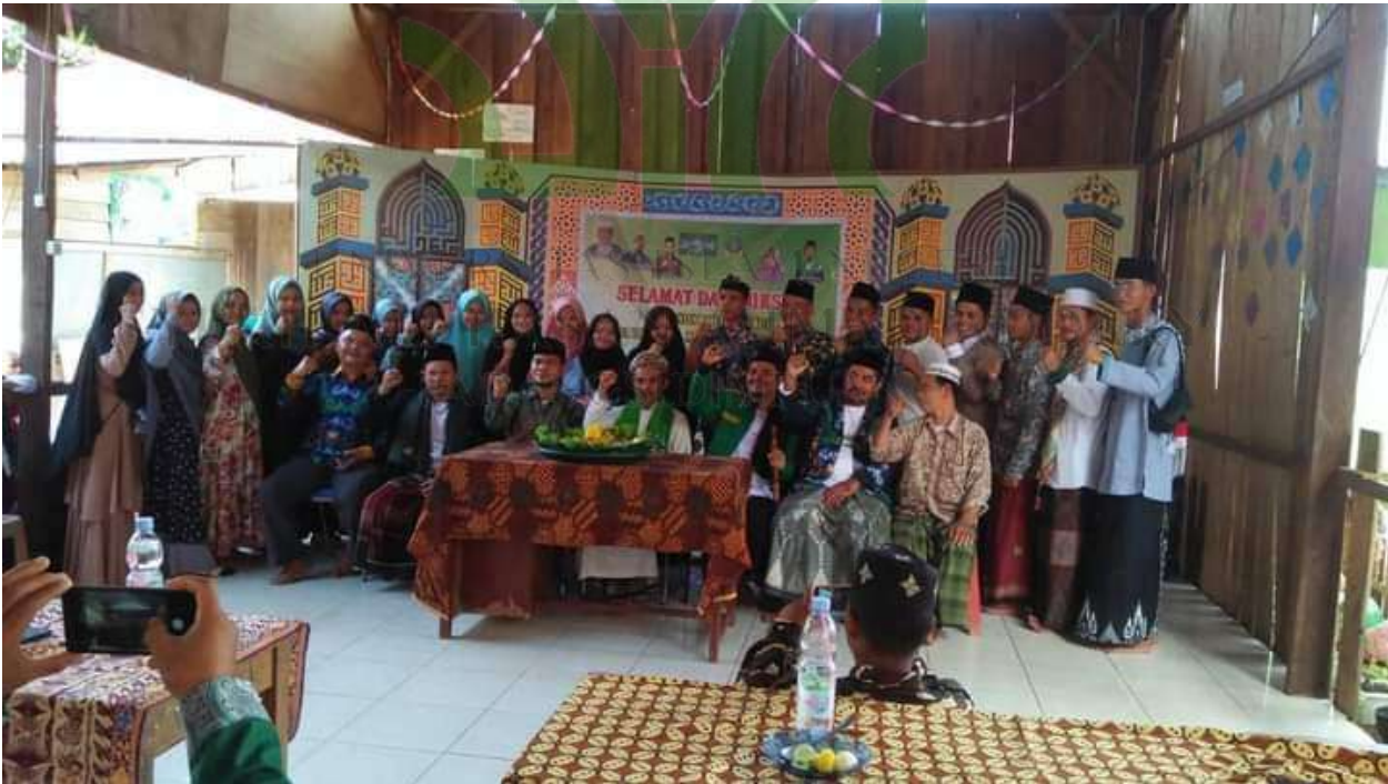
Fehoto bersama selesai acara seminar