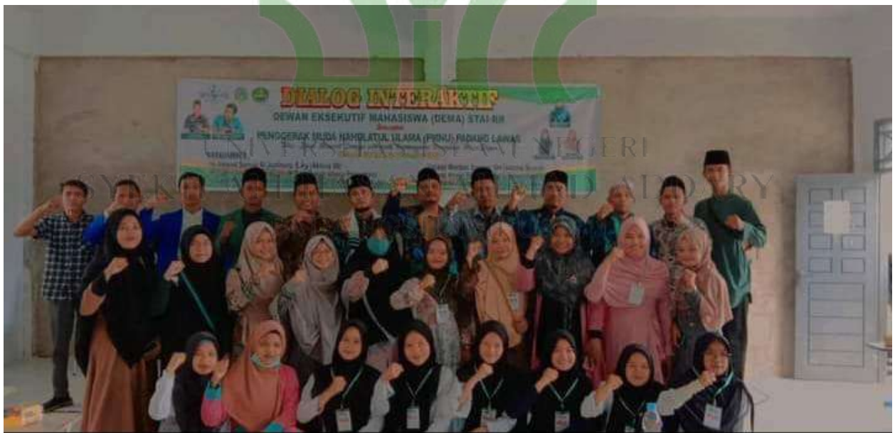
Dokumentasi acara dialog interaktif