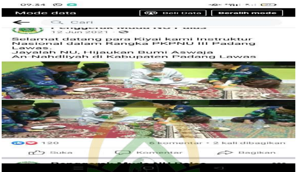
Sebarab perekrutan PKPNU Padang Lawas yang Ke-II dan III