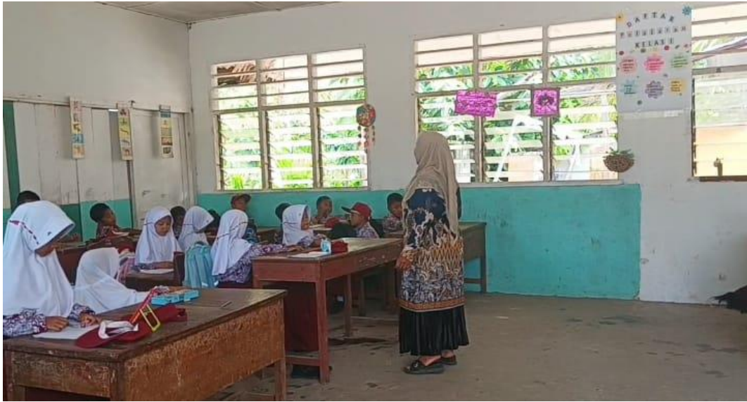
Guru menjelaskan dengan menggunakan metode ceramah