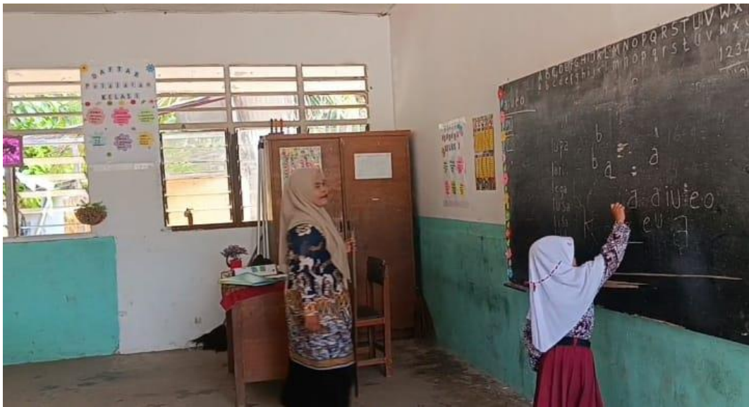
Peserta didik menulis huruf abjad A di papan tulis