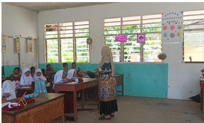
Gambar 3. Guru Menjelaskan Materi Menggunakan Metode Ceramah 16