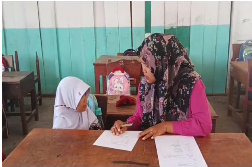
Wawancara dengan siswa kelas I