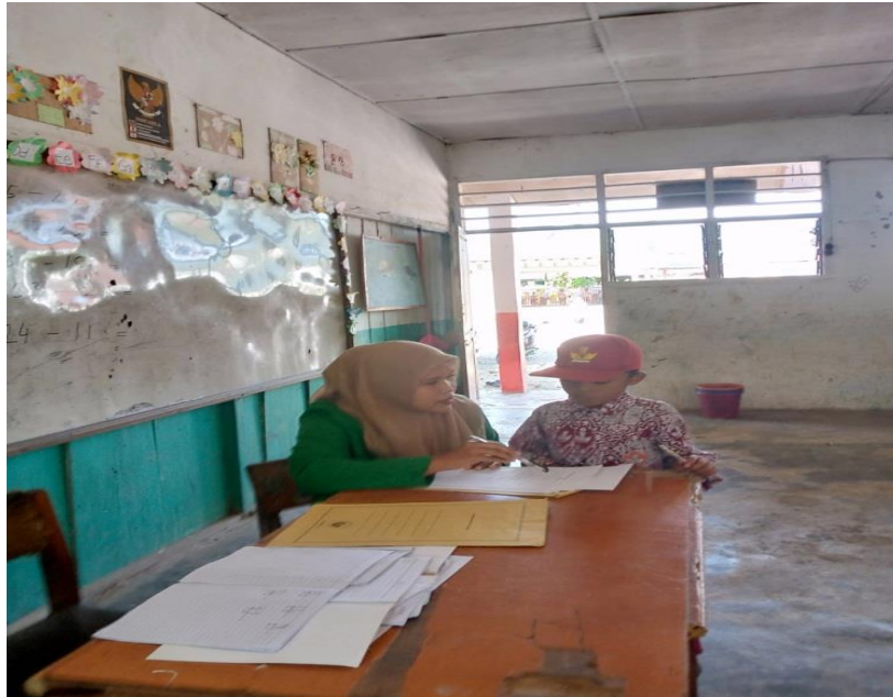
Wawancara dengan siswa kelas I