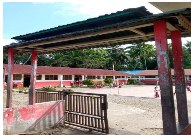
SD Negeri 142 Hutabaringin