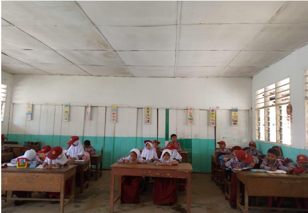
Peserta didik mendengarkan guru pada saat menjelaskan menggunakan meode ceramah