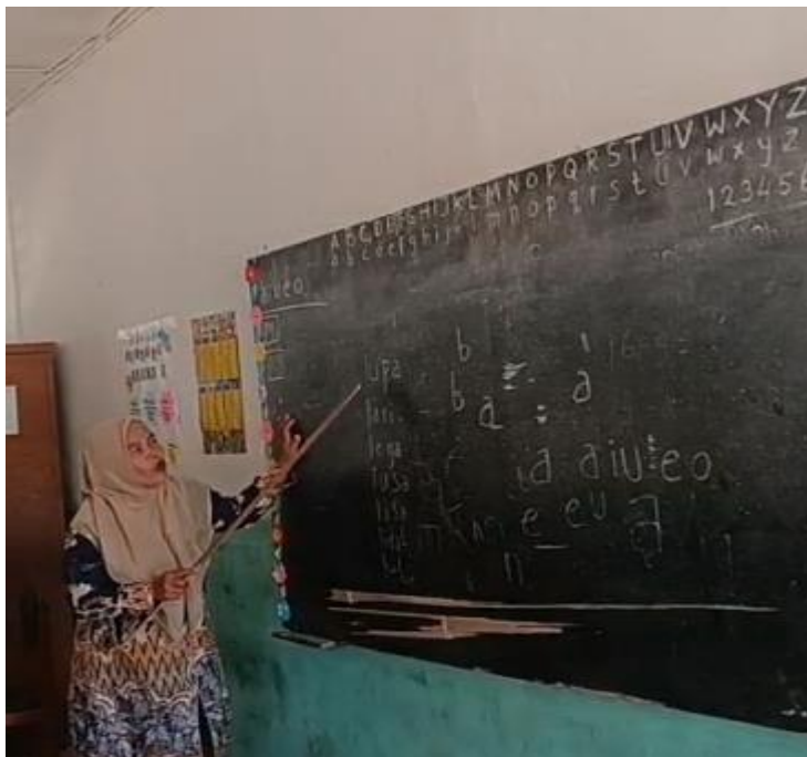
Gambar 2. Kegiatan Guru Dalam Memperkenalkan Kalimat Sederhana Dan Menguraikan Menjadi Kata. 18

Hal ini dibenarkan dengan adanya hasil observasi peneliti berupa dokumentasi.