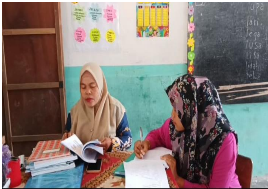
Wawancara dengan Guru kelas I