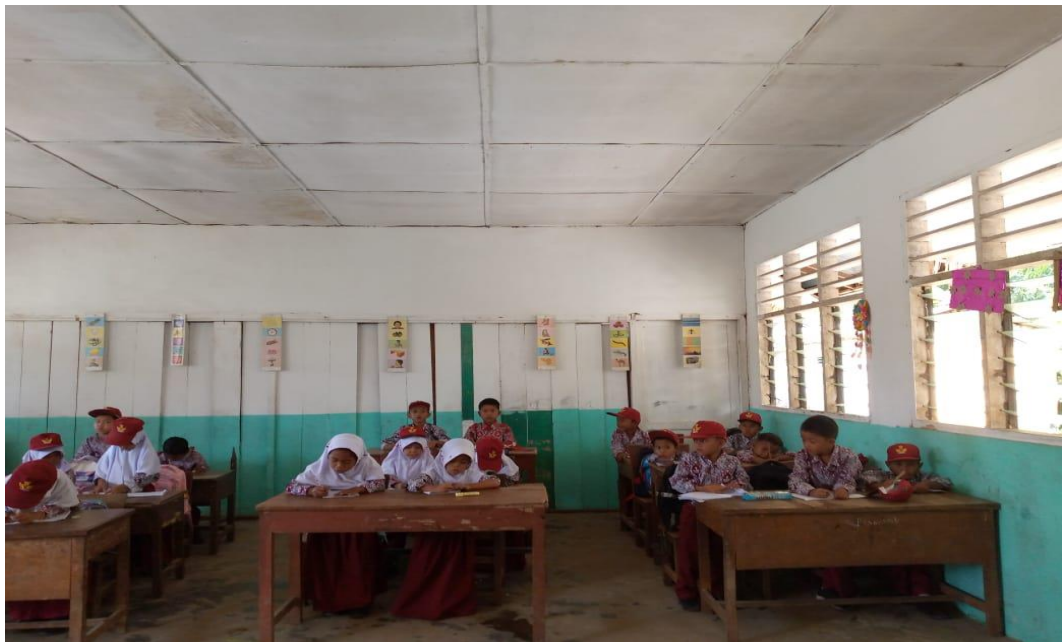
Peserta didik menulis huruf Vokal di buku tulis setelah guru menuliskan di papan tulis