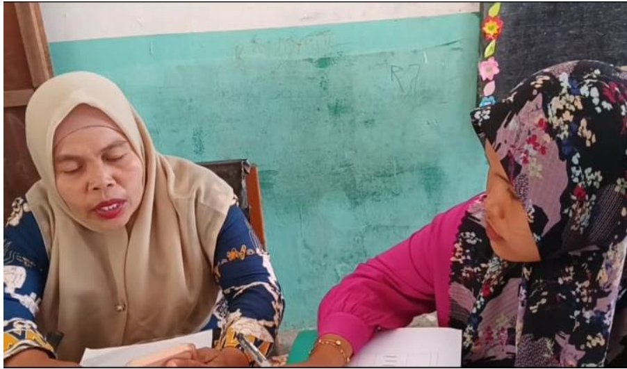
Wawancara dengan Guru kelas I