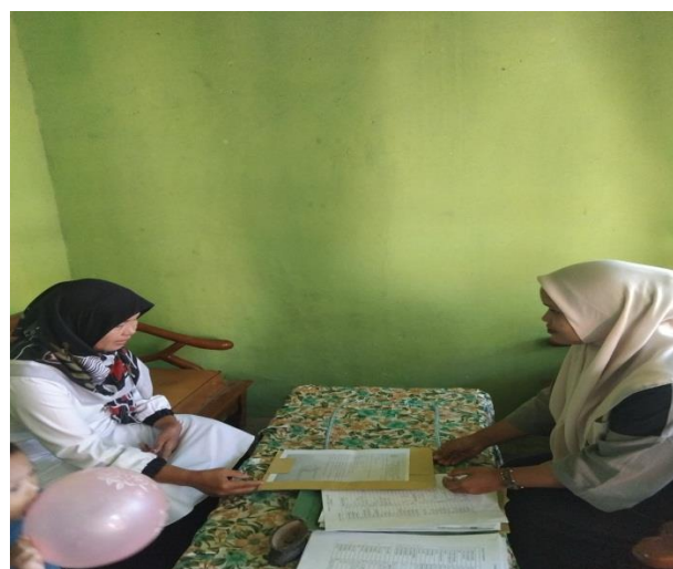
Penyerahan surat izin kepada kepala sekolah