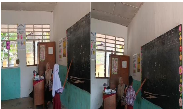
Gambar 1. Kegiatan les Tambahan Sebelum pulang Sekolah

Hal ini dibenarkan dengan hasil observasi peneliti berupa dokumentasi: 5