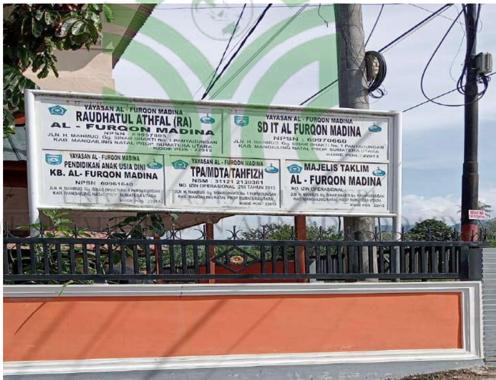
SD IT Al-Furqon Mandailing Natal