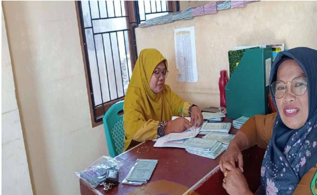
Wawancara dengan Ibu Wakil Kepala SD IT Al-Furqon