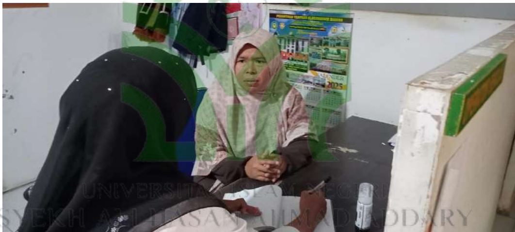
Wawancara dengan kepala sekolah Al-Husnayain mengenai kegiatan ekstrakurikuler