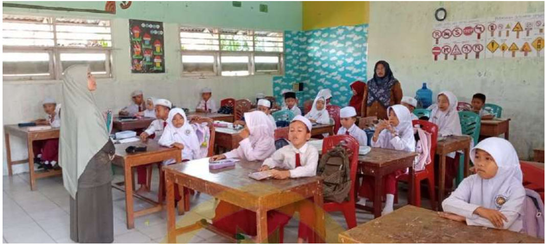
Dokumentasi saat ekstrakurikuler Tahfidz di Al-Husnayain Kelas IV