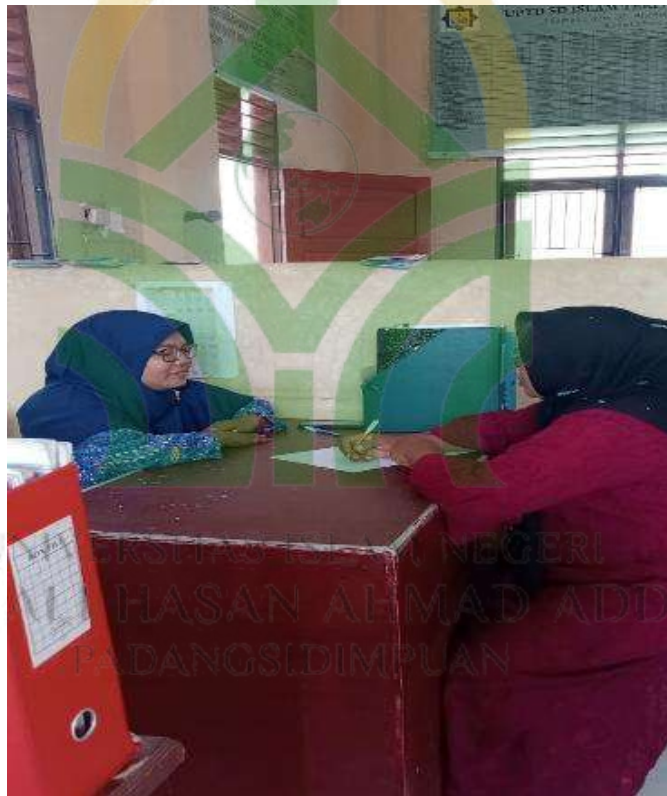
Wawancara dengan Ibu Pembina Ekstrakurikuler SD IT Al-Husnayain