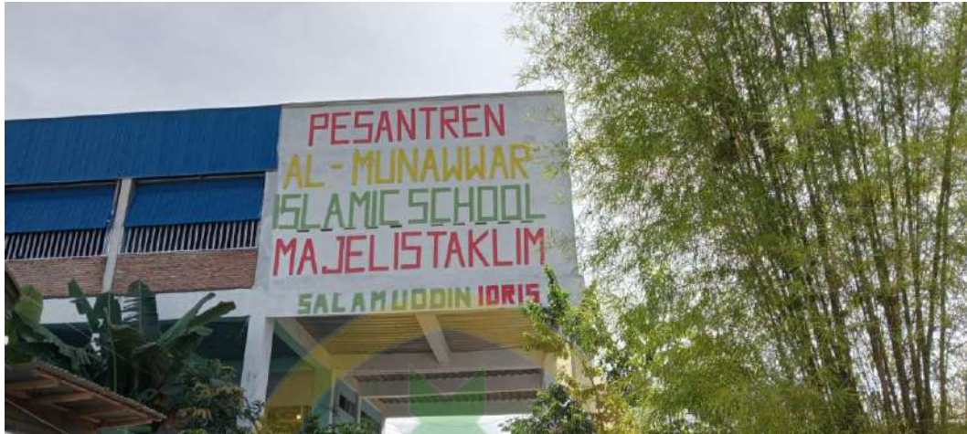
Sekolah SD IT Al-Munawwar