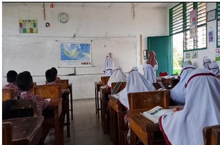
Gambar.5 kegiatan diskusi siswa kelas V SDN 200117 Padangsidempuan