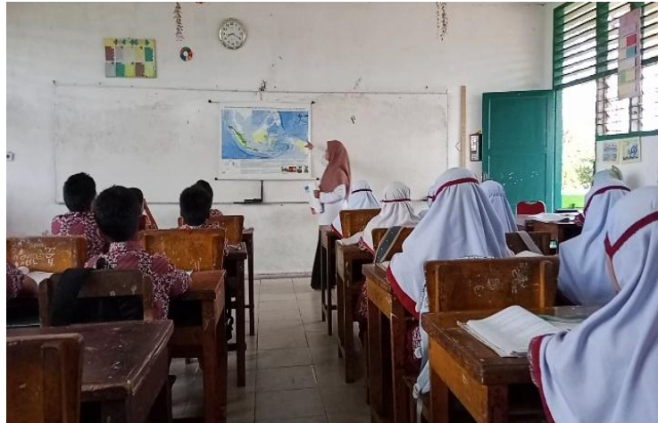
Gambar.4 kegiatan belajar siswa kelas V SDN 200117 Padangsidempuan