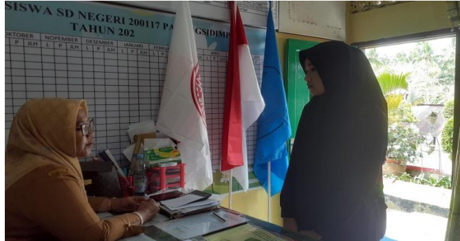
Gambar.1 Wawancara dengan kepala sekolah SDN 200117 Padangsidimpuan