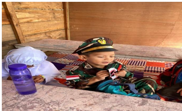
Gambar 4.4 anak sedang memasukkan tali ke lobang Sepatu

Kegiatan ditutup dengan rutinitas harian yang menanamkan nilai religiusitas, yaitu berdoa bersama. Anak-anak menyanyikan lagu perpisahan, berbaris rapi, dan bersiap untuk pulang. Dengan tahapan ini, pembelajaran berakhir dengan kesan positif, membuat anak merasa dihargai dan termotivasi untuk belajar di pertemuan berikutnya.