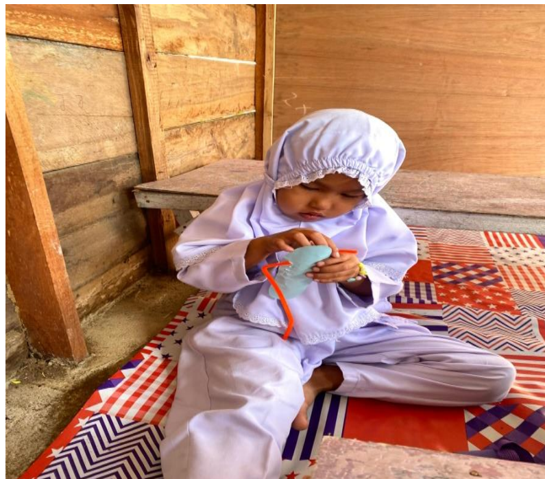
Gambar 6. Anak mengikat sepatu dari kertas Anak berusaha mengikat sepatu tanpa bantuan