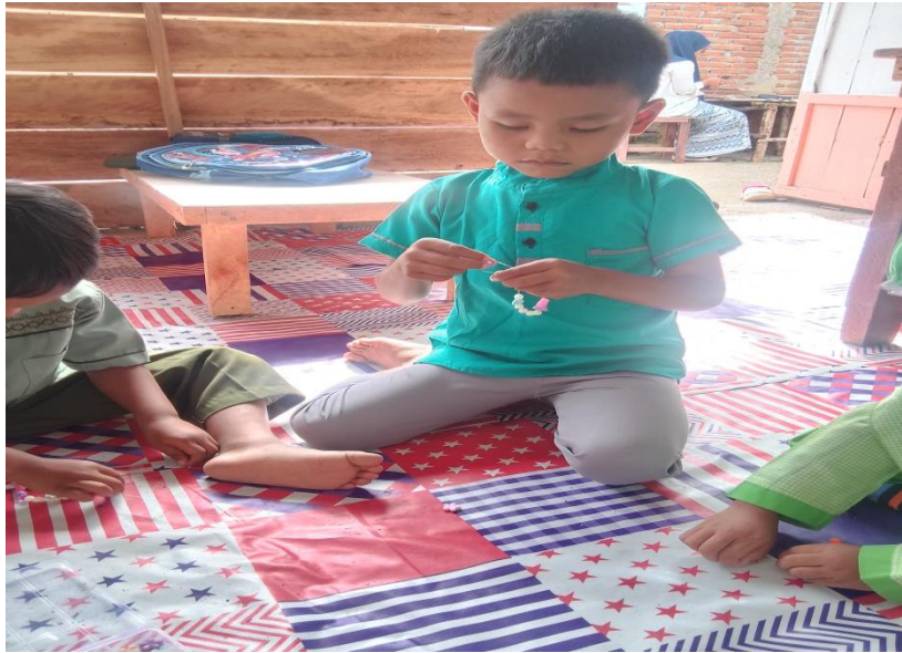
Gambar 7. Meronce gelang Anak berusaha membuat gelang tanpa meminta bantuan