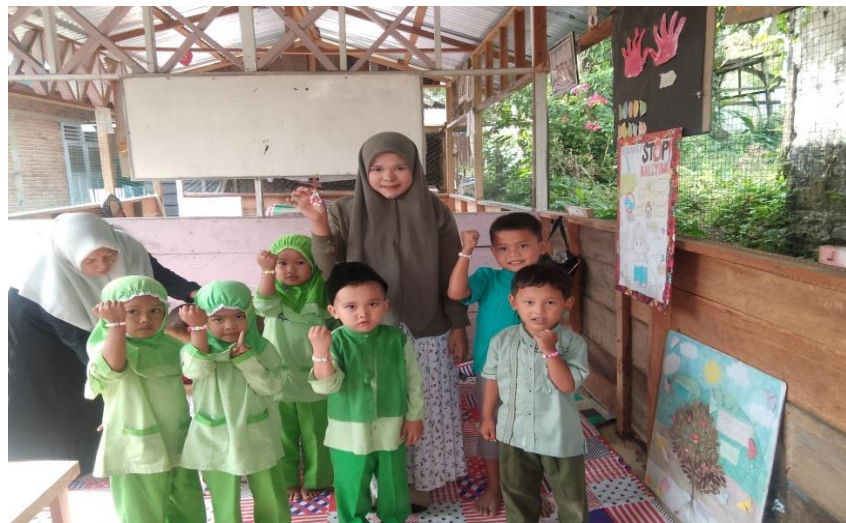
Gambar 4. Hasil meronce gelang persahabatan Hasil roncean gelang persahabatan yang di buat dari kegiatan hari ini