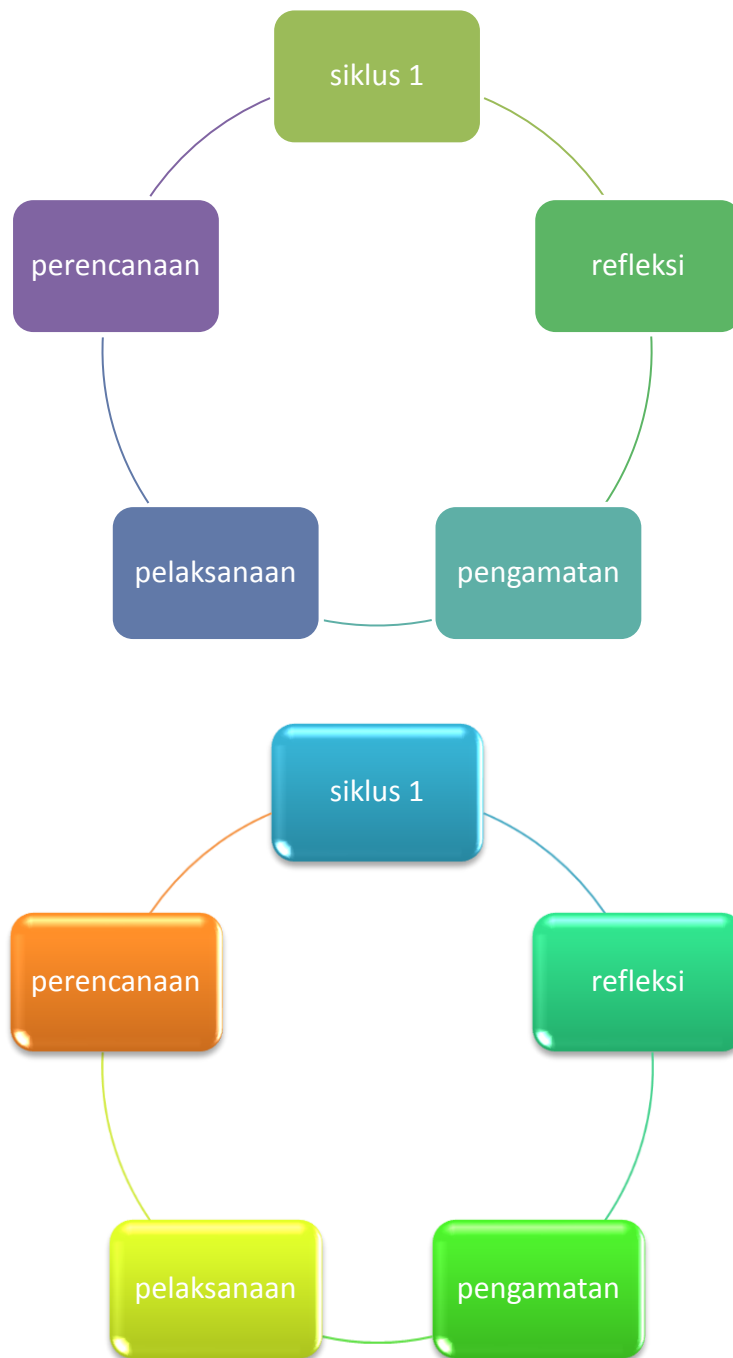
Gambar 3.1 Model Penelitian Tindakan Kelas