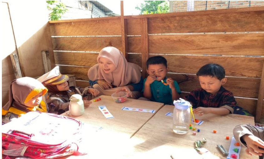
Gambar 5. Mengikat benang yang sudah selesai dironce Peneliti memberi bantuan kepada anak yang mengalami kesusahan dalam mengikat benang