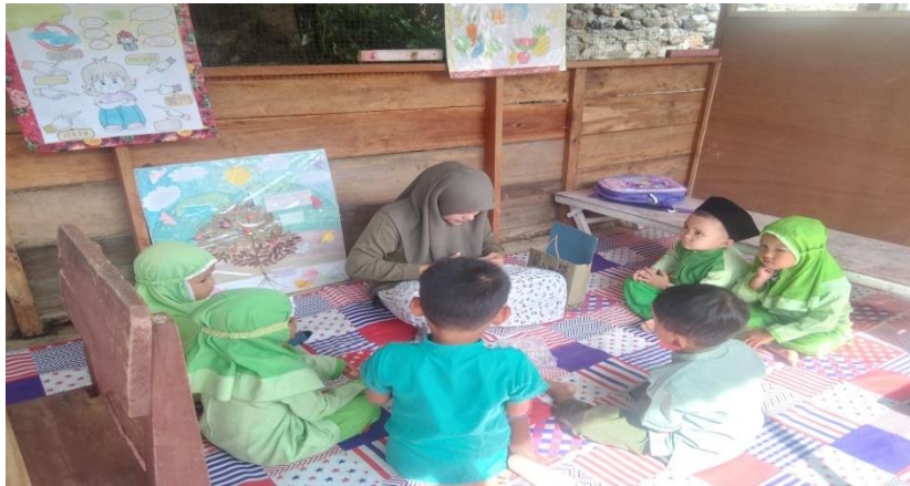
Gambar 1. Peneliti memulai kegiatan meronce

Peneliti membagikan manik-manik dan benang nilon kepada anak dan memulai roncean