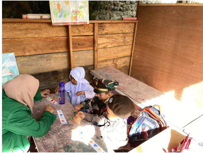
Gambar 3. Meronce sesuai pola bentuk dan warna Peneliti menjelaskan cara kerja meronce sesuai pola bentuk dan warna