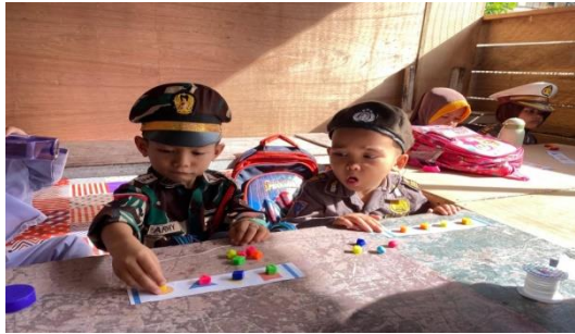
Gambar 4.3 Aktivitas anak menyusun roncean sesuai pola