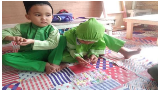
Gambar 4.2 Aktivitas anak menyusun roncean

Guru memberikan pujian dan apresiasi kepada anak atas usaha setiap anak mengikuti kegiatan di kelas. Kemudian guru menutup pembelajaran dengan bernyanyi bersama kemudian membaca doa dan salam.