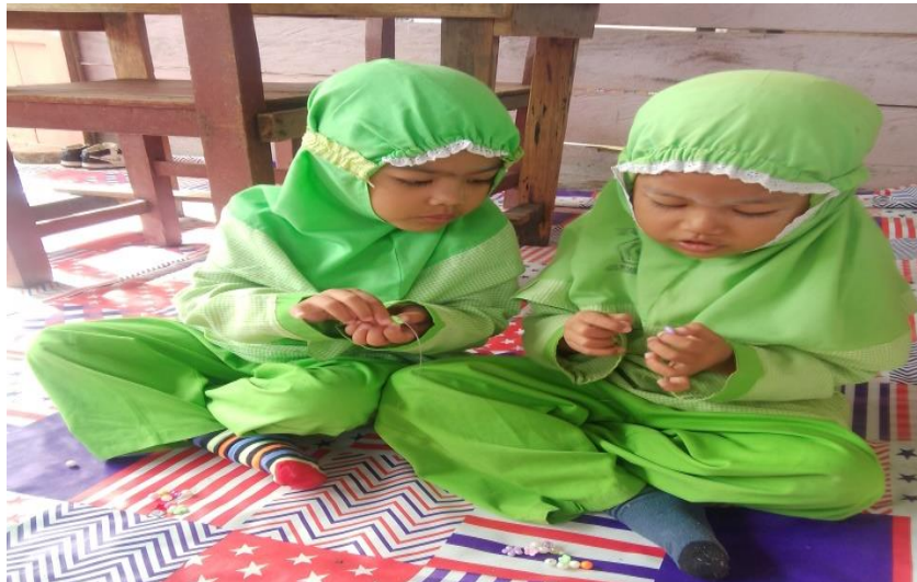
Gambar 2. Bekerja sama dalam kegiatan

Peneliti membagikan manik-manik dan benang nilon kepada anak dan memulai roncean