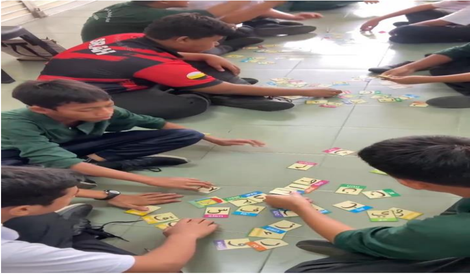
يقوم التلاميذ بترتيب بطاقة الهجائية