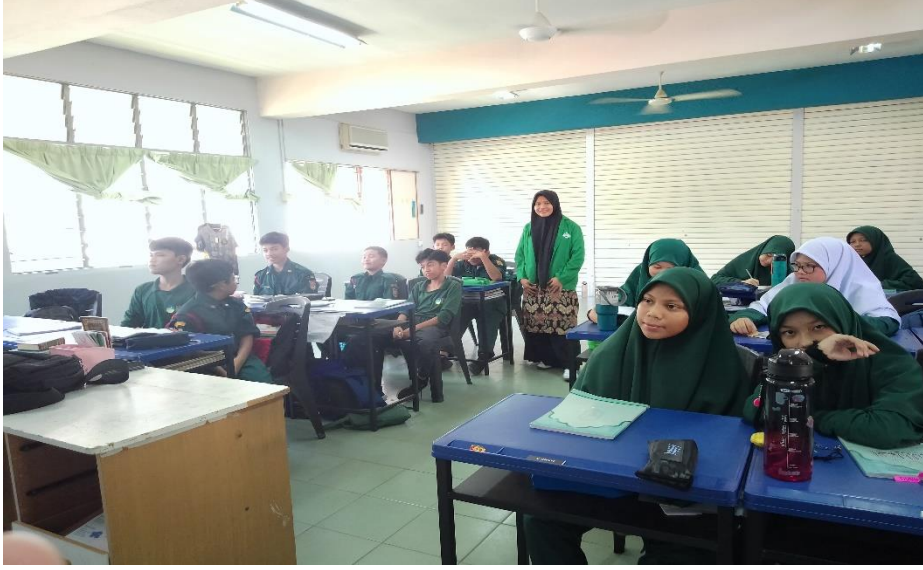
عندما يقوم المعلم بالتعليم في المرحلة الأول مدرسة الثانوية إيبوه، بيراك، ماليزيا