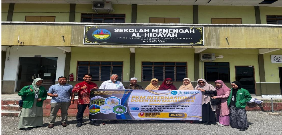
الصورة مع المعلم مدرسة الثانوية إيبوه، بيراك، ماليزيا و الموجهين من الجامعة الإسلامية الحكومية شيه علي حسن أحمد الداري بادنچ سيدمبوان