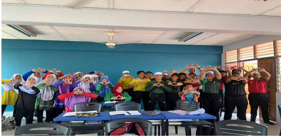
الصورة مع التلاميذ مرحلة الأول في مدرسة الثانوية إيبوه، بيراك، ماليزيا