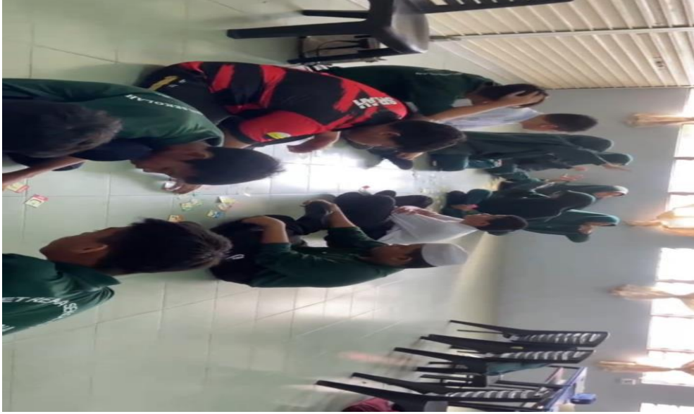
يقوم المعلم بتنفيذ لعبة بطاقة الهجائية