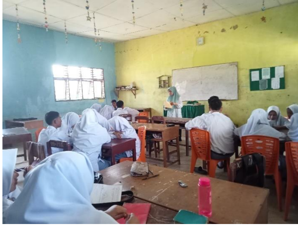
صور ٤. ٤ تقسم المعلمة التلاميذ