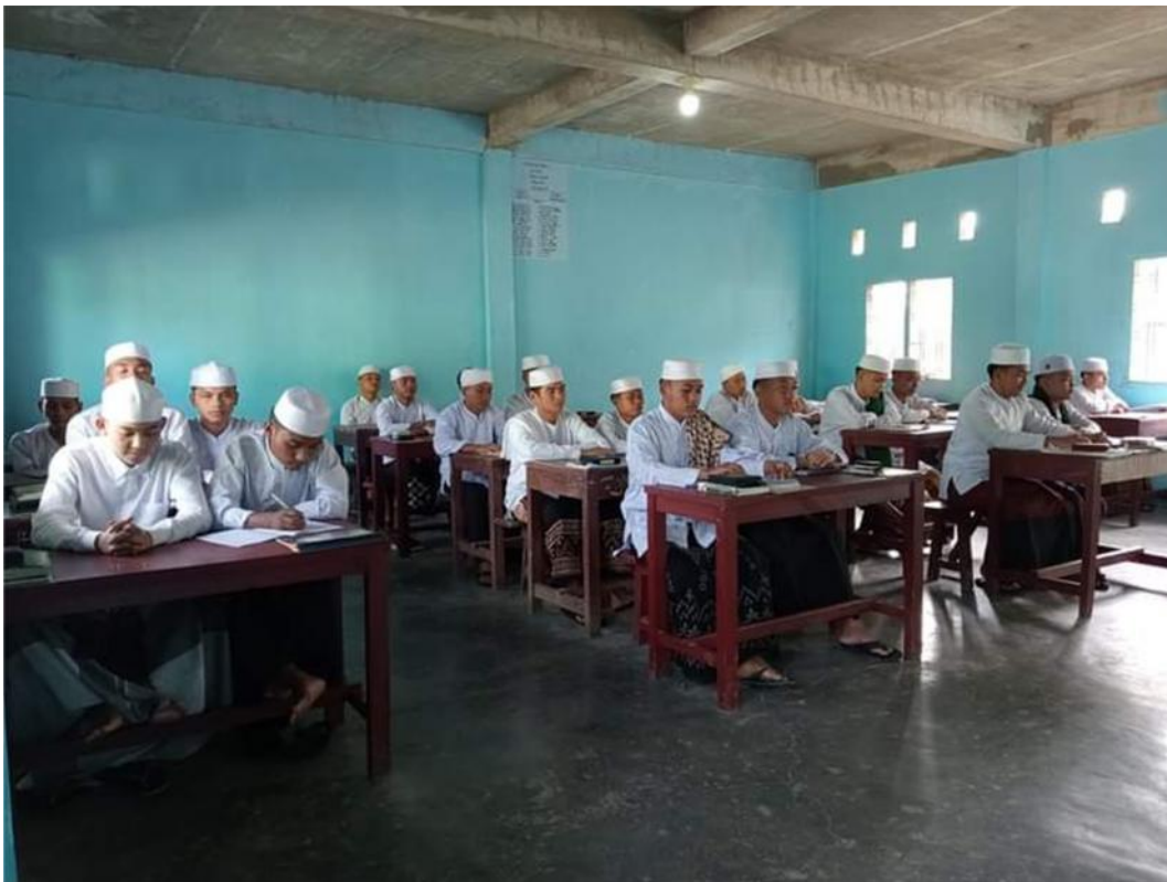
Proses Pembelajaran Bahasa Arab