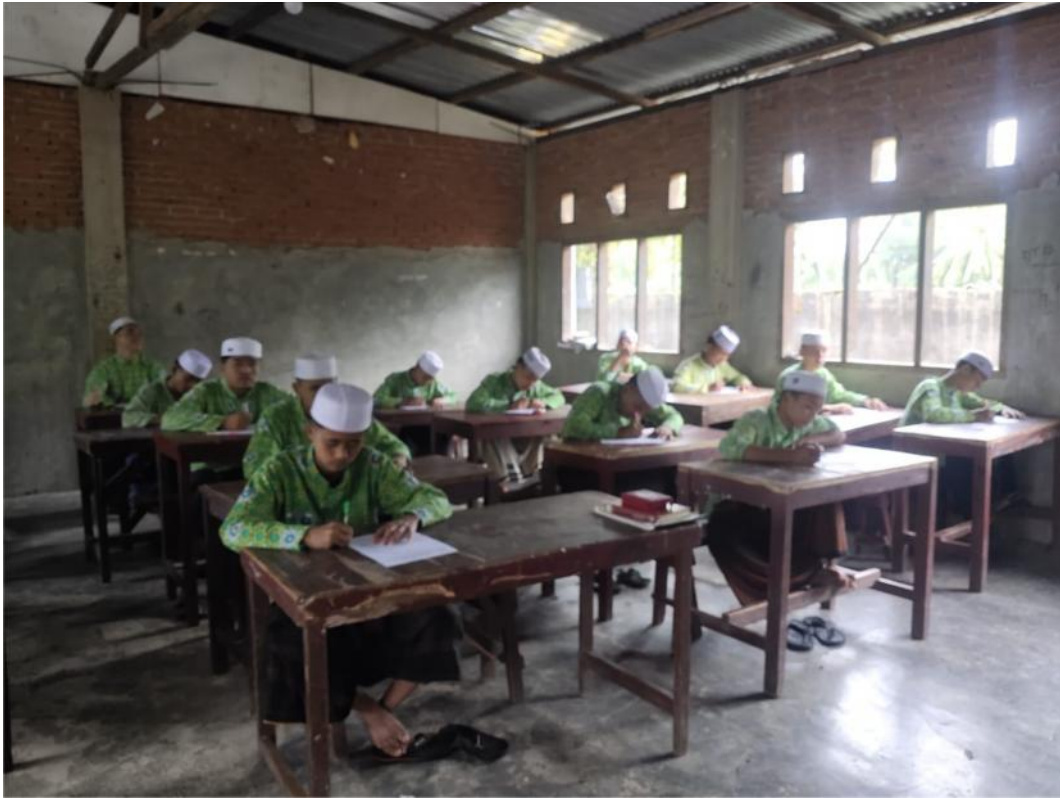
Latihan Mengarang Bahasa Arab