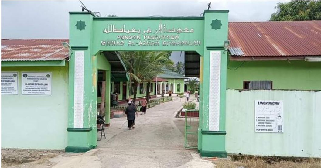
Gerbang Pesantren Ma'had Al-Azhar Bi'ibadilla