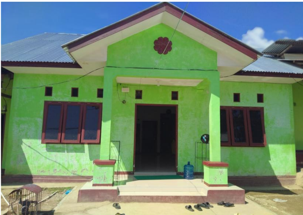
Ruang guru Lampiran