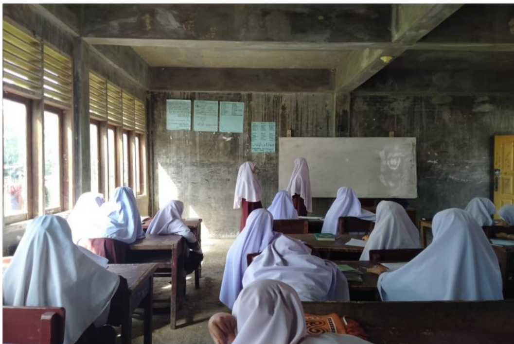
Proses Pembelajaran Bahasa Arab