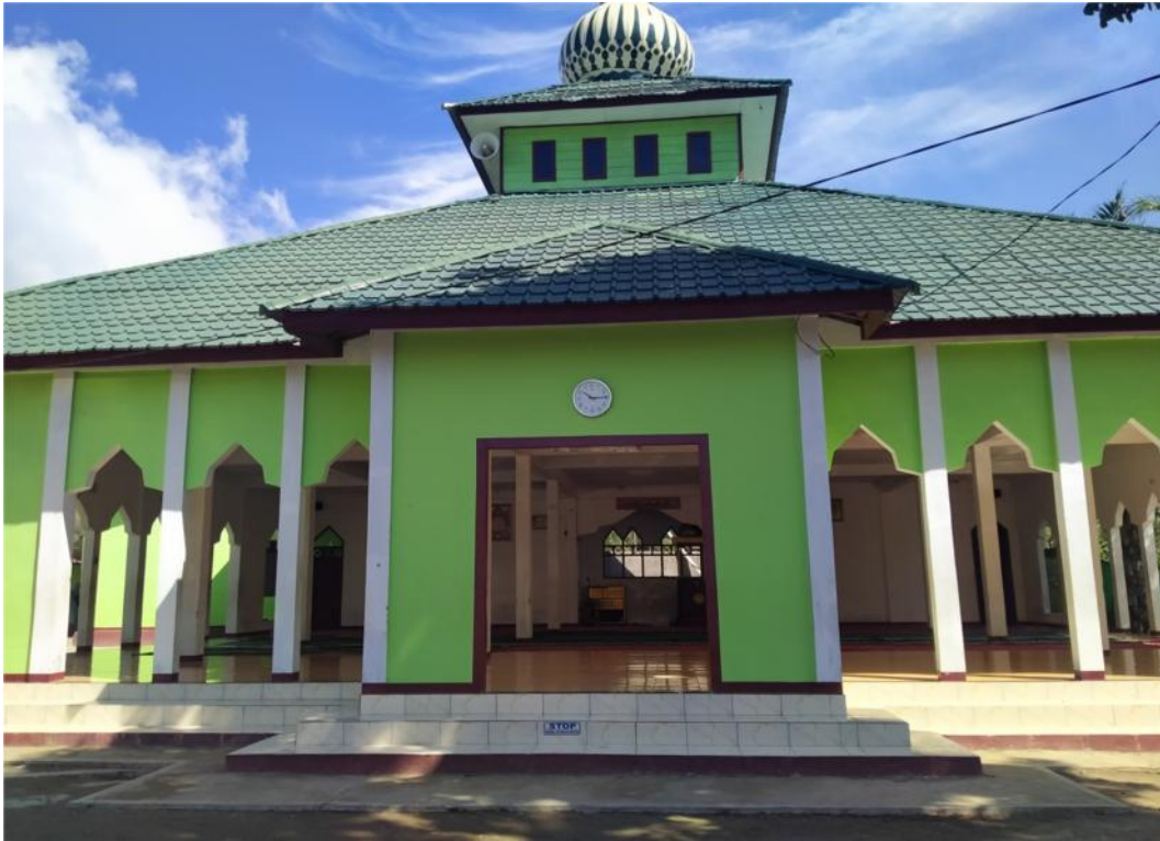
Masjid Pesantren Ma'had Al-Azhar Bi'ibadillah