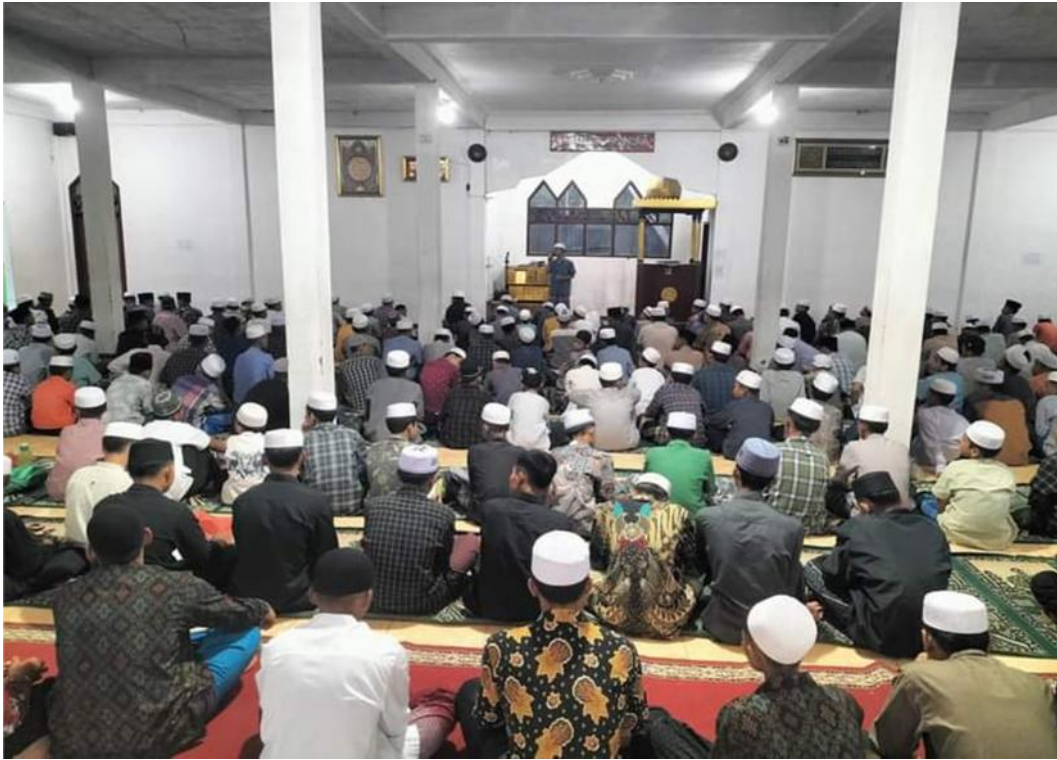
Khutbah Bahasa Arab Setelah Solat Fardu