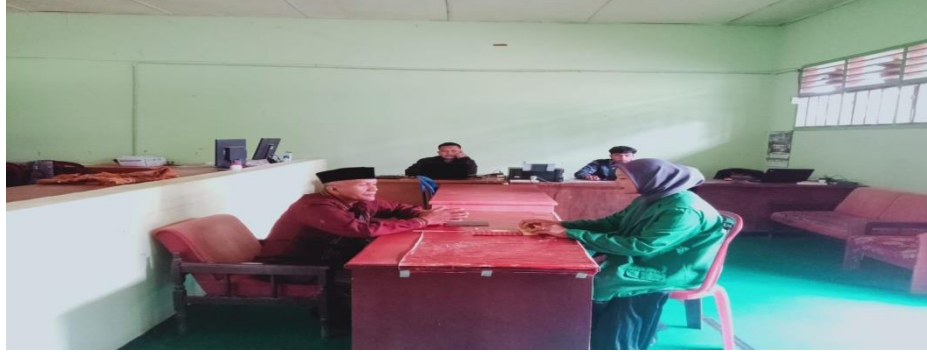
مقابلة مع رئيس مدرسة التدريب بمدرسة المتوسطة الإسلامية الحكومية الثانية سيباغمبر تبانولي الجنوبية.