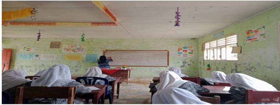
مدرسة اللغة العربية للفصل السابع بمدرسة المتوسطة الإسلامية الحكومية الثانية سيباغمبر تبانولي الجنوبية كتابة المفردات على السبورة لدرسة اليوم