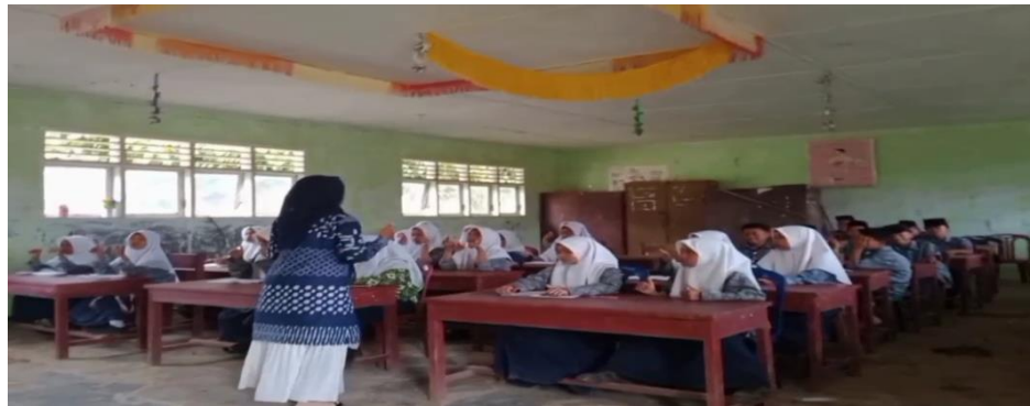
بعد أن يقوم المعلم بكتابة المفردات على السبورة ثم يقوم المعلم بالتدرب على المفردات بطريقة الغناء.