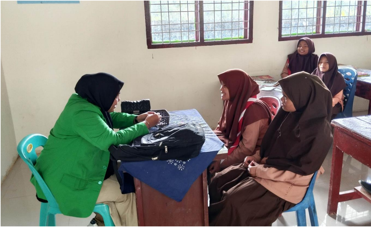
مقابلة الباحثة مع التلميذة في مدرسة الثانوية الحكومية تابانولي الشمالية