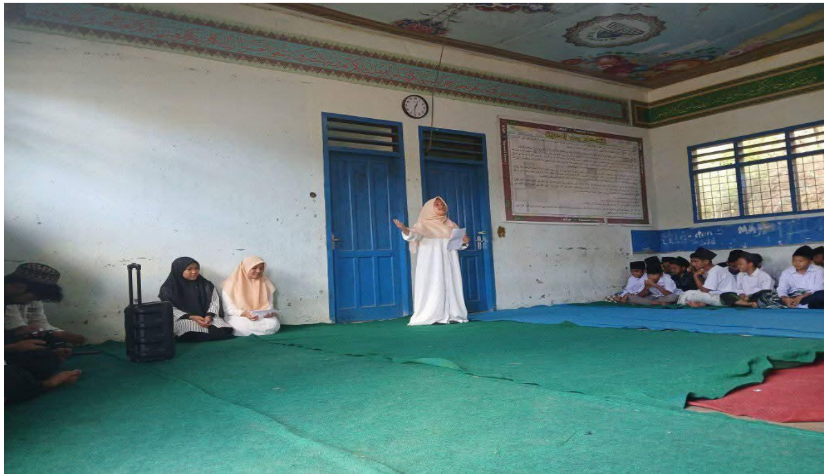
خطاب تبليغ أكبر باللغة العربية مدرسة الثانوية الحكومية تابانولي الشمالية