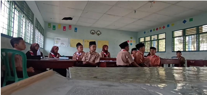
صورة ٤,٢ ملاحظة طريقة المناقشة

٣٠ توثيق حول طريقة المناقشة في مدرسة الثانوية الحكومية تابانولي الشمالية، (بينورنور، ١٨ يناير