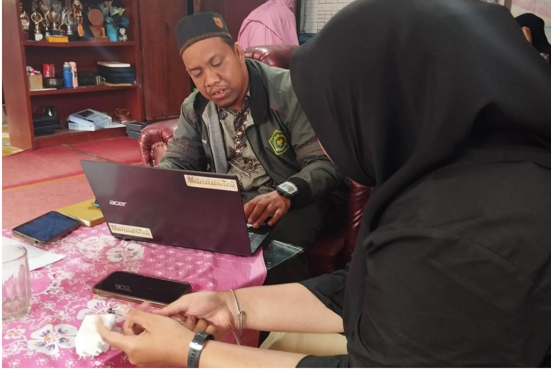
مقابلة مع مدرس اللغة العربية