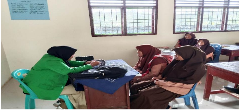
صورة ٤,١ مقابلة طريقة المناقشة

توثيق المقابلة الباحثة مع الطالبات عن طريقة المناقشة في تعليم اللغة