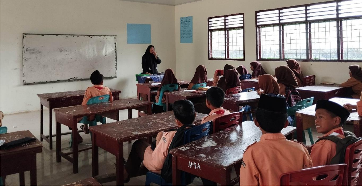
تعليم اللغة العربية في فصل