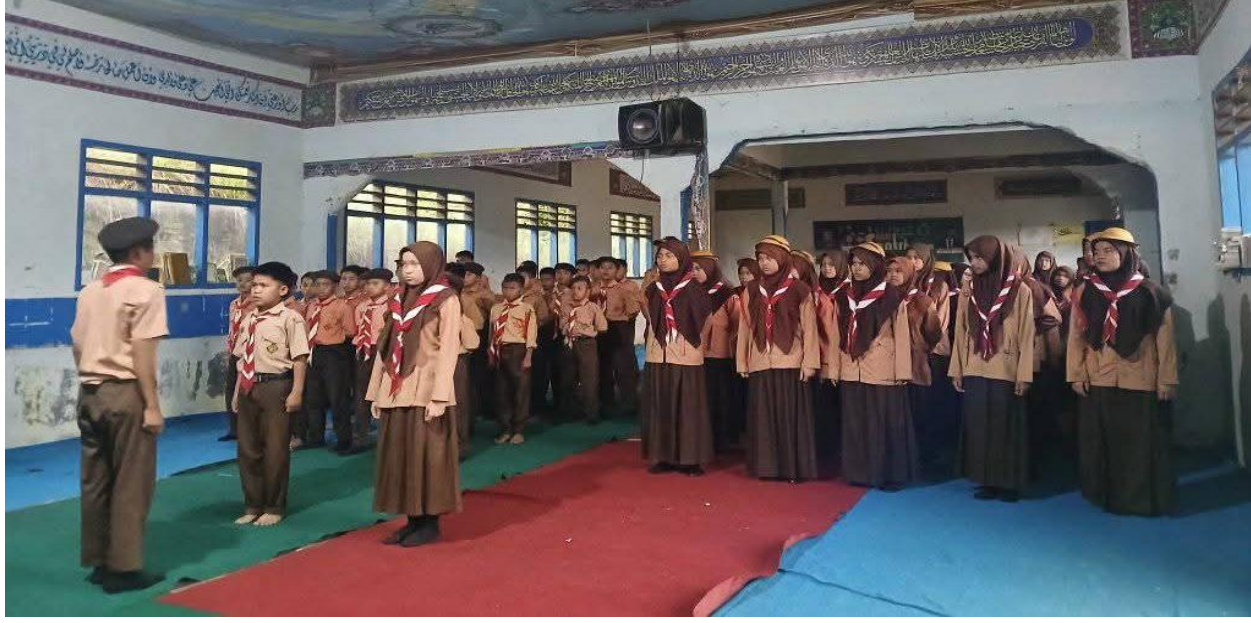
الأنشطة الكشفية مدرسة الثانوية الحكومية تابانولي الشمالية